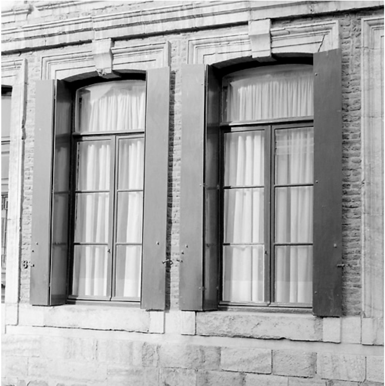
Façade rue de l'Escaut, rez-de-chaussée, vue partielle : baies.