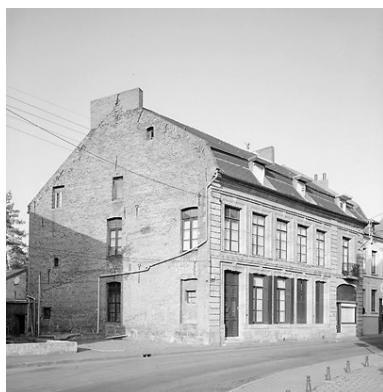
Vue générale de trois quarts ; le mur-pignon de la maison