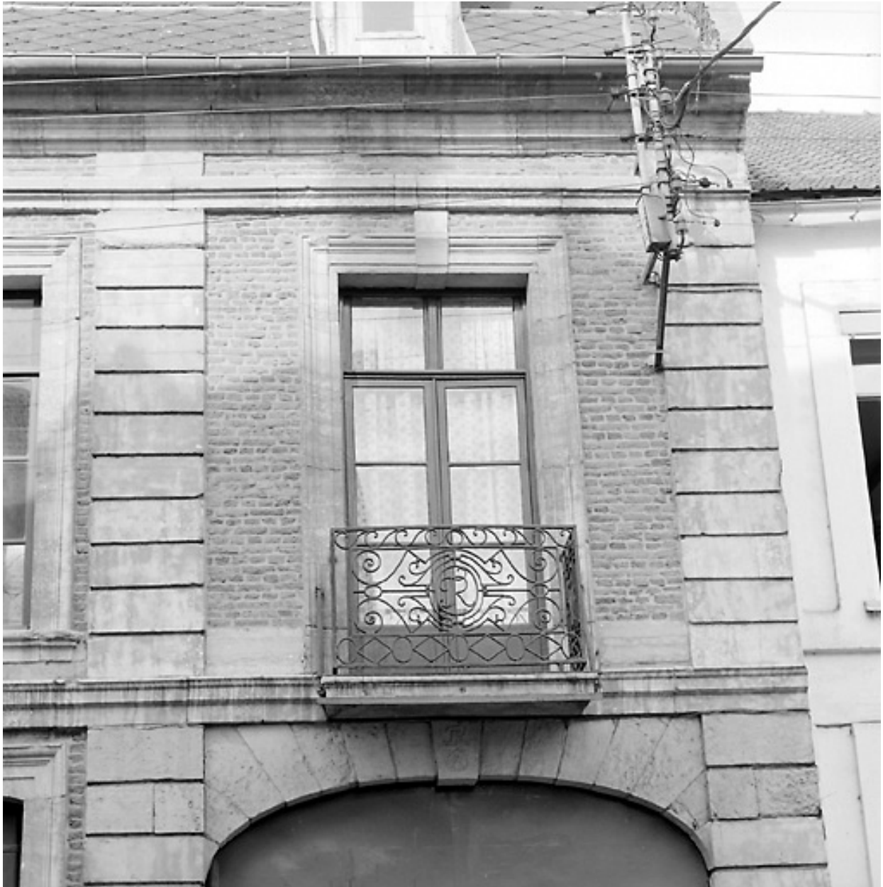
Façade rue de l'Escaut, vue partielle, travée de droite : garde-corps de balcon portant les initiales TR (Thomas Rasez) ; sur la clef d'arc, les mêmes initiales et les ancrs croisés de bateliers.