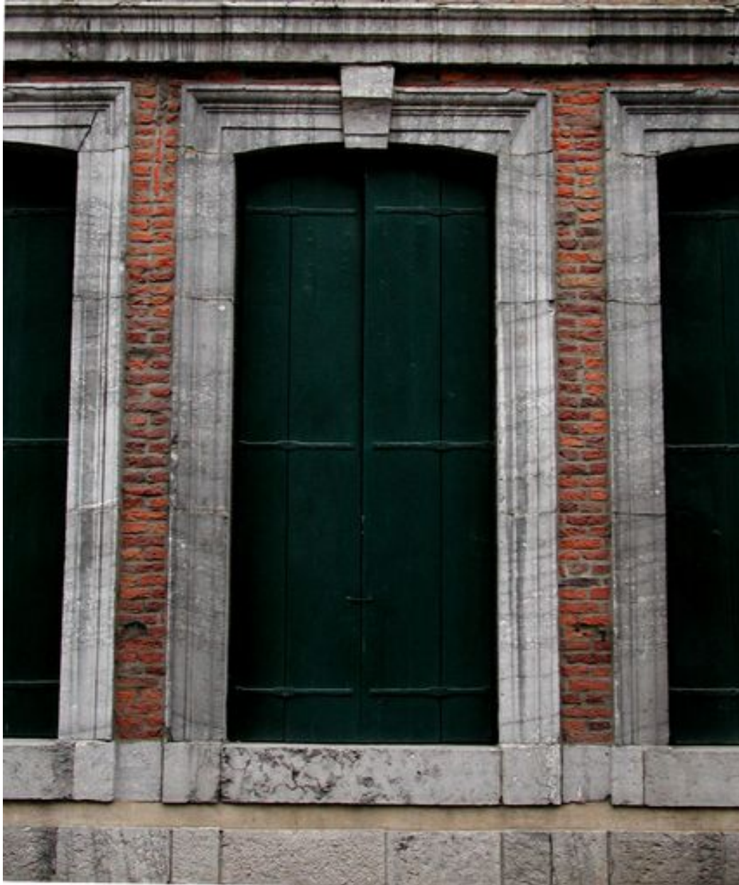
Façade rue de l'Escaut, rez-de-chaussée, vue partielle : répartition des matériaux, brique et pierre calcaire.