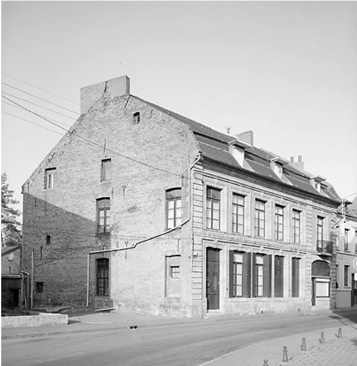
Vue générale de trois quarts ; le mur-pignon de la maison donnait sur le cours de la Haynette, maintenant comblé.