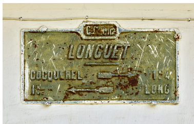
Détail de la plaque directionnelle accroché sur la maison.