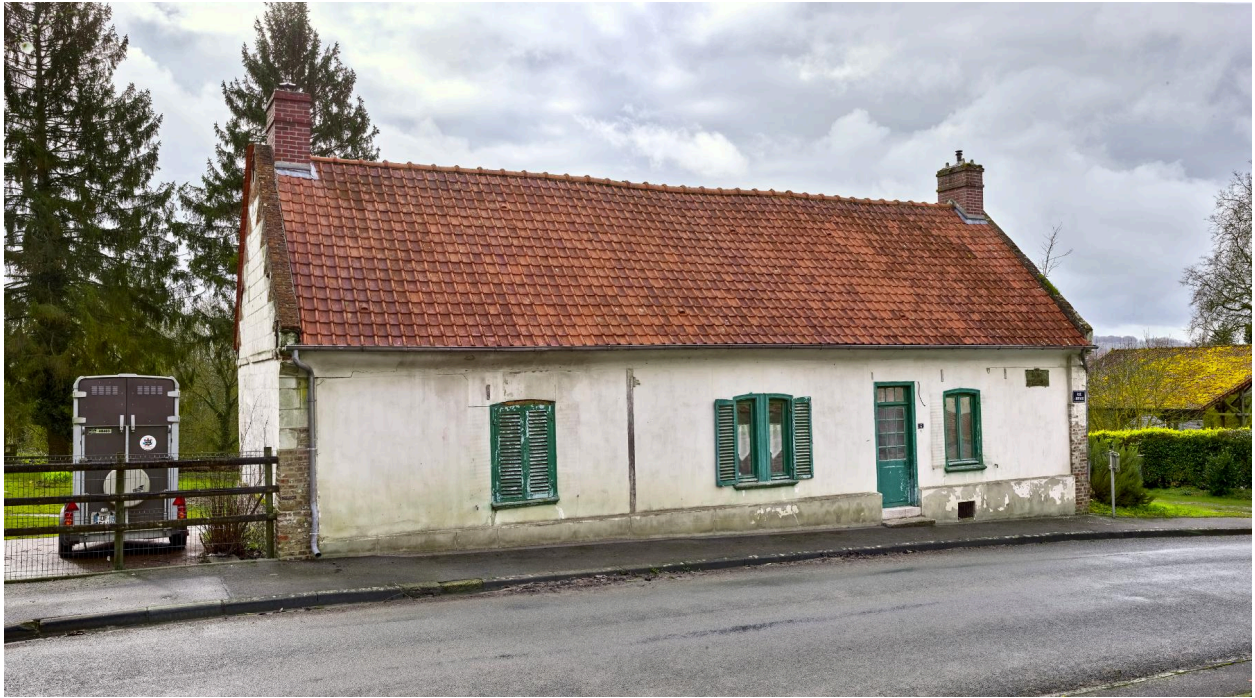
Maison, depuis le nord.