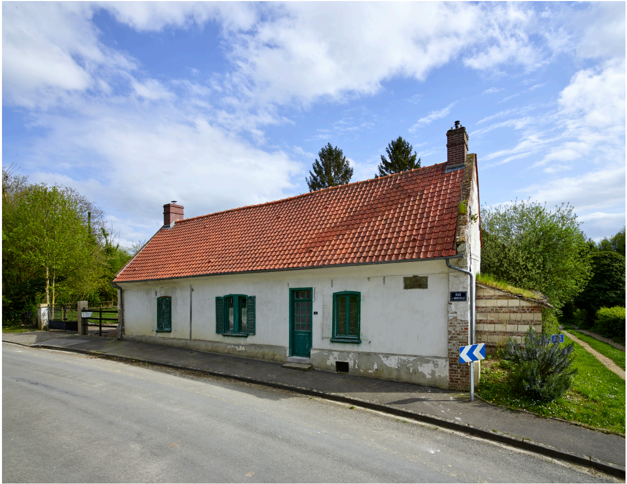
Maison, depuis le nord-ouest.