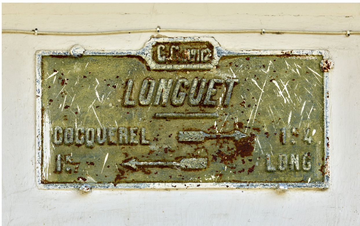
Détail de la plaque directionnelle accroché sur la maison.