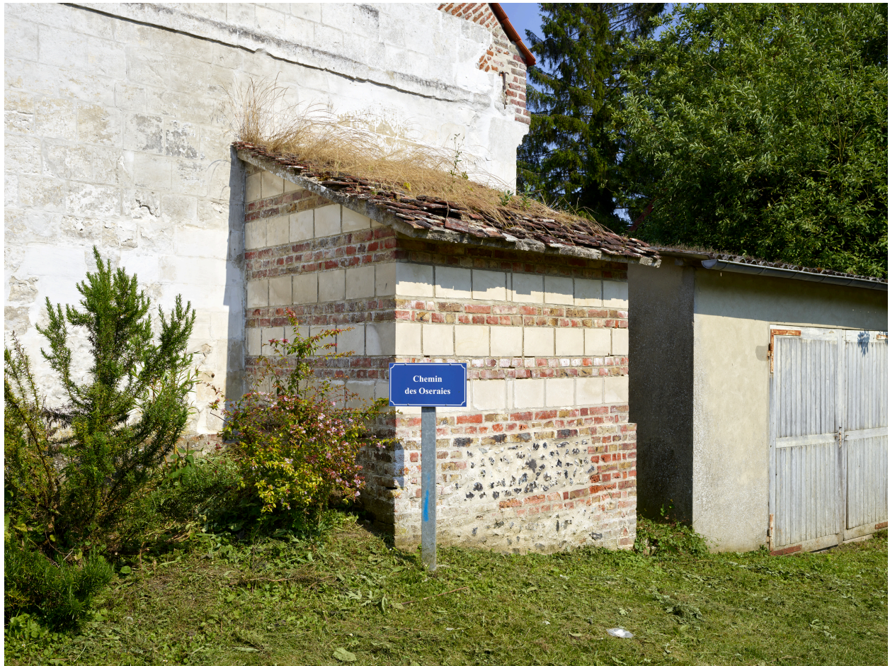
Détail du four à pain, depuis le nord-ouest.