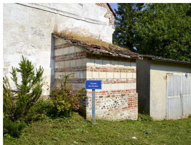
Détail du four à pain, depuis le nord-ouest.