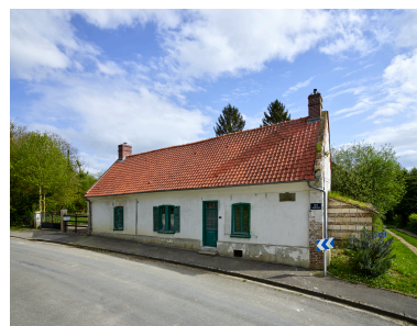
Maison, depuis le nord-ouest.