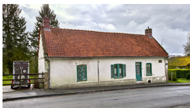
Maison, depuis le nord. IVR32_20248000298NUCA

IVR32_20238005317NUCA