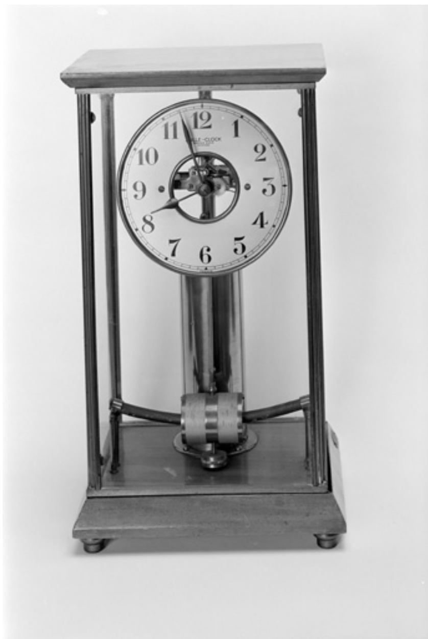
Pendule Bulle Clock, bois, laiton et verre, XXe siècle.