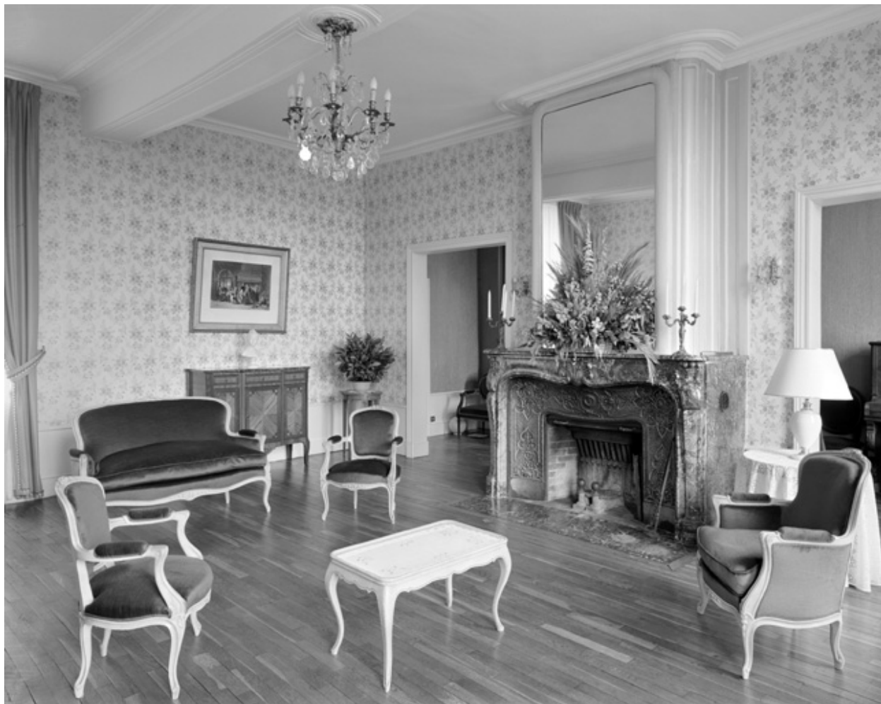
Le salon de réception.