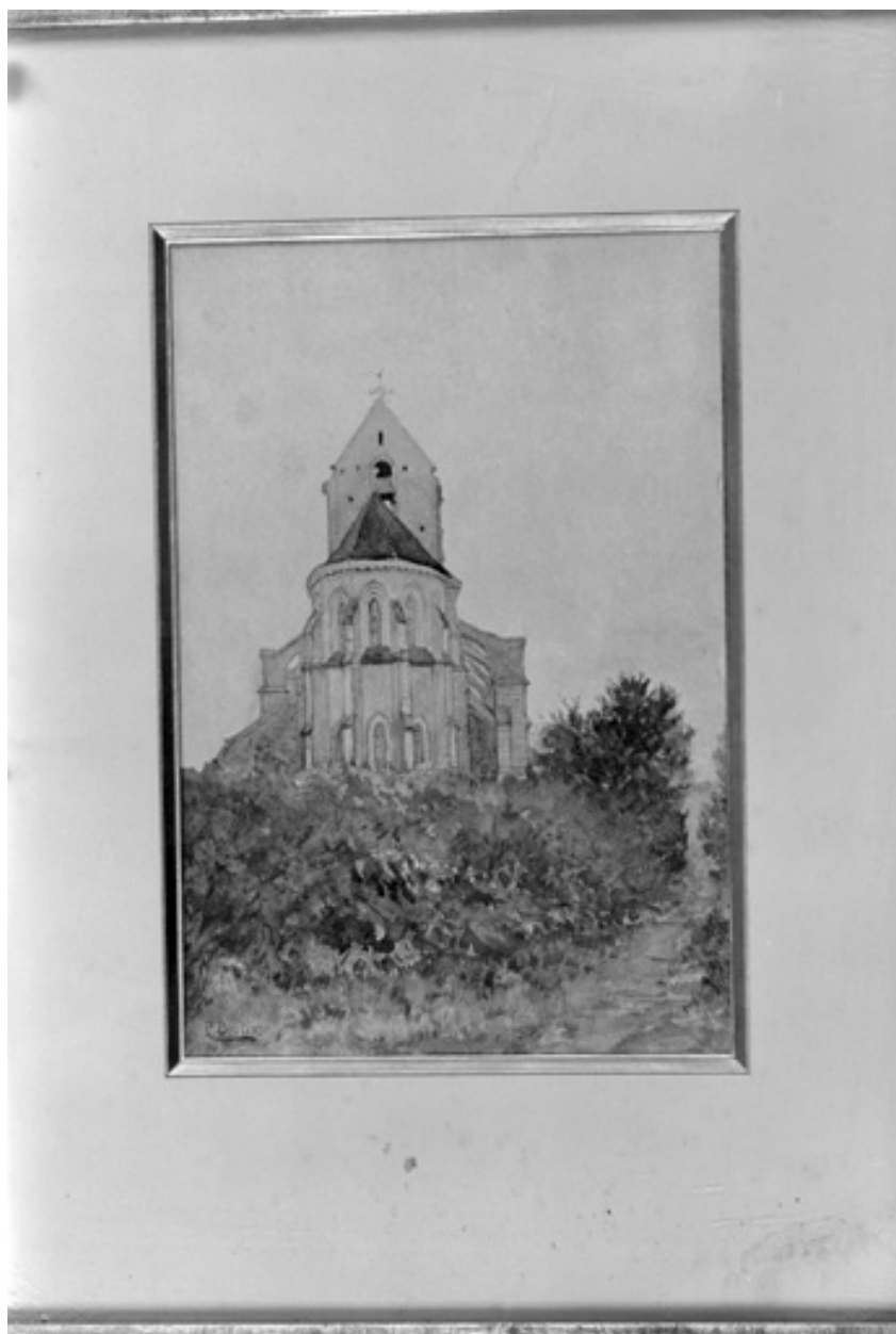
Aquarelle, signée P. Bertin, début XIXe siècle ; dépôt du musée La Fontaine.