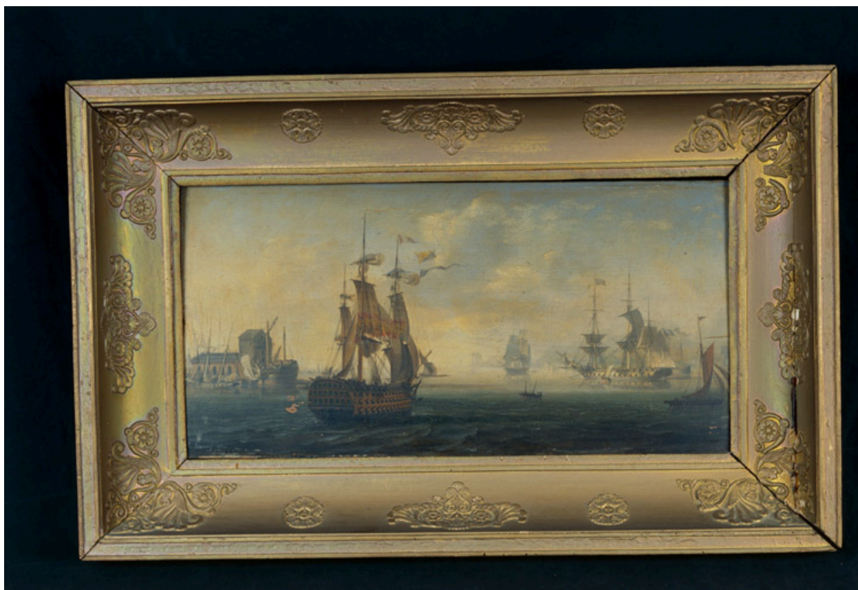
Huile sur bois, signée Garneray, 1826 ; dépôt du musée La Fontaine.