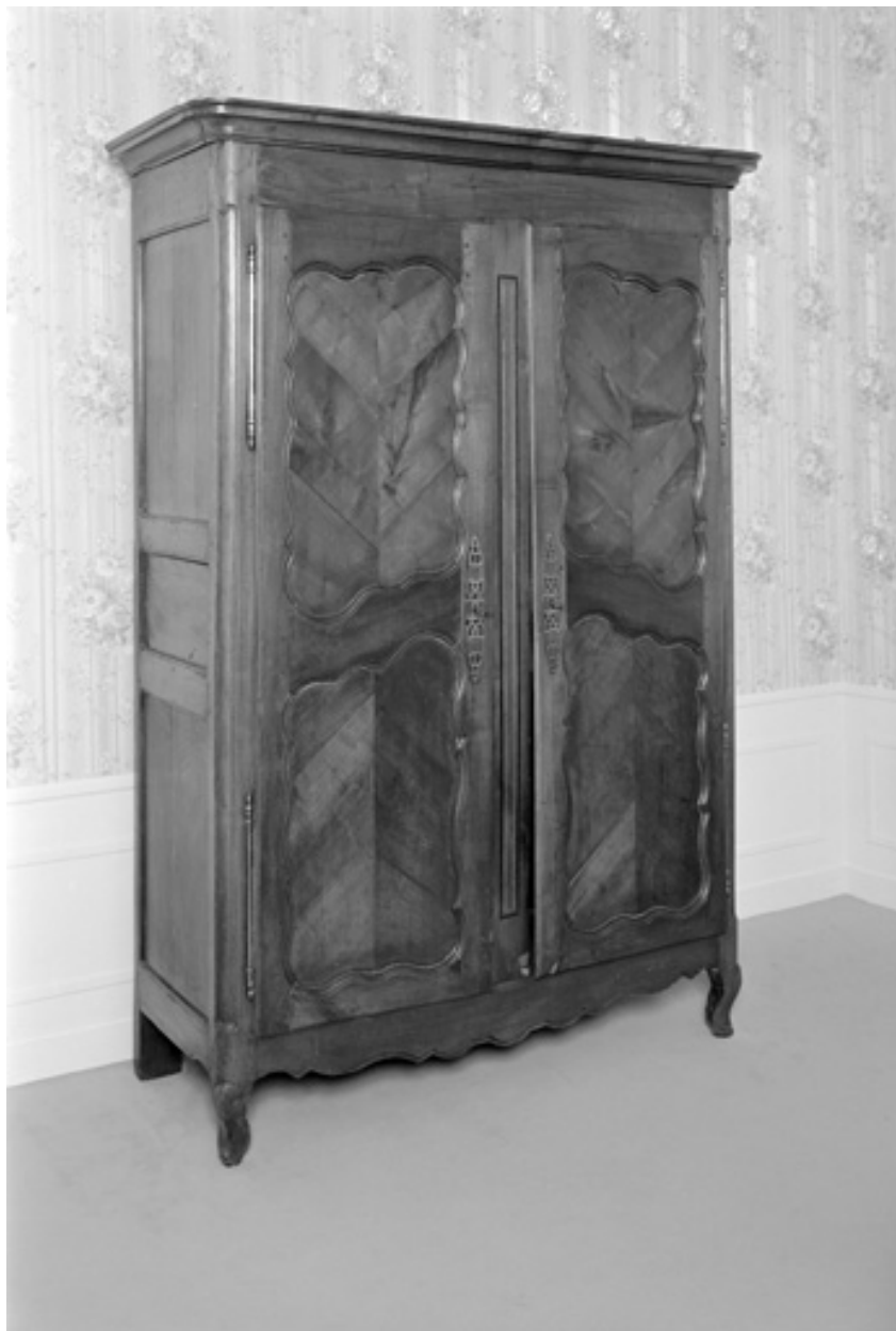
Armoire, chêne, XIXe siècle.