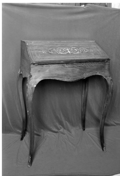
Secrétaire, début XIXe siècle. IVR22_19930202073X