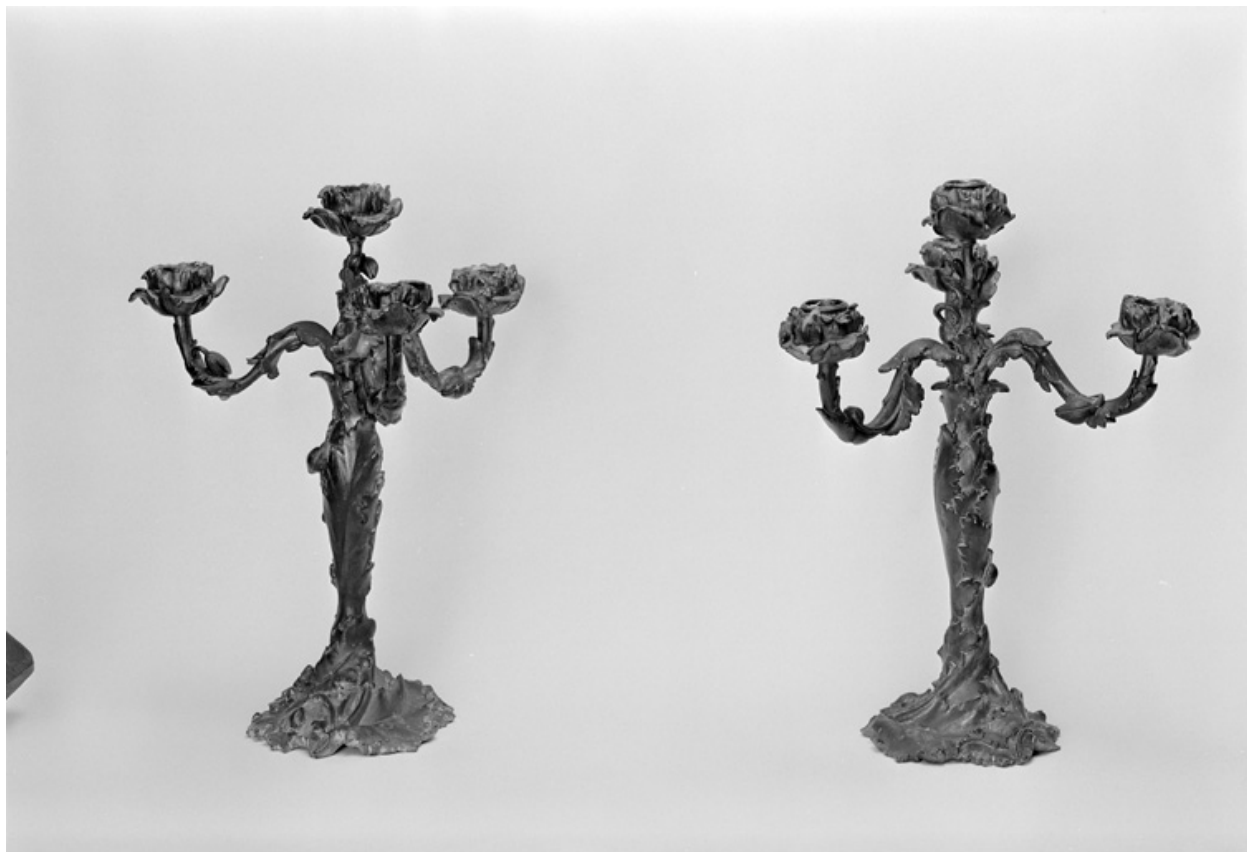
Paire de flambeaux Art Nouveau, bronze doré, cachet E. Colin ; début XXe siècle.