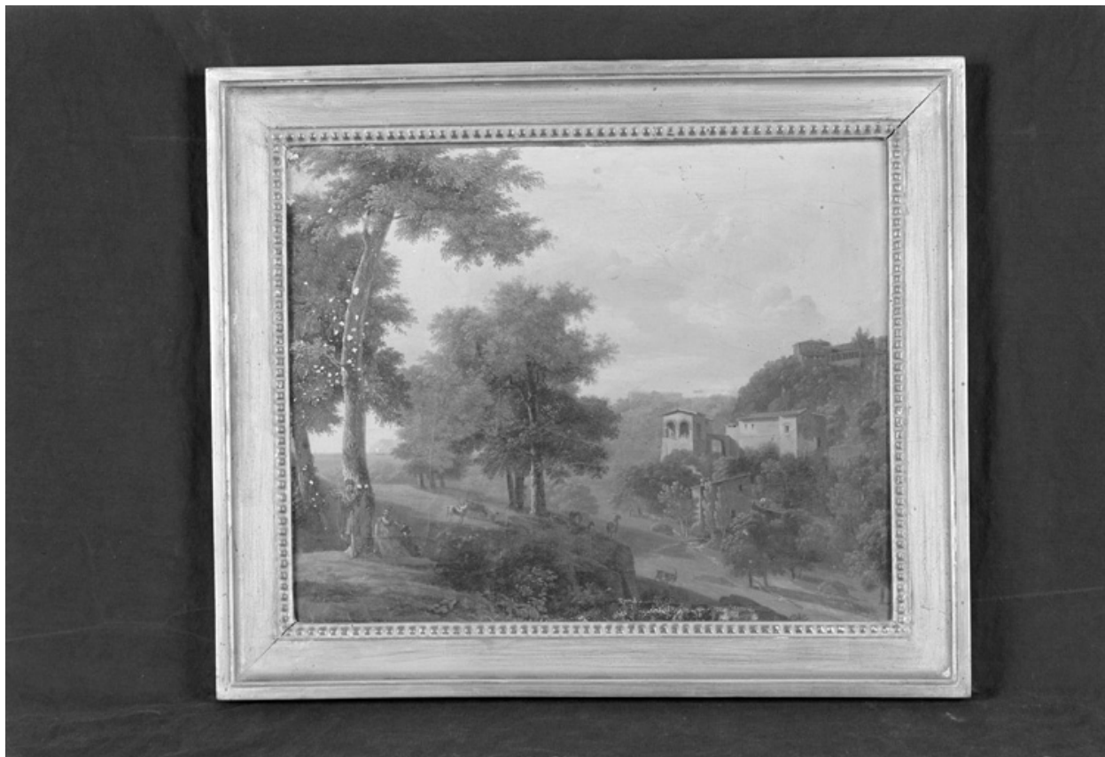
Huile sur toile, début XIXe siècle, attribué à Bertin ; dépôt du musée La Fontaine.