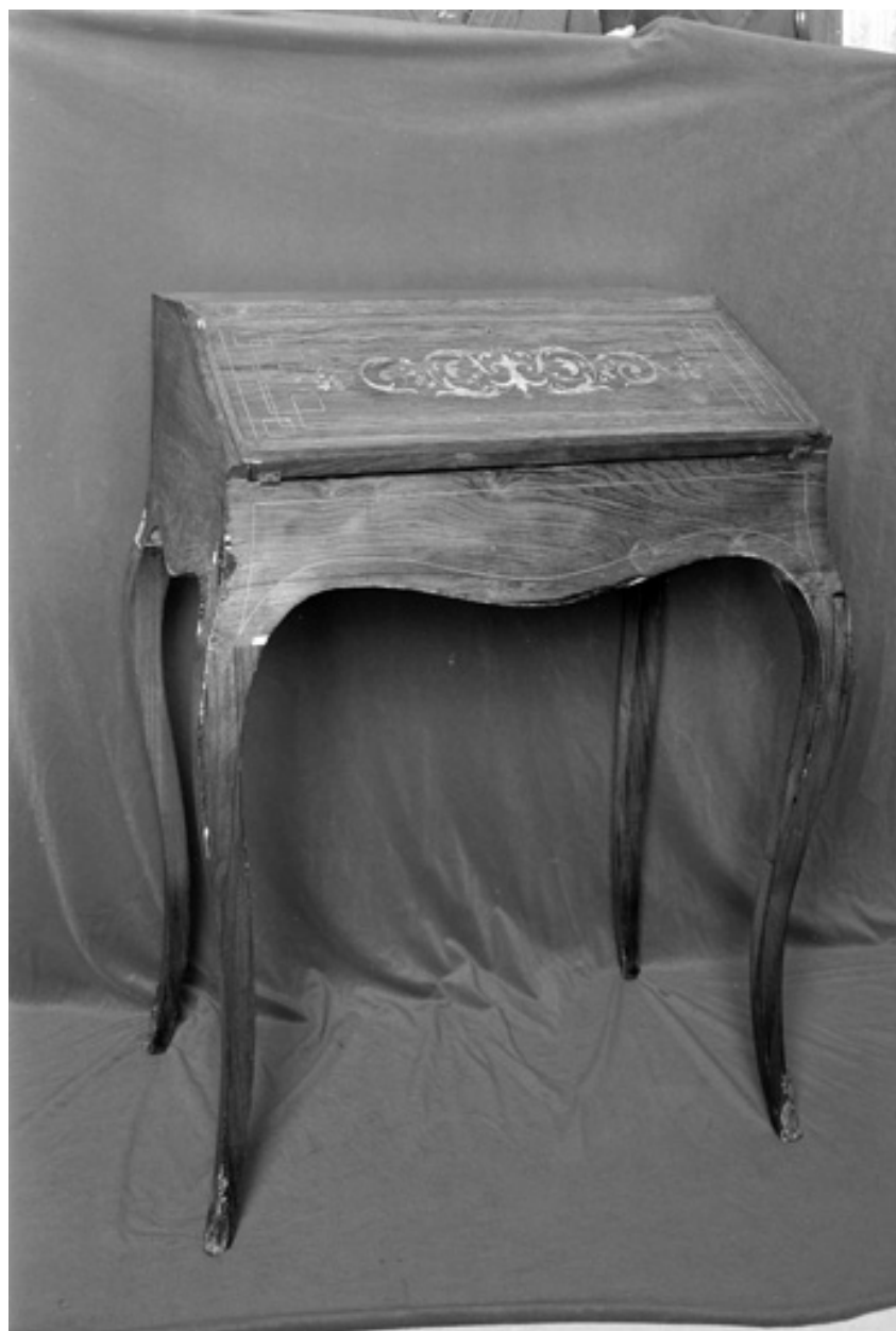
Secrétaire, début XIXe siècle.