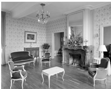
Le salon de réception.