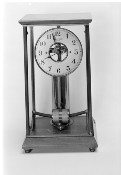
Pendule Bulle Clock, bois, laiton et verre, XXe siècle.