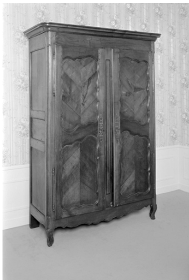
Armoire, chêne, XIXe siècle.