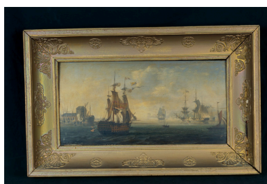
Huile sur bois, signée Garneray, 1826 ; dépôt du musée La Fontaine. IVR22_19930202494XA