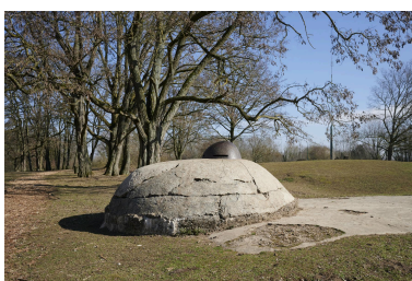
Abri casematé avec observatoire cuirassé. Détail de la coupole vers le sud-est.

IVR32_20235900270NUCA