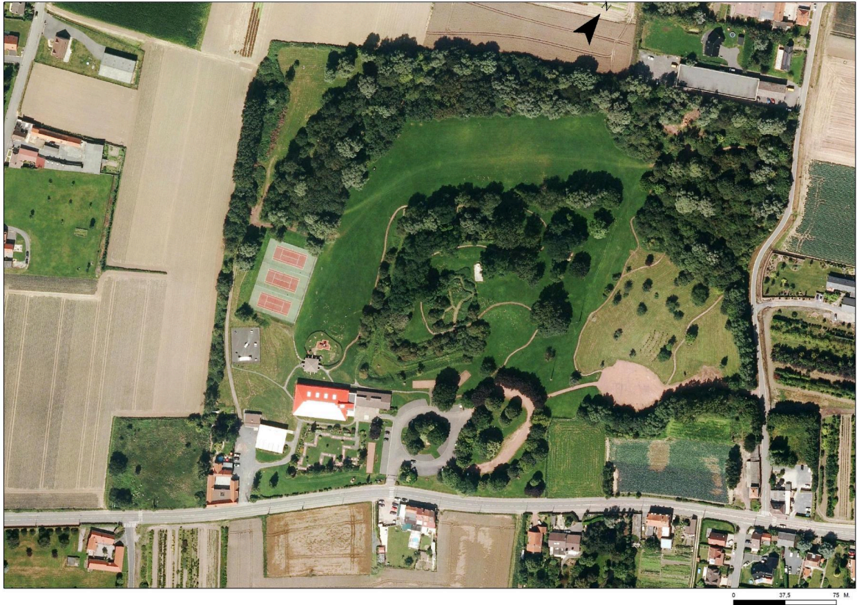
Vue aérienne du fort en partie démantelé en 2015 (Source IGN. Photothèque nationale).