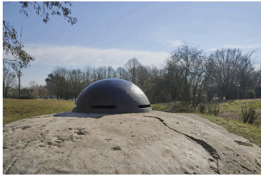
Abri casematé avec observatoire cuirassé. Détail de la coupole vers le sud. IVR32_20235900269NUCA