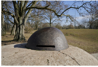
Abri casematé avec observatoire cuirassé. Détail de la coupole vers l'est.