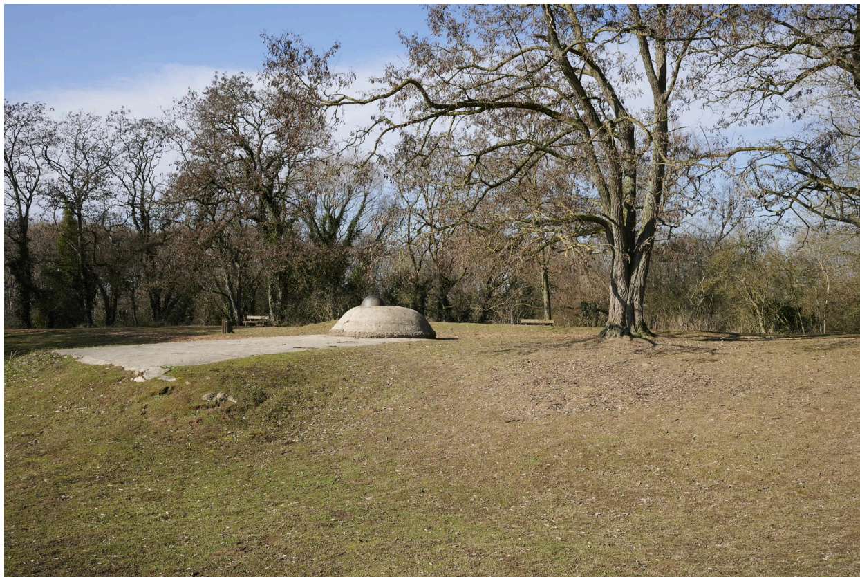
Abri casematé avec observatoire cuirassé, vers le nord-ouest.