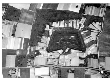
Vue aérienne du fort le 1er juin 1951.

IVR32_20225905053NUC