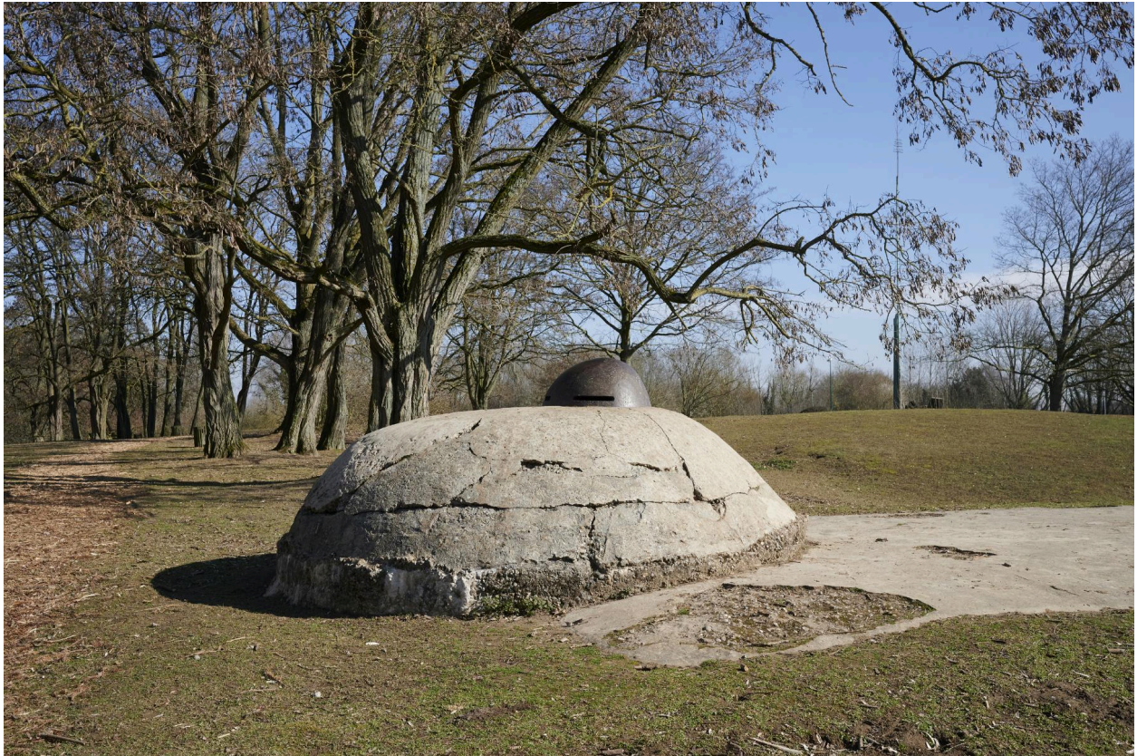
Abri casematé avec observatoire cuirassé. Détail de la coupole vers le sud-est.