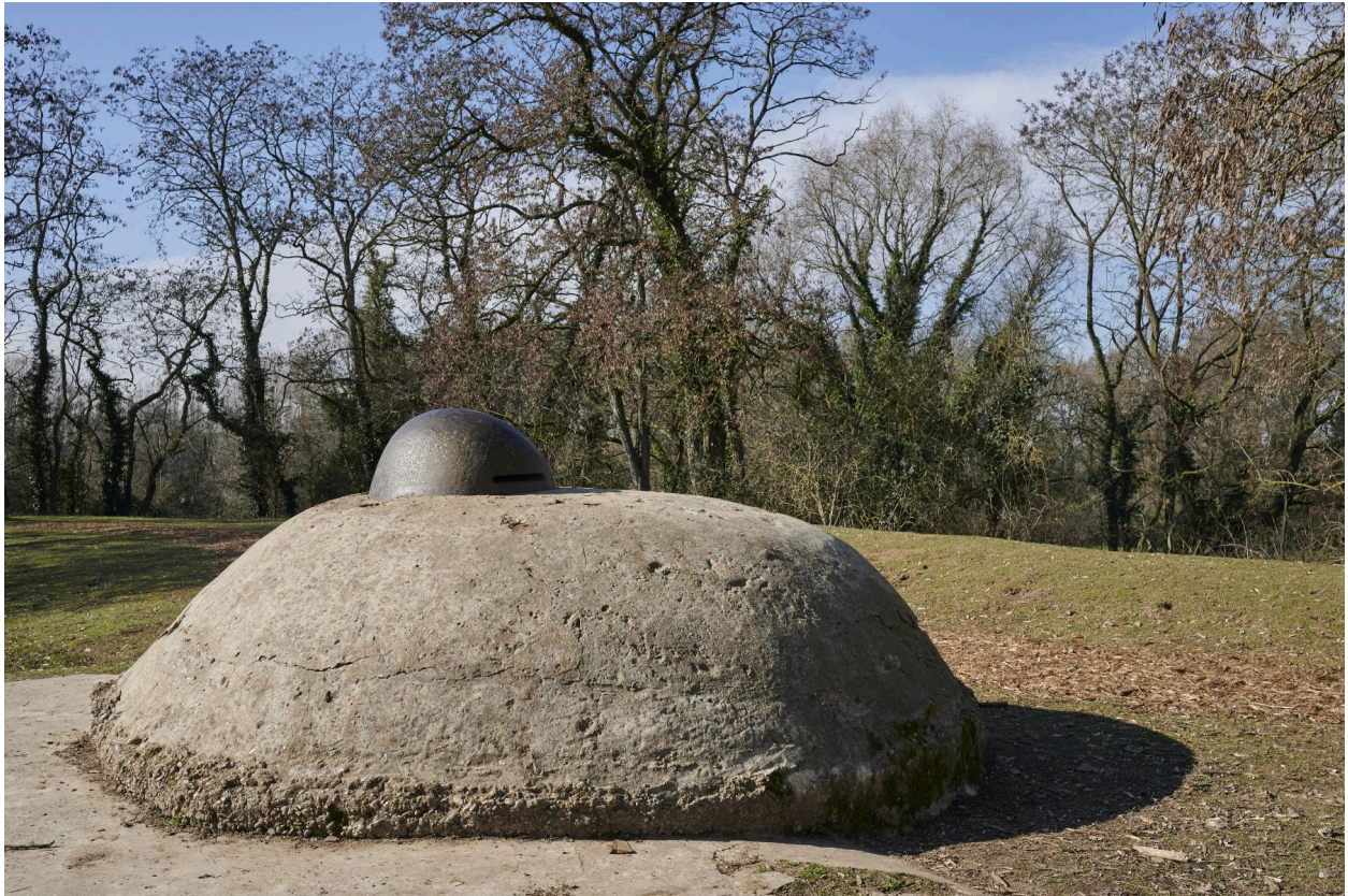
Abri casematé avec observatoire cuirassé. Détail de la coupole vers nord-ouest.