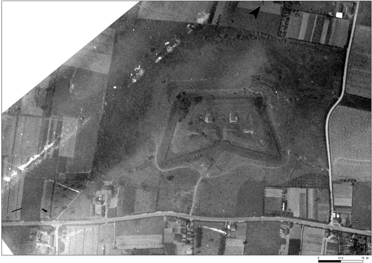
Vue aérienne du fort le 11 août 1932.