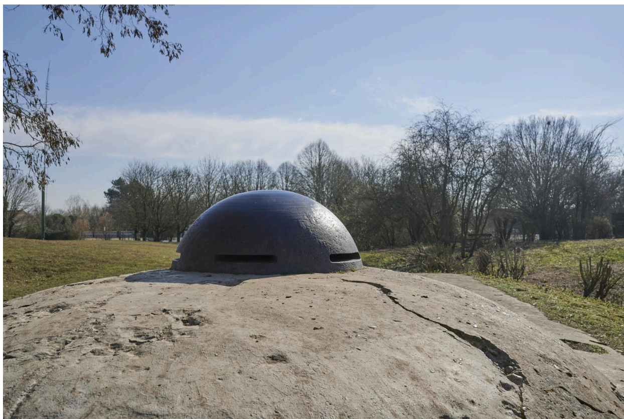
Abri casematé avec observatoire cuirassé. Détail de la coupole vers le sud.