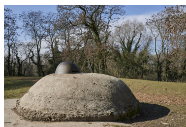
Abri casematé avec observatoire cuirassé. Détail de la coupole vers nord-ouest.

Phot. Pierre Thibaut IVR32_20235900266NUCA