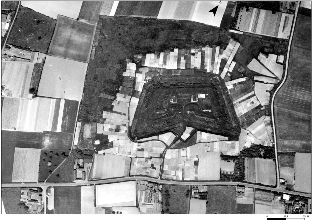
Vue aérienne du fort le 1er juin 1951 (Source IGN. Photothèque nationale).