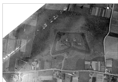
Vue aérienne du fort le 11 août 1932.

IVR32_20225905053NUC