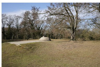
Abri casematé avec observatoire cuirassé, vers le nord-ouest.

IVR32_20225905055NUC