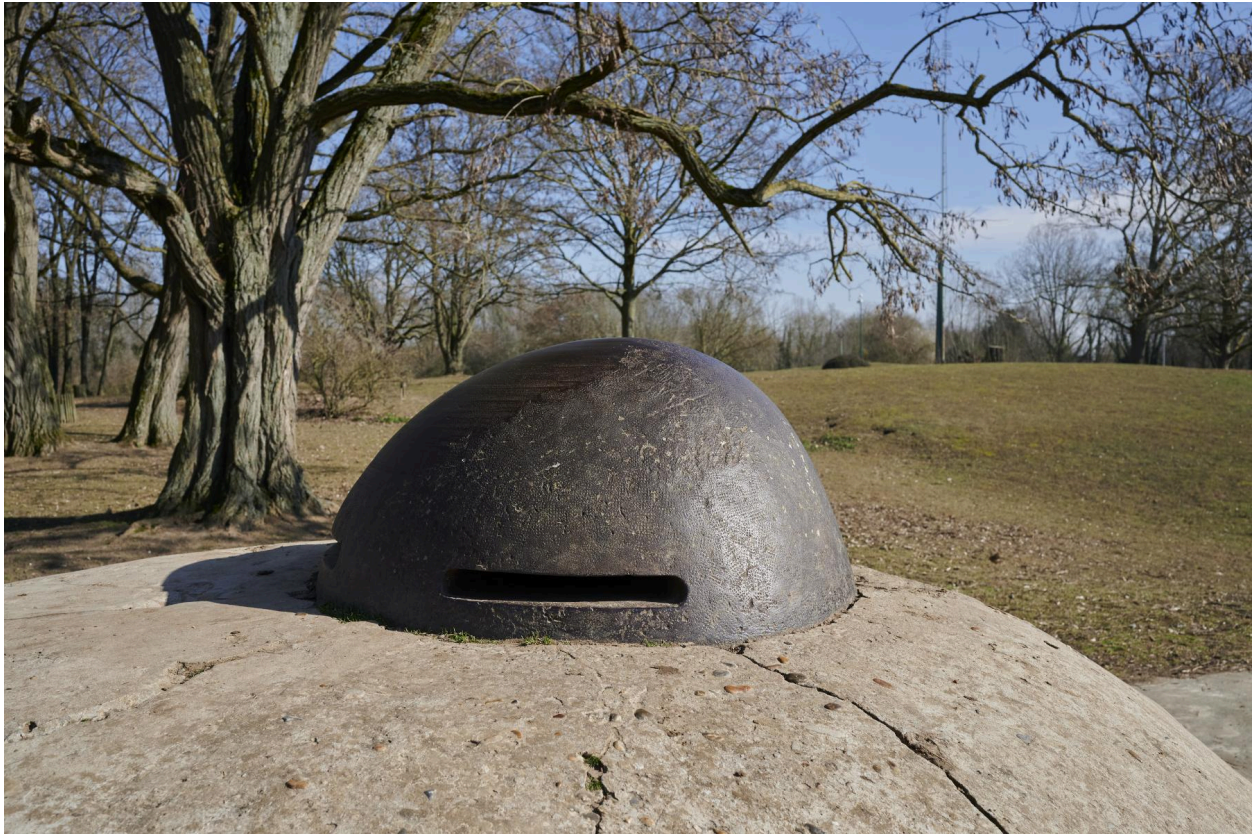
Abri casematé avec observatoire cuirassé. Détail de la coupole vers l'est.