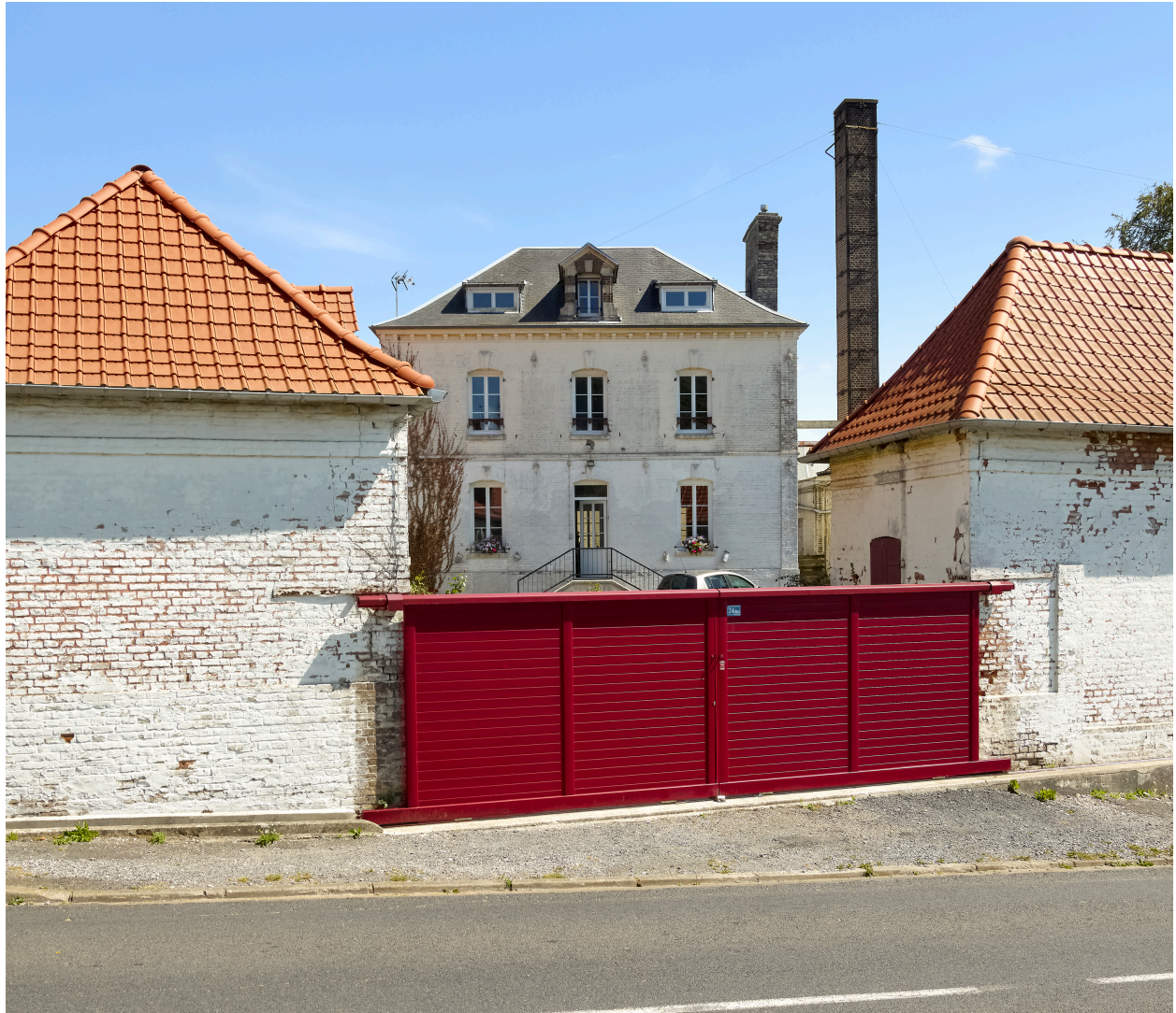
Vue de la maison de maître, depuis l'ouest.