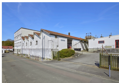
Vue des bâtiment d'usine de 1946 et 1947, depuis le sud.