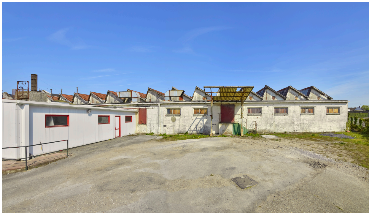
Vue du bâtiment d'usine de 1957, depuis le sud.