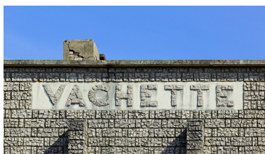
Nom de l'usine sur le bâtiment d'accueil. IVR32_20258001562NUCA