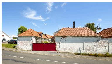
Vue des premiers ateliers, depuis l'ouest.