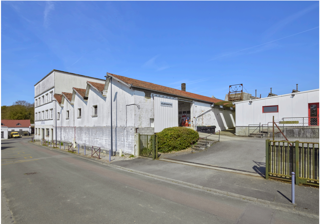
Vue des bâtiment d'usine de 1946 et 1947, depuis le sud.