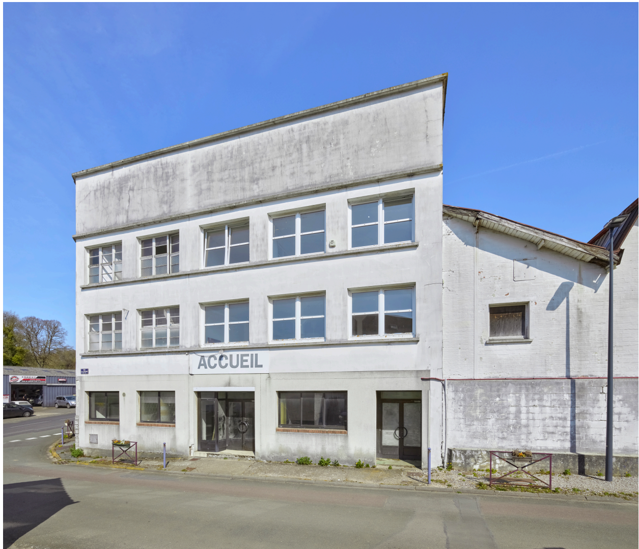
Vue du bâtiment d'accueil, depuis le sud.