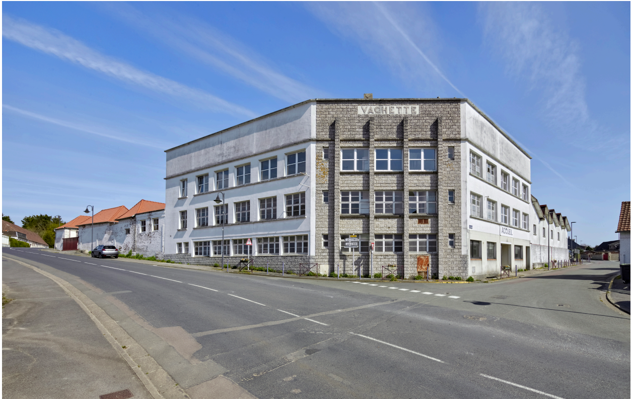
Vue générale des bureaux, depuis l'ouest.