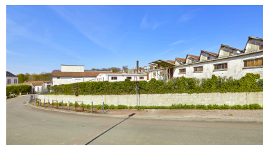
Vue d'ensemble de l'usine, depuis l'est. IVR32_20258001568NUCA