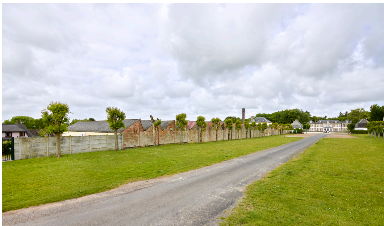
Vue d'ensemble de l'usine, depuis la place de la Mairie.