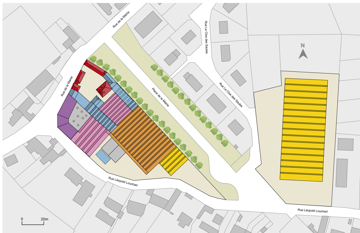
Plan de l'évolution de l'usine.