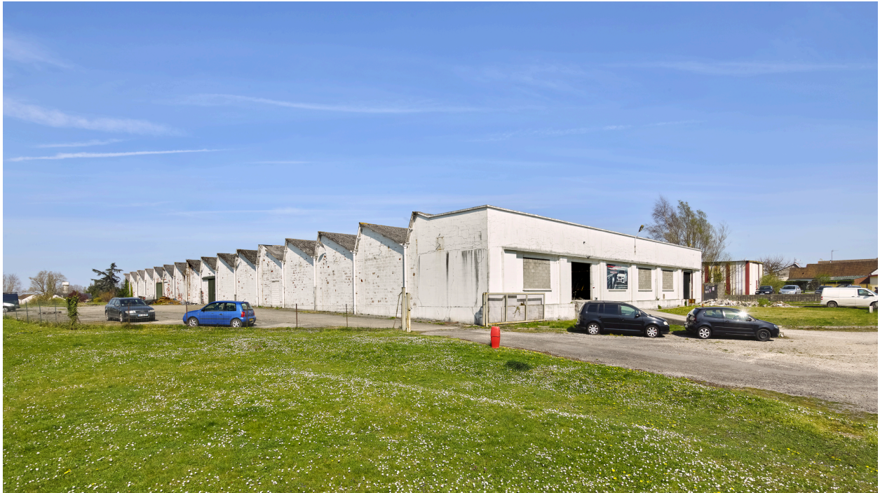
Vue du bâtiment d'usine des années 1960, depuis le sud.