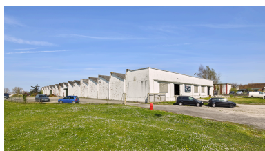
Vue du bâtiment d'usine des années 1960, depuis le sud. IVR32_20258001580NUCA