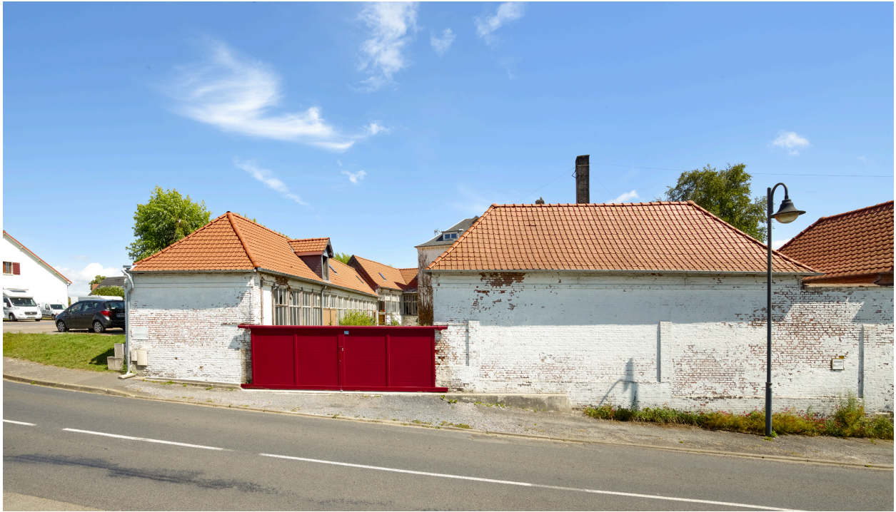
Vue des premiers ateliers, depuis l'ouest.