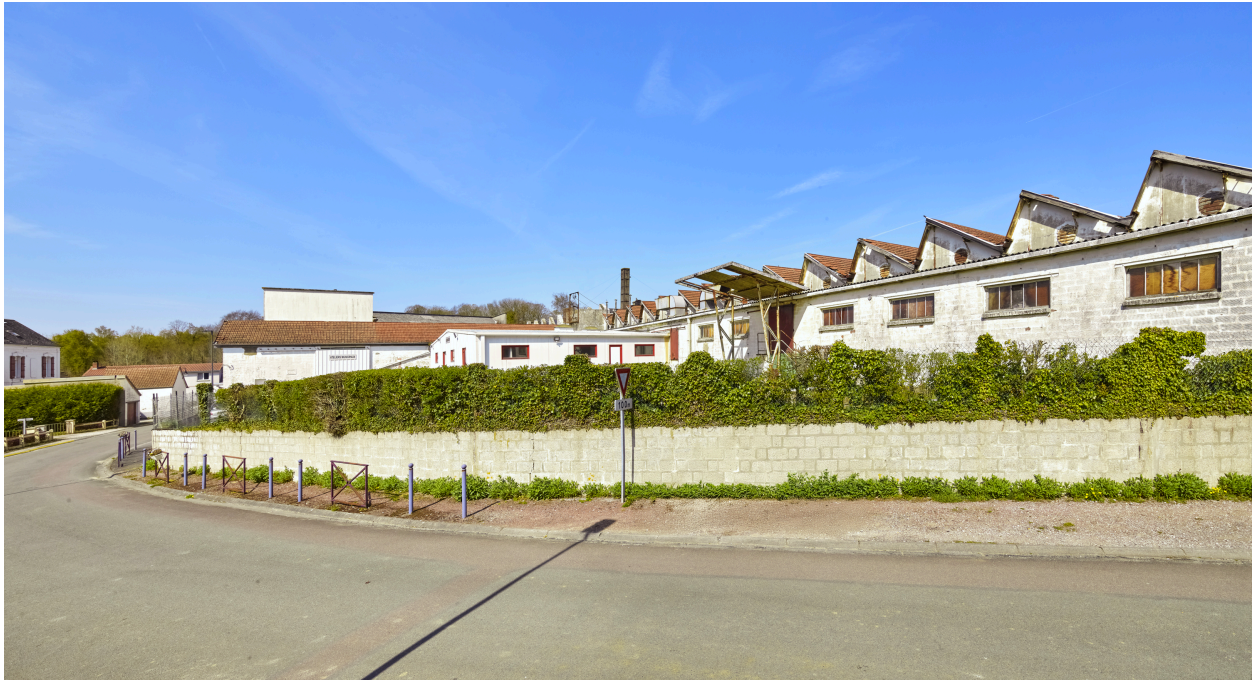
Vue d'ensemble de l'usine, depuis l'est.