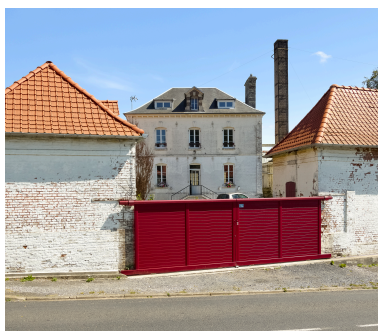
Vue de la maison de maître, depuis l'ouest.