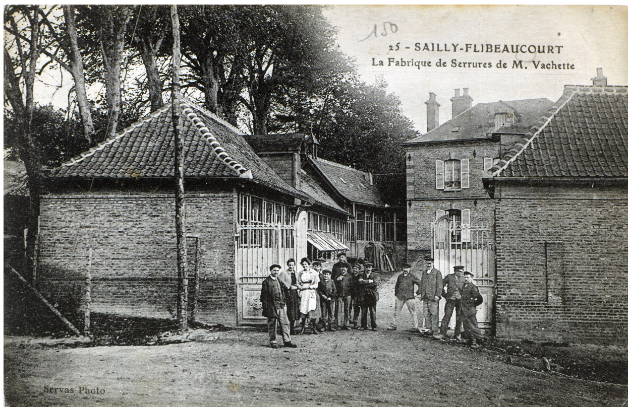
L'entrée de la fabrique de serrures de M. Vachette, carte postale, Servas photo (coll. part.).