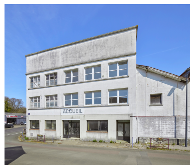
Vue du bâtiment d'accueil, depuis le sud. IVR32_20258001563NUCA