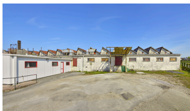
Vue du bâtiment d'usine de 1957, depuis le sud.