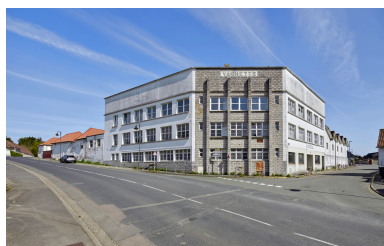
Vue générale des bureaux, depuis l'ouest.