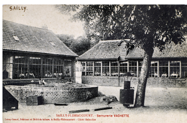
Cour de la serrurerie, carte postale, IVR32_20258002133NUCA