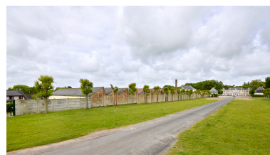
Vue d'ensemble de l'usine, depuis la place de la Mairie. IVR32_20258001575NUCA