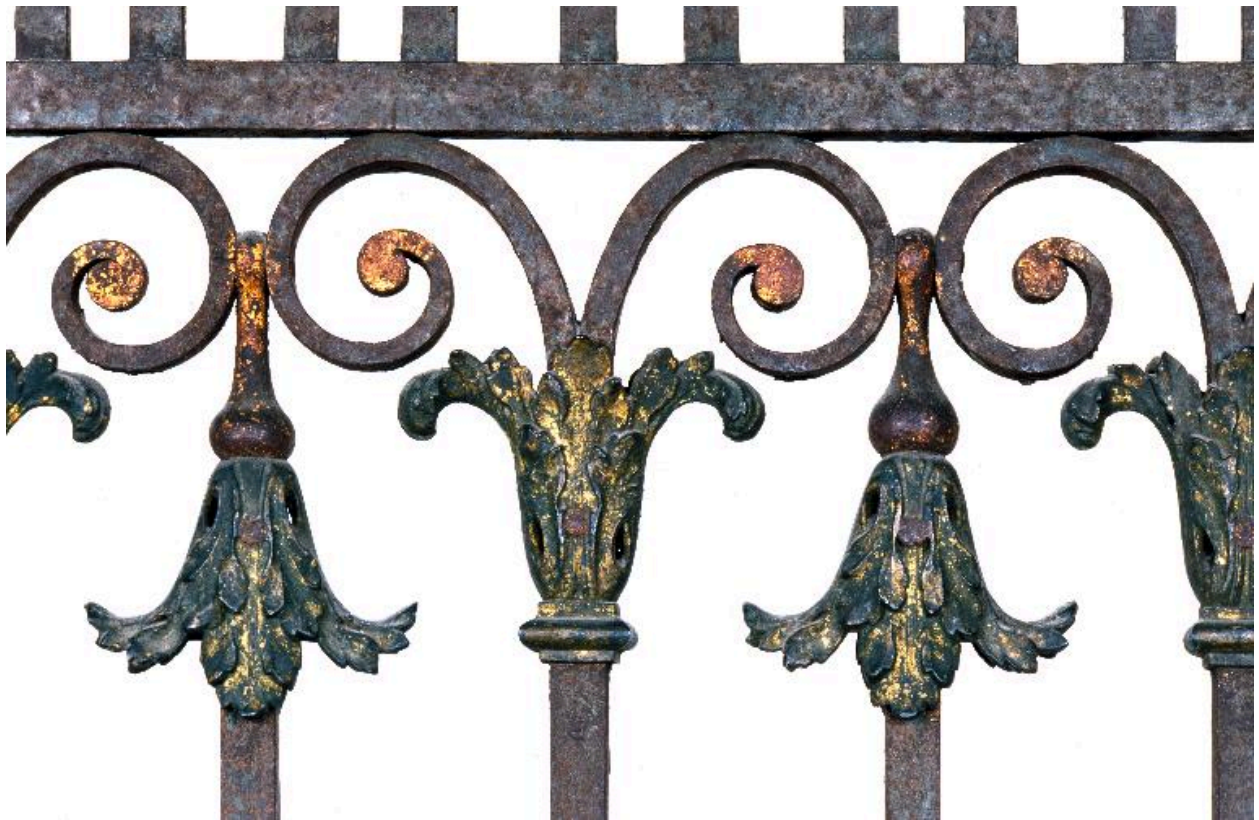
Détail de la grille.