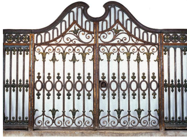
Vue de détail : la porte de la clôture.