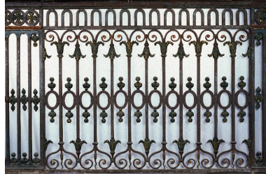
Vue de la grille de la chapelle Saint-Vincent.