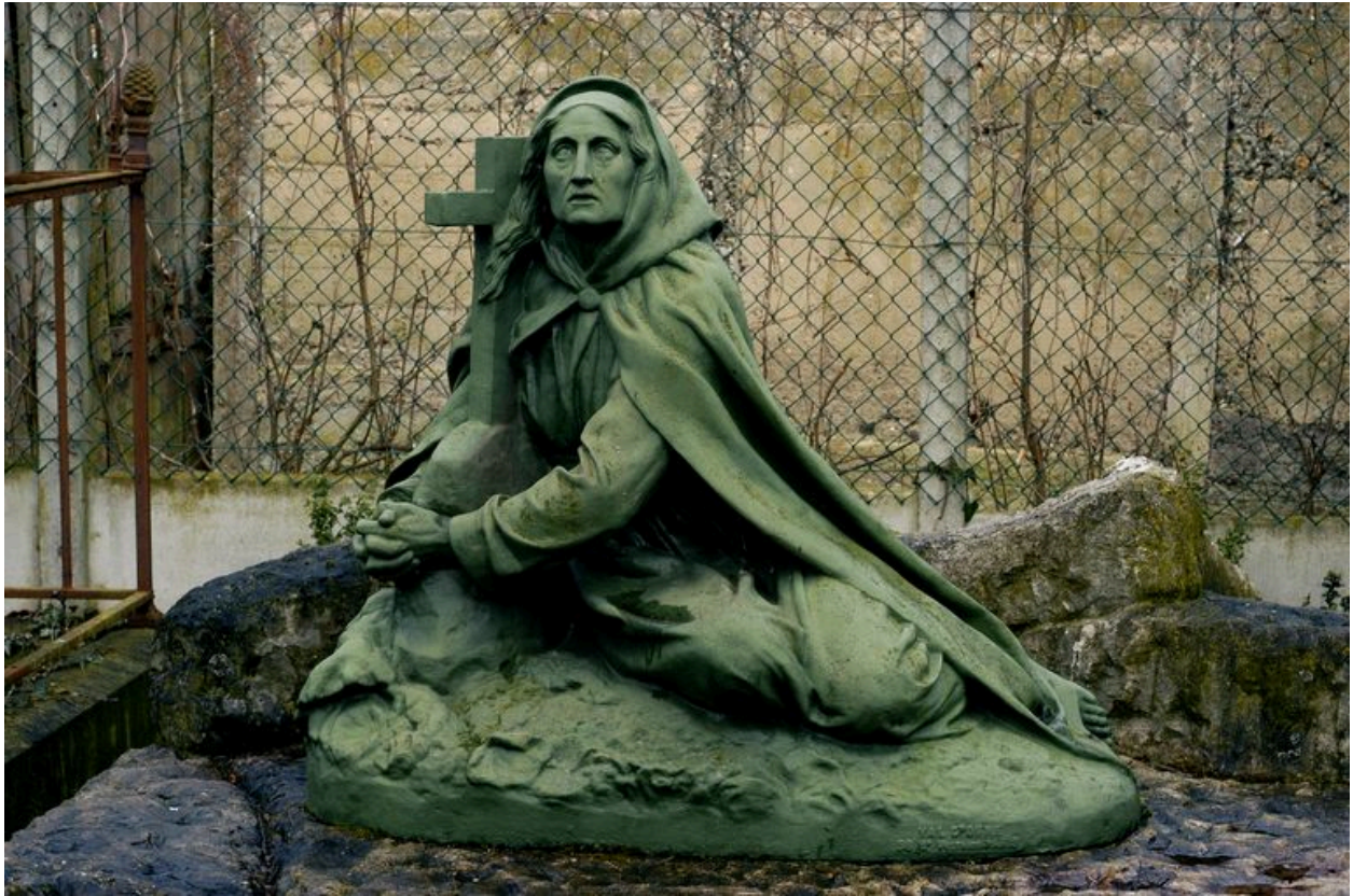
Vue de détail sur la statue en fonte.