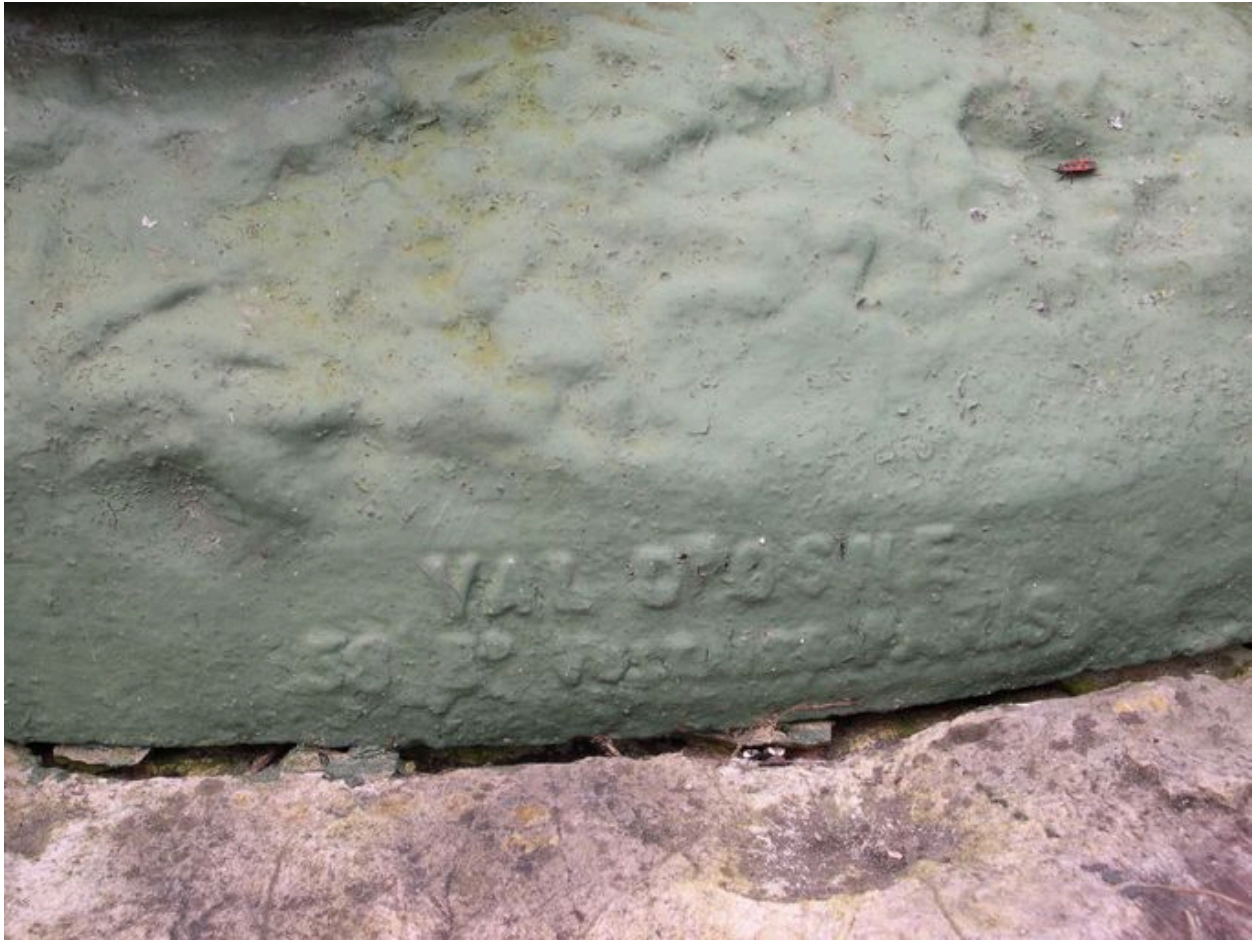
Vue de détail sur la marque de la fonderie.