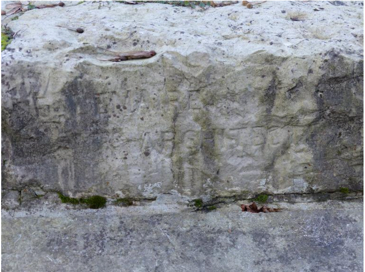
Détail sur la signature de l'architecte.