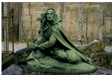
Vue de détail sur la statue en fonte.