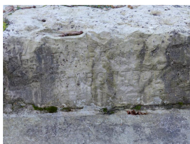
Détail sur la signature de l'architecte.