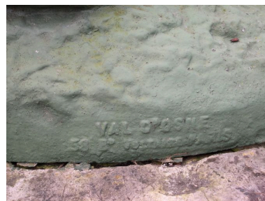
Vue de détail sur la marque de la fonderie. IVR22_20058010142NUCA