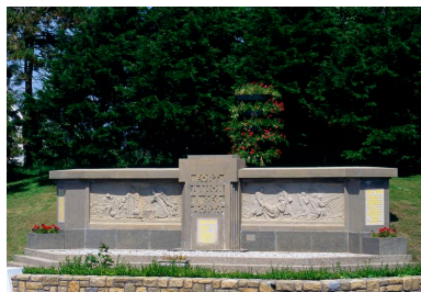
Vue générale. IVR22_19948000613ZA