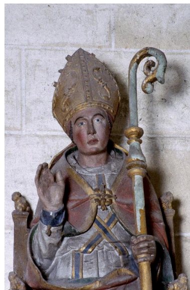
Vue de la partie supérieure de la statue. IVR22_19930200012ZA