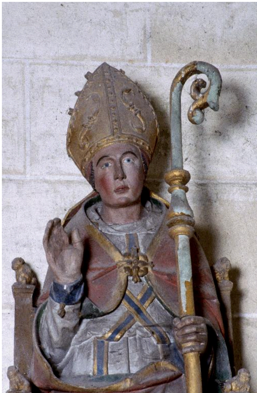
Vue de la partie supérieure de la statue.