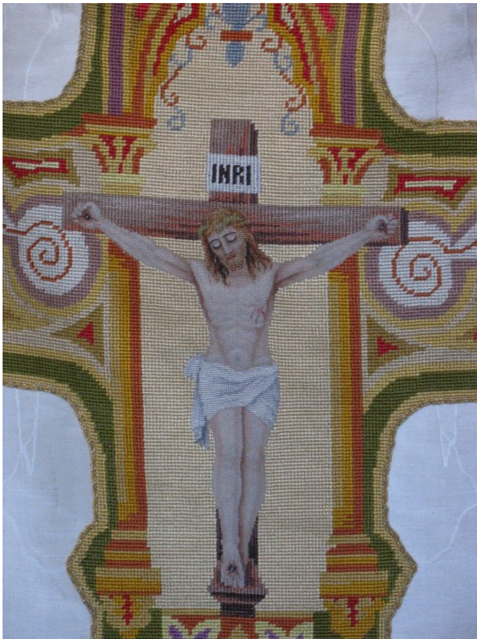
Chasuble : vue de détail, dos, Christ en croix