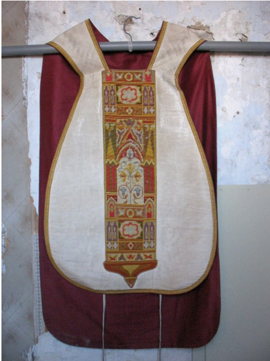
Chasuble : vue générale, devant