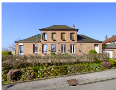
Vue de l'ancienne école, depuis l'est.