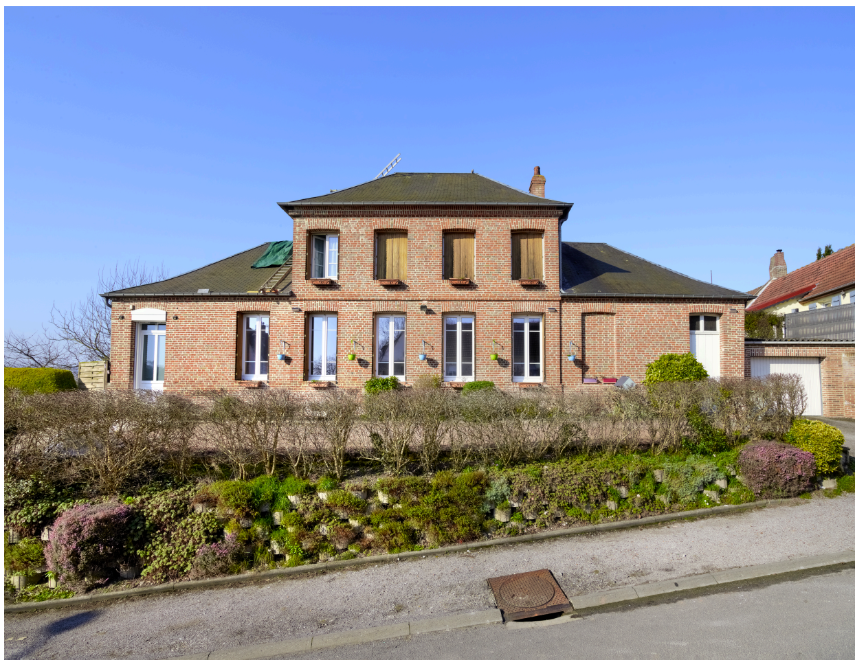
Vue de l'ancienne école, depuis l'est.