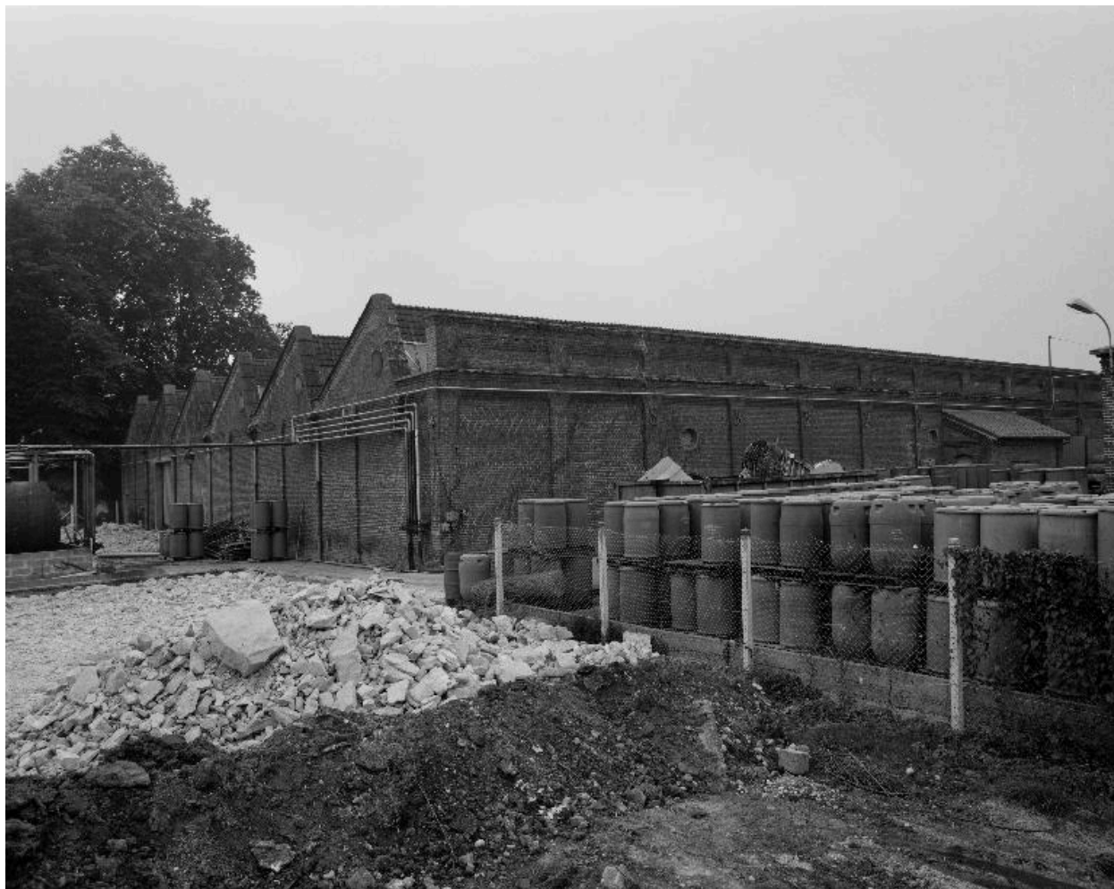
Atelier de fabrication sud, flanc nord-est.