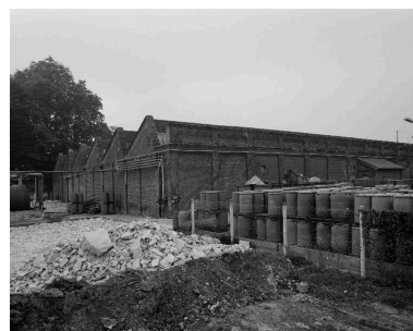
Atelier de fabrication sud, flanc nord-est.