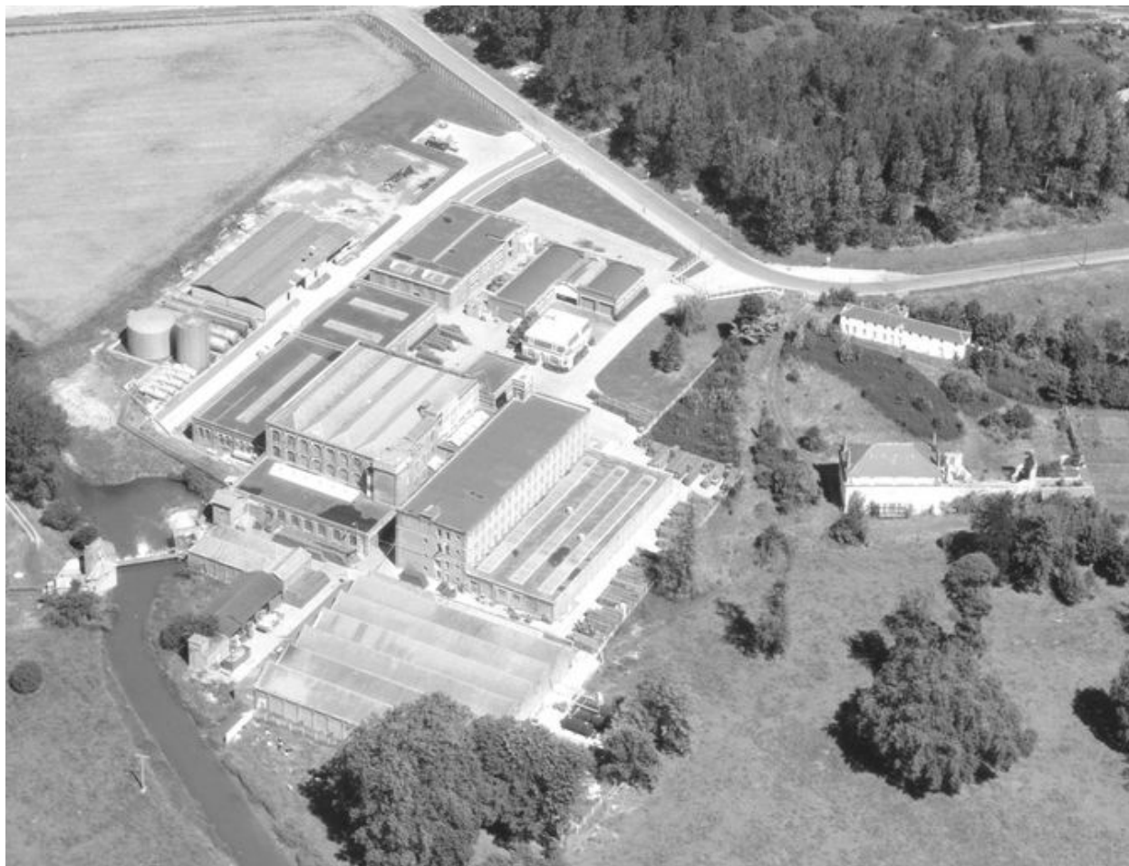
Vue aérienne, vue du flanc sud-est.