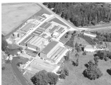
Vue aérienne, vue du flanc sud-est.