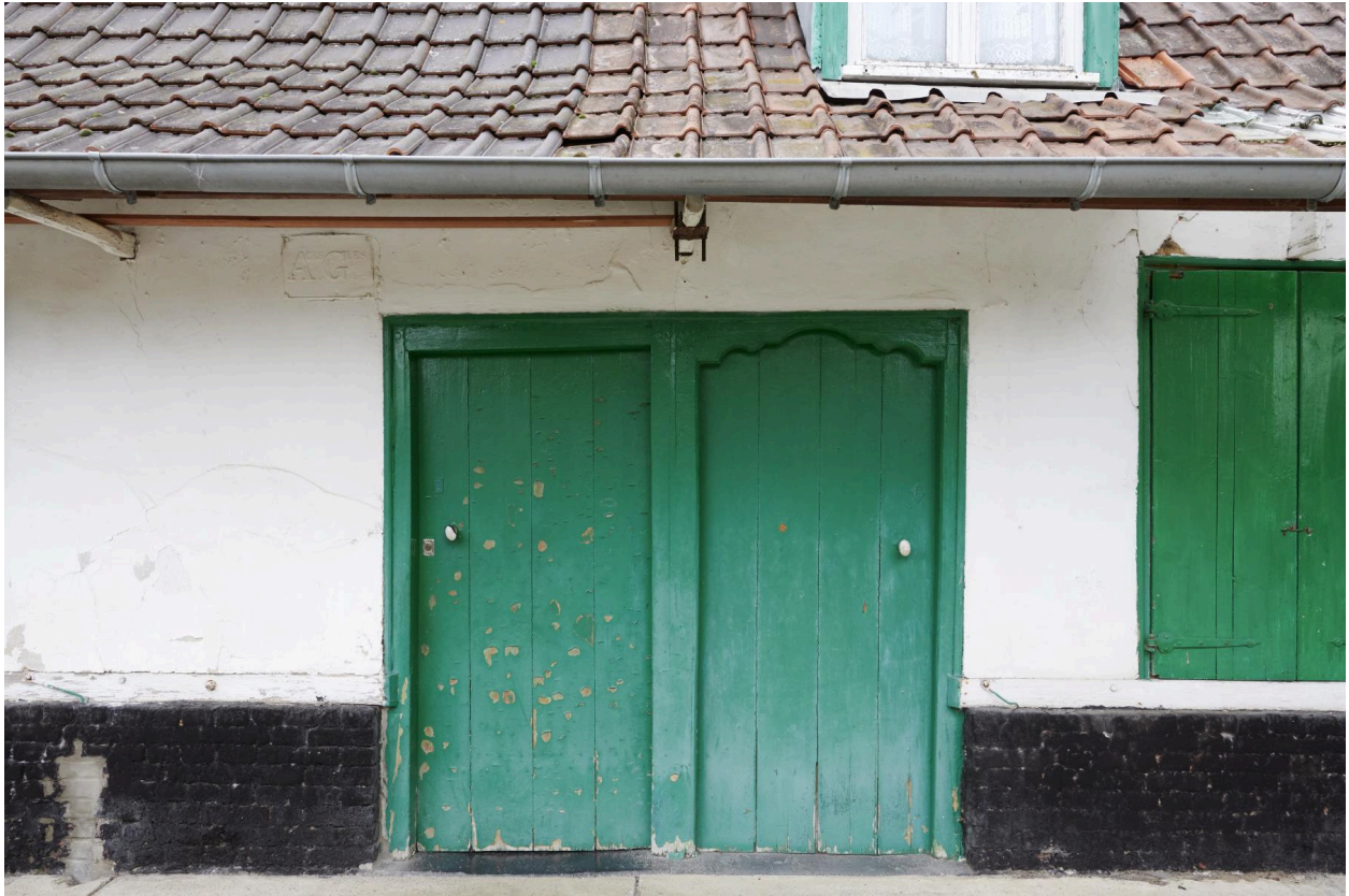
Détail de la façade sud.