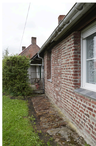
Détail du trottoir en brique situé le long du mur nord.