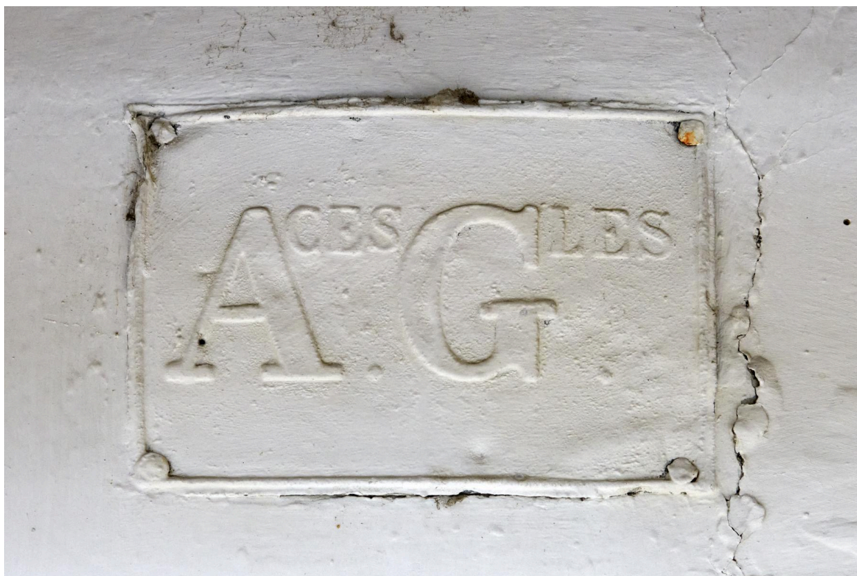
Plaque métallique sur le mur sud.