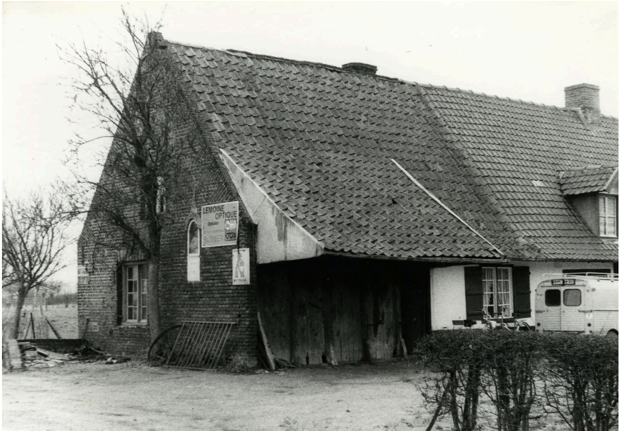
Ancien atelier, vue sur cour. 1979.