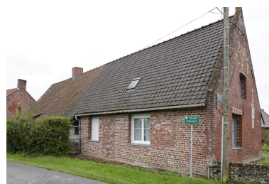
Détail de la façade nord, sur rue.