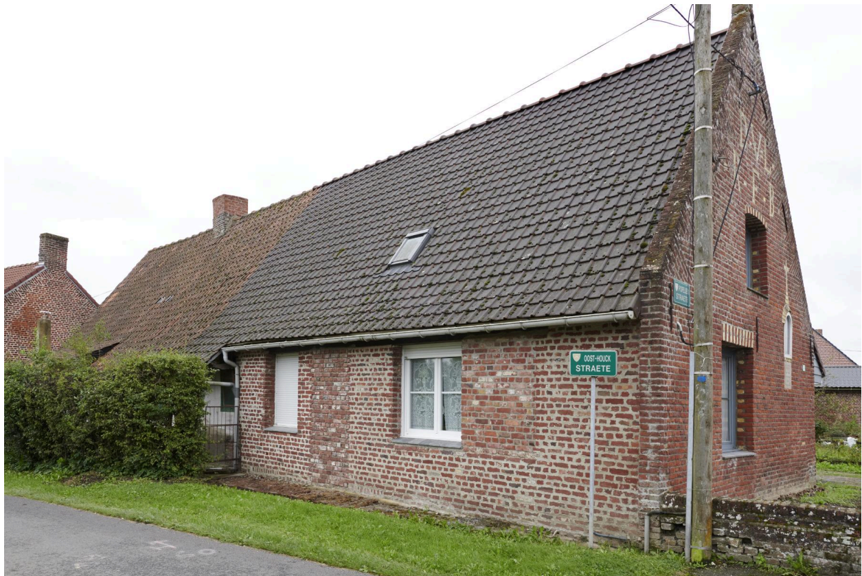
Détail de la façade nord, sur rue.