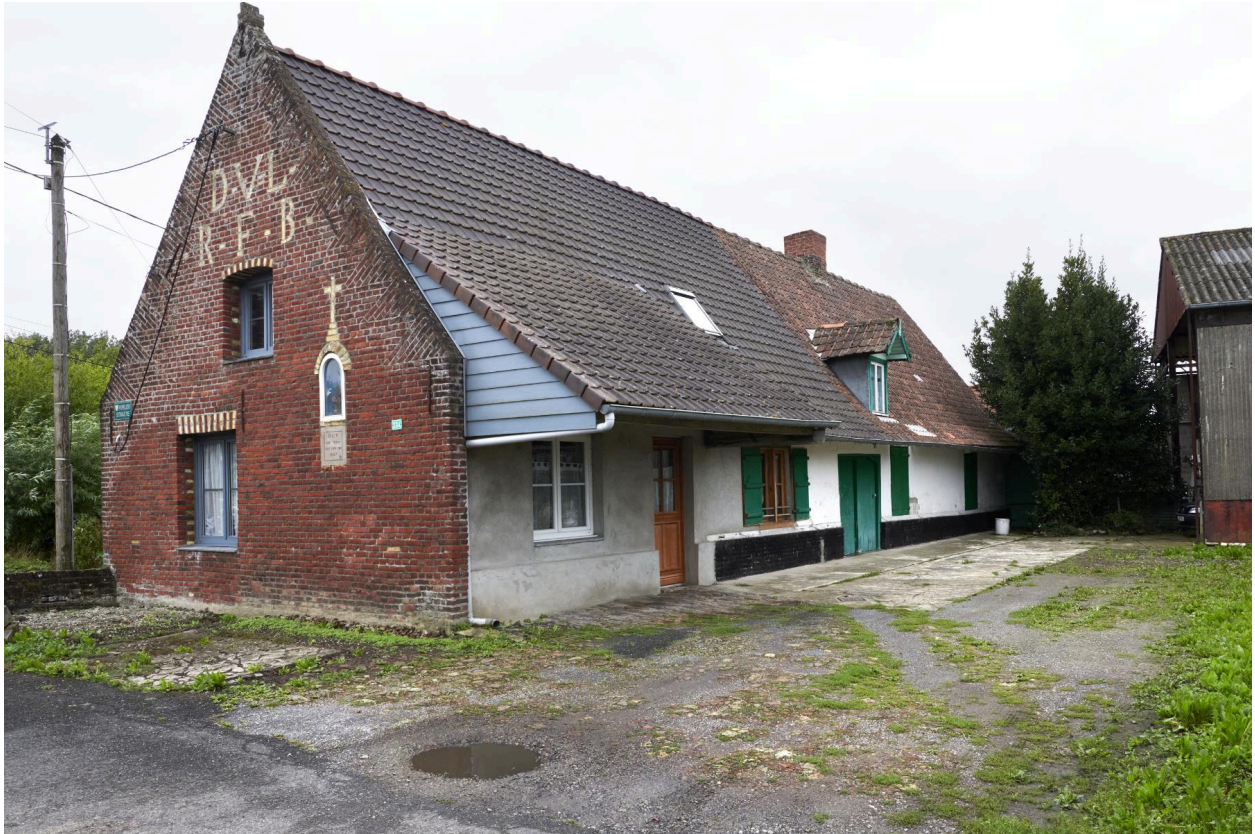
Vue sur cour et pignon ouest.