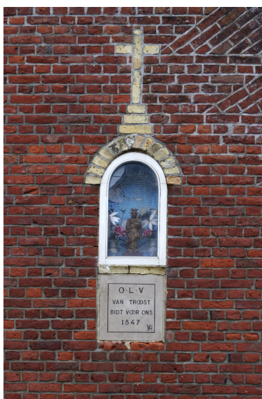
Détail de la niche votive du pignon ouest.