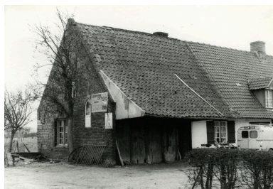
Ancien atelier, vue sur cour. 1979.