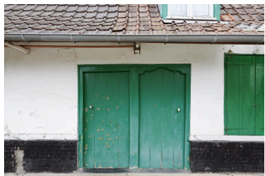
Détail de la façade sud.