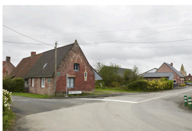
Façade nord et pignon ouest, depuis le carrefour.