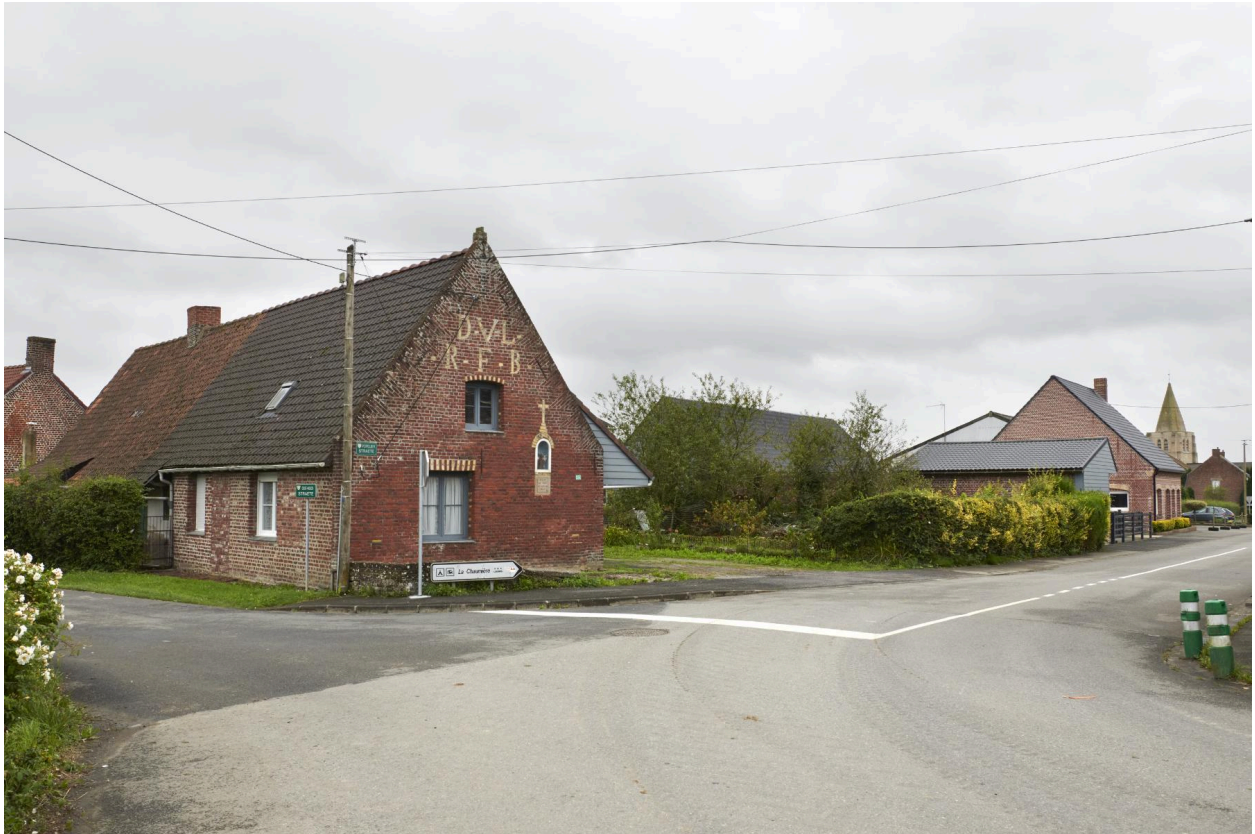
Façade nord et pignon ouest, depuis le carrefour.