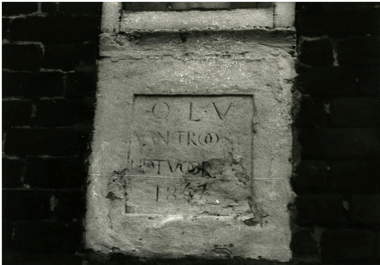
Détail de la plaque gravée sur le pignon. 1979 (coll. Comité Flamand de France).