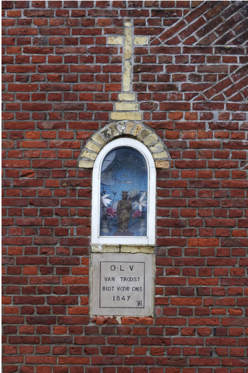
Détail de la niche votive du pignon ouest.