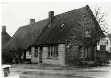
Ancien atelier, vue sur rue. 1979.