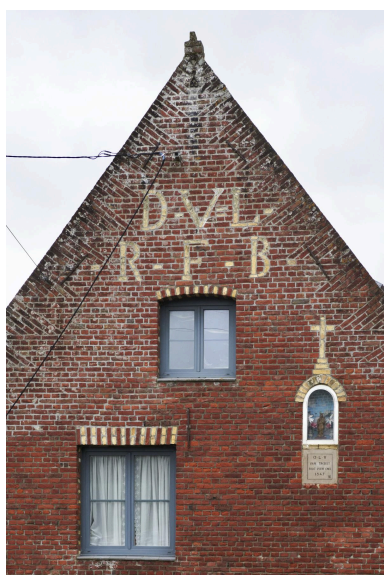
Détail du pignon ouest, inscriptions. IVR32_20245902957NUCA