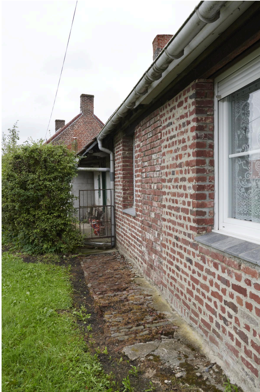
Détail du trottoir en brique situé le long du mur nord.