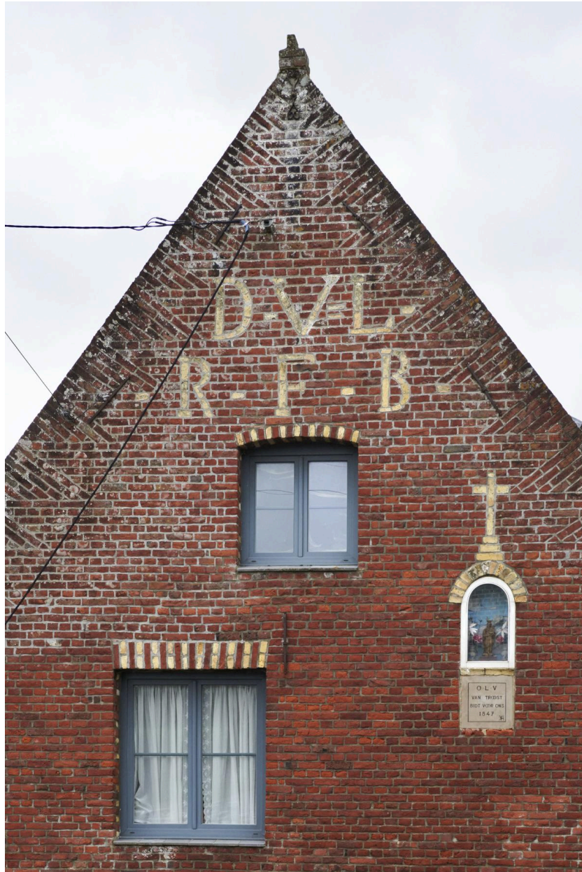
Détail du pignon ouest, inscriptions.