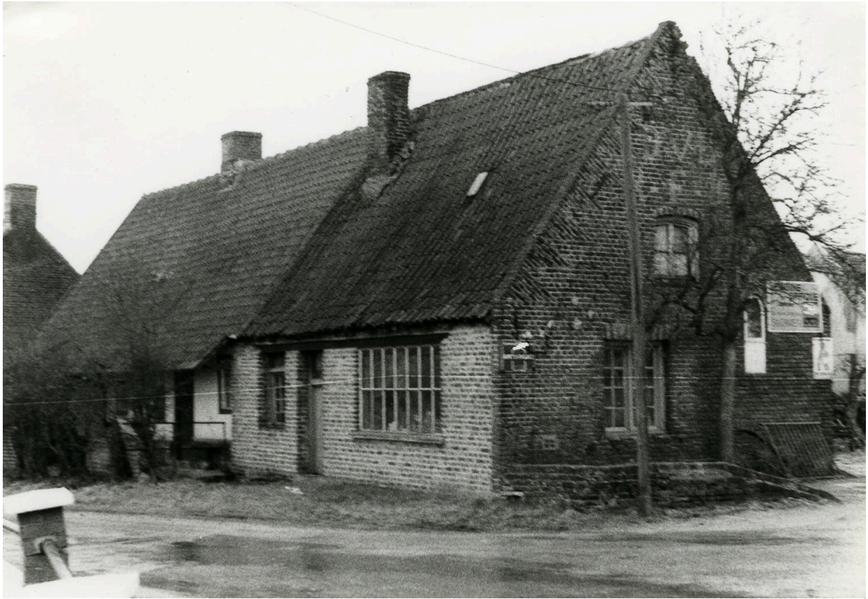
Ancien atelier, vue sur rue. 1979.