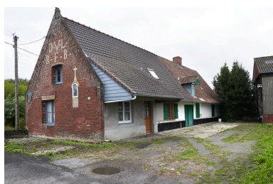
Vue sur cour et pignon ouest. IVR32_20245902968NUCA