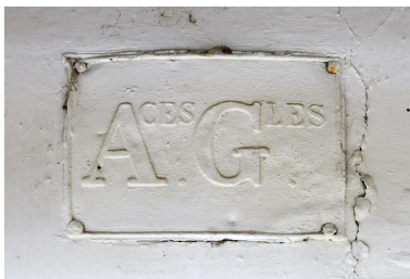
Plaque métallique sur le mur sud. IVR32_20245902962NUCA