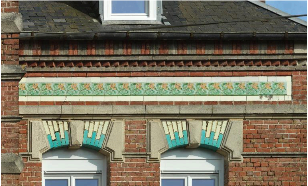
Détail de la frise à motifs floraux en carreaux vernissés au sommet de la façade sur cour.