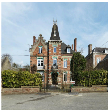
Vue d'ensemble. IVR22_20138000087NUC2A