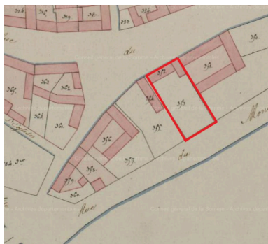
Détail du plan cadastral de la commune de Beauval, dit plan napoléonien. Sections I1 et A2. 1811 (AD Somme ; 3 P 1177) IVR22_20148005084NUCA