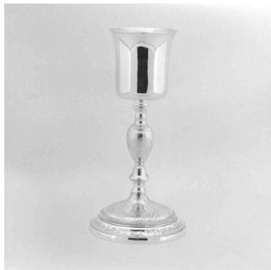
Vue générale. IVR31_19916200514X