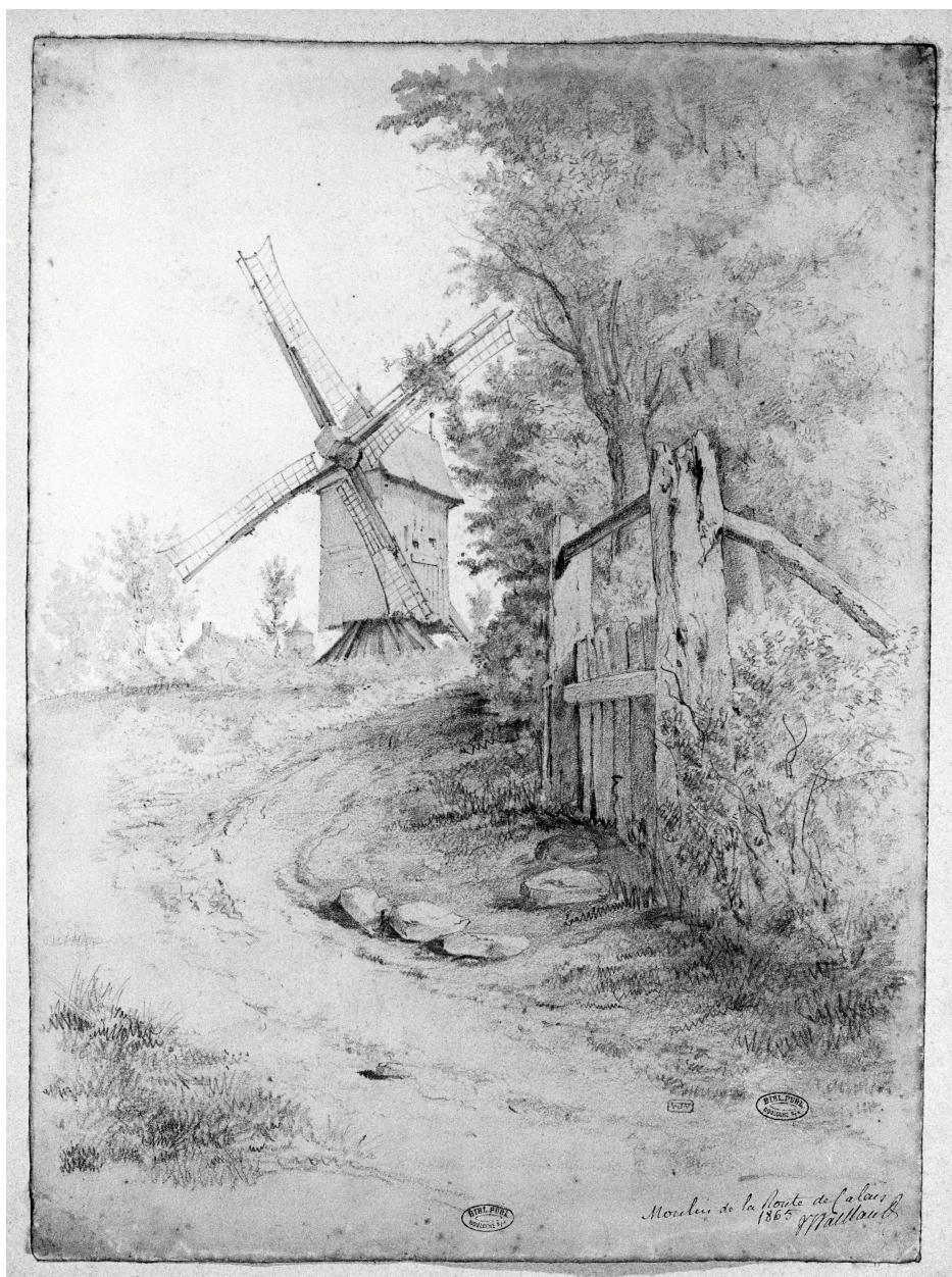
Un élément, état en 1865, dessin V.J. Vaillant. B.M. Boulogne-sur-Mer, albums Vaillant.