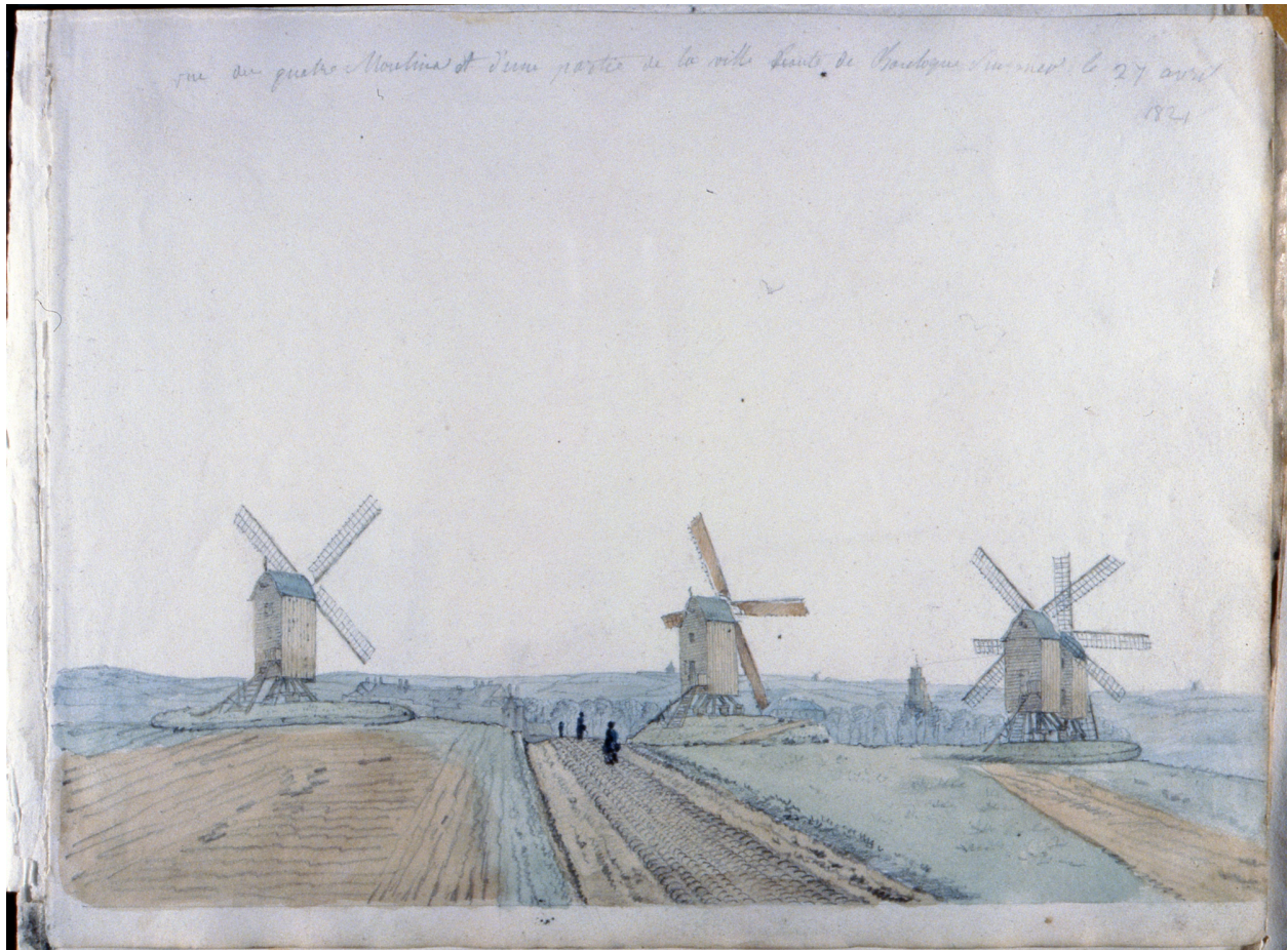
Vue de l'ensemble, 1821, dessin Meuniez. Archives privées.