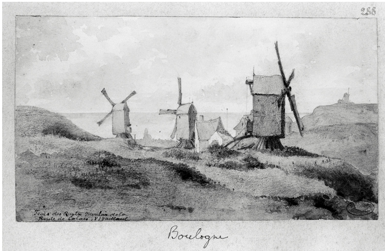
Trois éléments, dessin V.J. Vaillant, album 875, n° 288. B.M. Boulogne-sur-Mer, albums Vaillant.