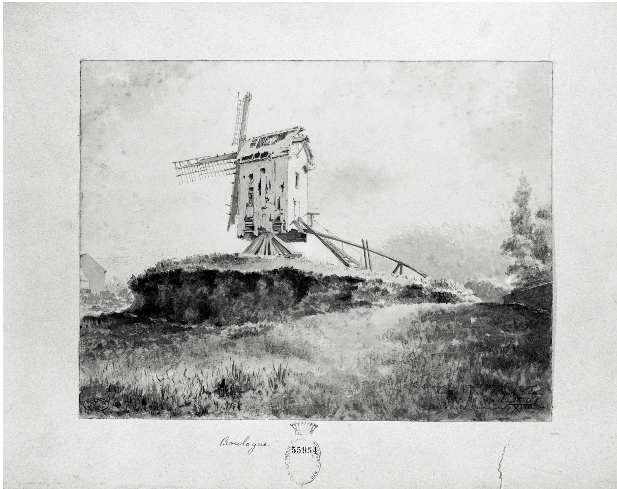
Un élément, dessin V.J. Vaillant. B.M. Boulogne-sur-Mer, albums Vaillant.