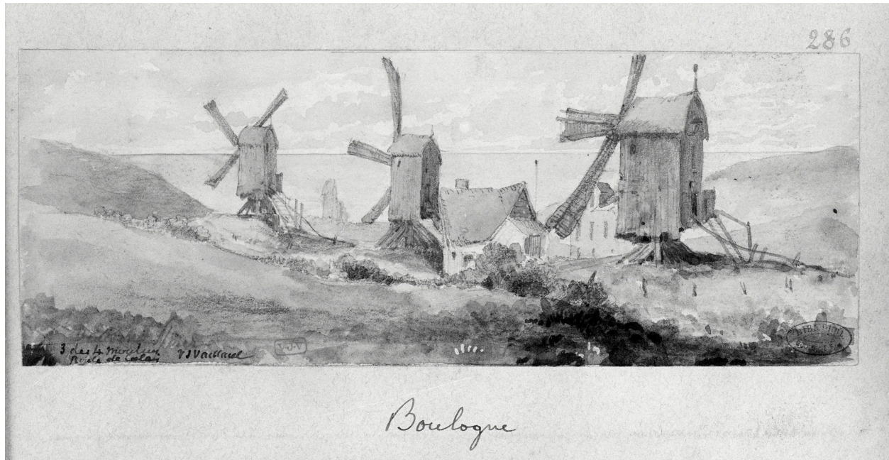
Trois éléments, dessin V.J. Vaillant, album 875, n° 286. B.M. Boulogne-sur-Mer, albums Vaillant.