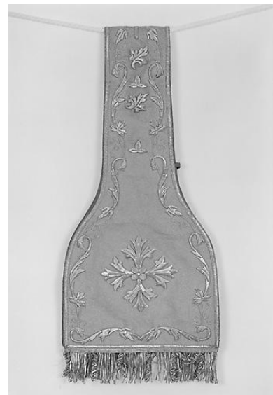
Manipule n° 3 : vue de la moitié d'un élément. IVR31_19876201878X