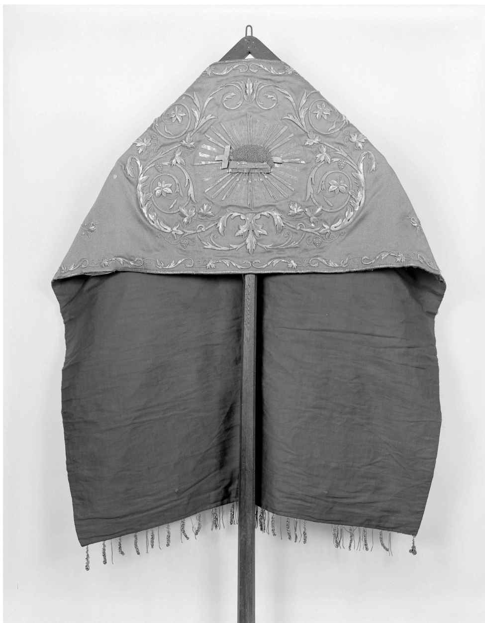
Voile huméral, vue de dos.