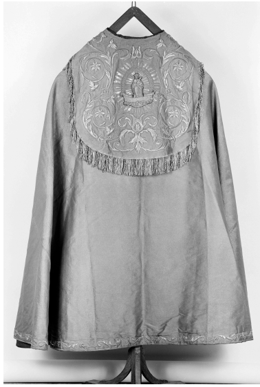
Chape n° 3 : vue de dos d'un élément.