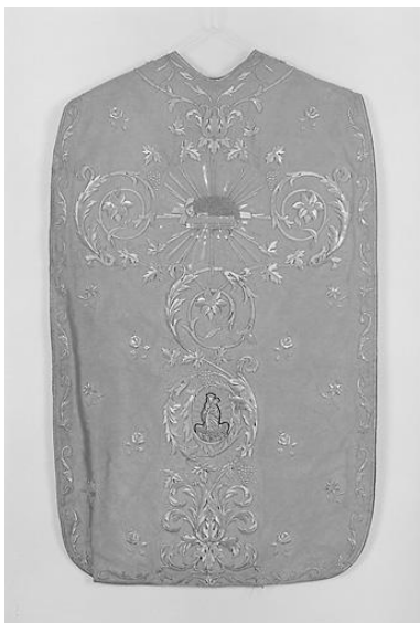
Chasuble, dit violon : vue de dos. IVR31_19876201879X