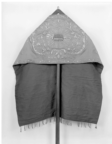
Voile huméral, vue de dos. IVR31_19876202037V