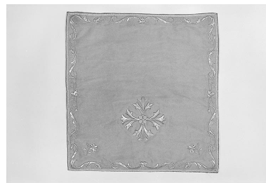
Voile du calice.