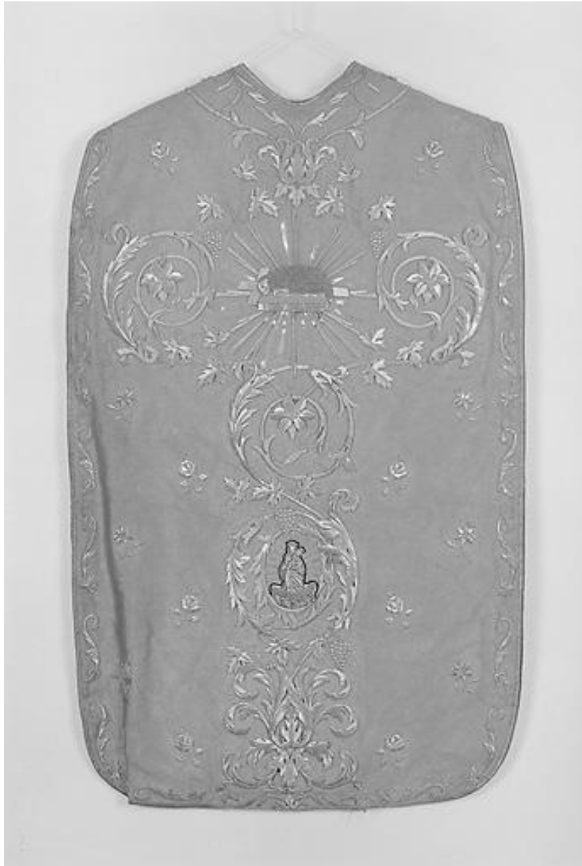
Chasuble, dit violon : vue de dos.