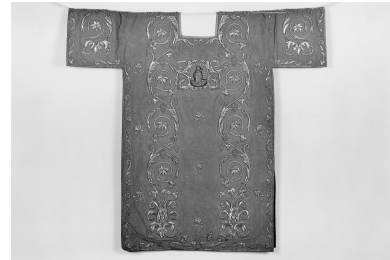
Dalmatique n° 4 : vue de dos d'un élément. IVR31_19876201880X