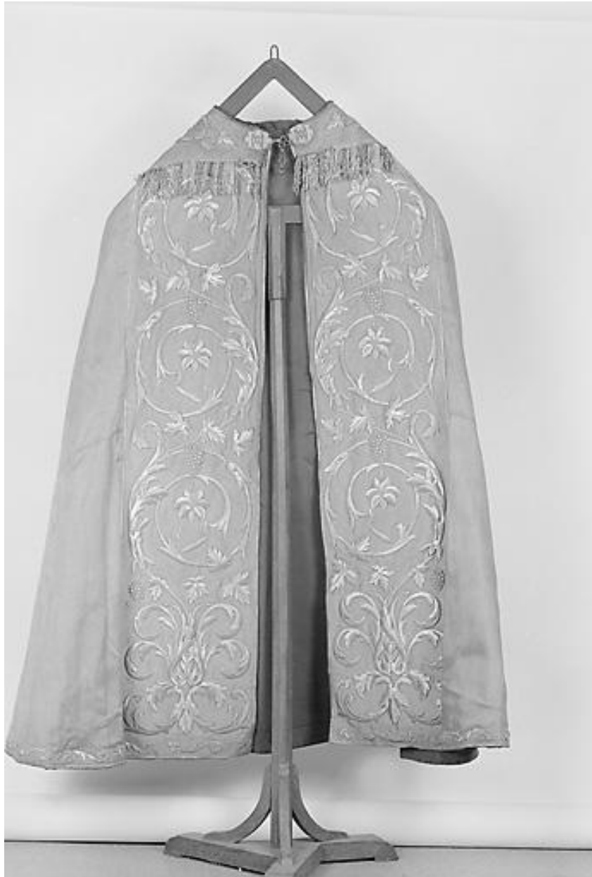
Chape n° 3 : vue de devant d'un élément.