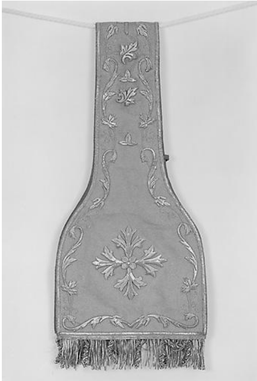
Manipule n° 3 : vue de la moitié d'un élément.