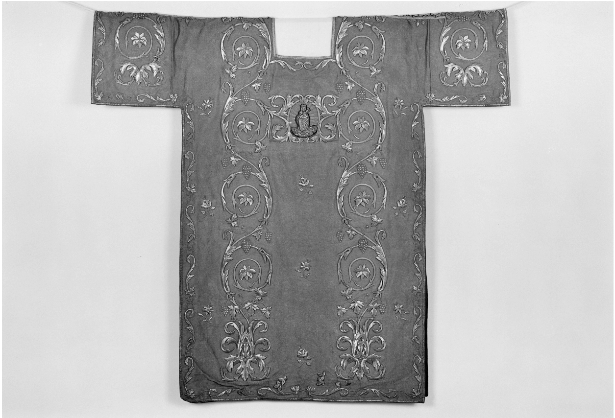
Dalmatique n° 4 : vue de dos d'un élément.