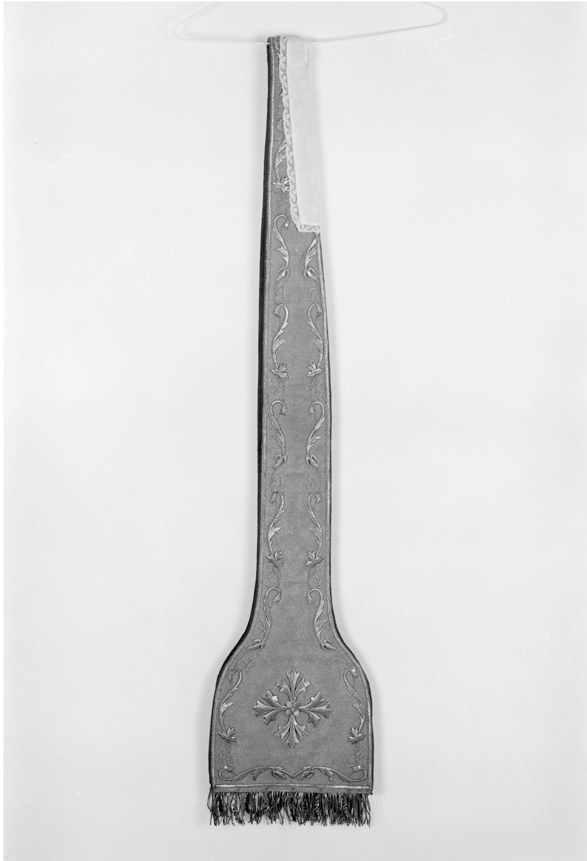
Etole n° 3 : vue générale d'une moitié d'un élément.