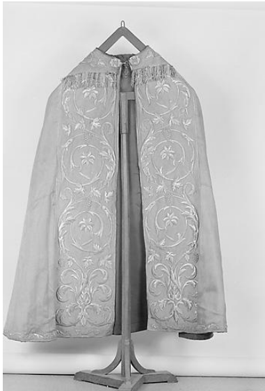
Chape n° 3 : vue de devant d'un élément. IVR31_19876202184X