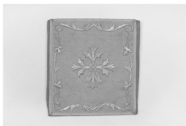
Bourse. IVR31_19876201870X