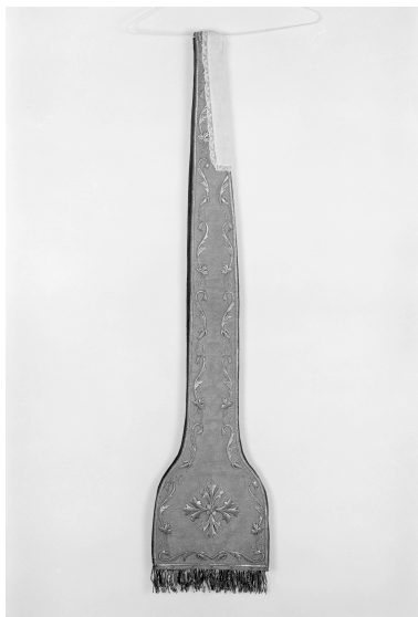
Etole n° 3 : vue générale d'une moitié d'un élément.