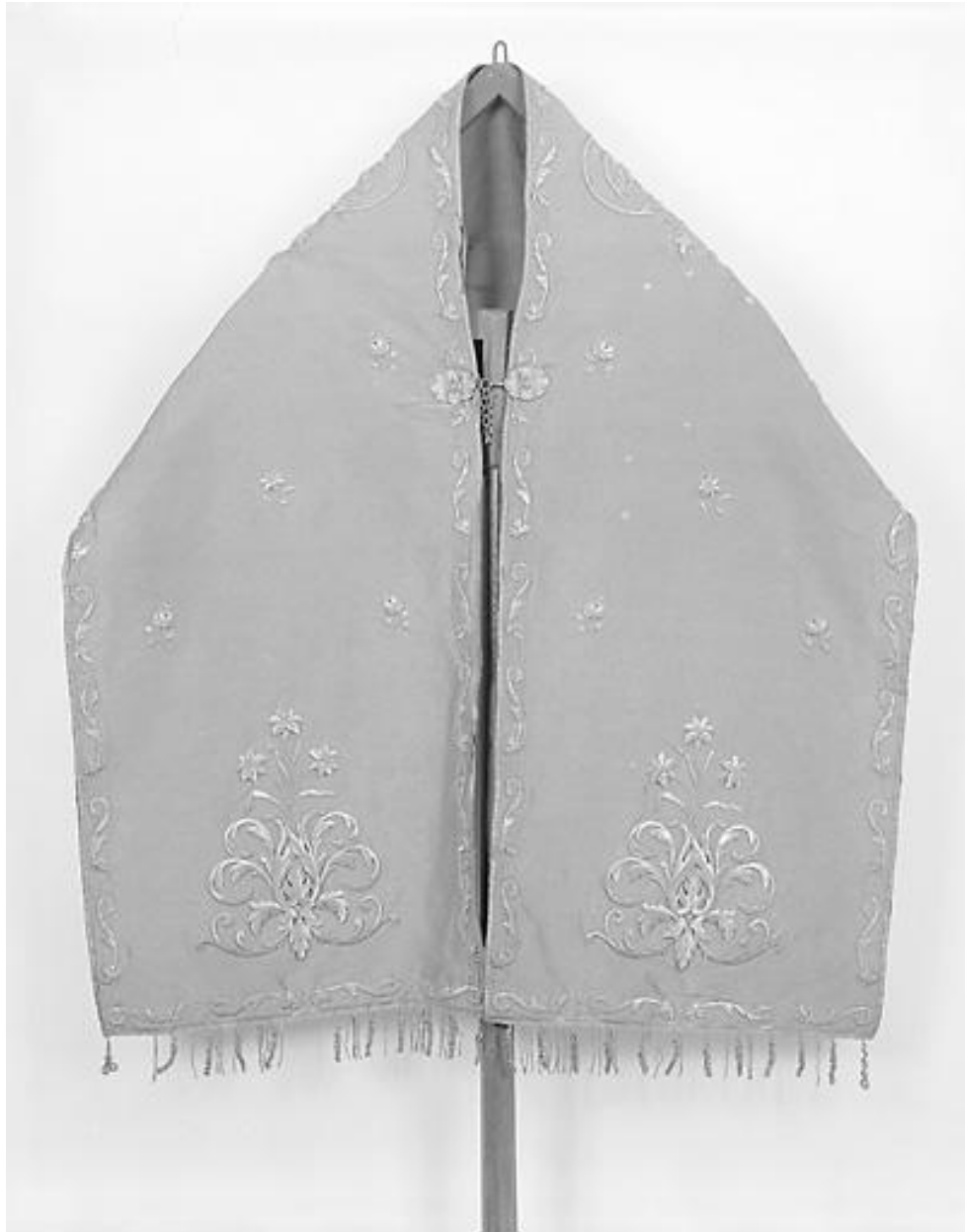
Voile huméral, vue de devant.