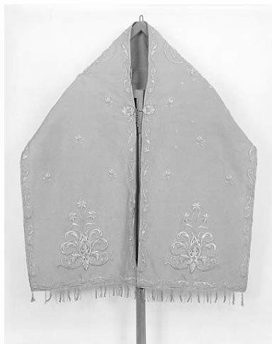
Voile huméral, vue de devant. IVR31_19876202038V