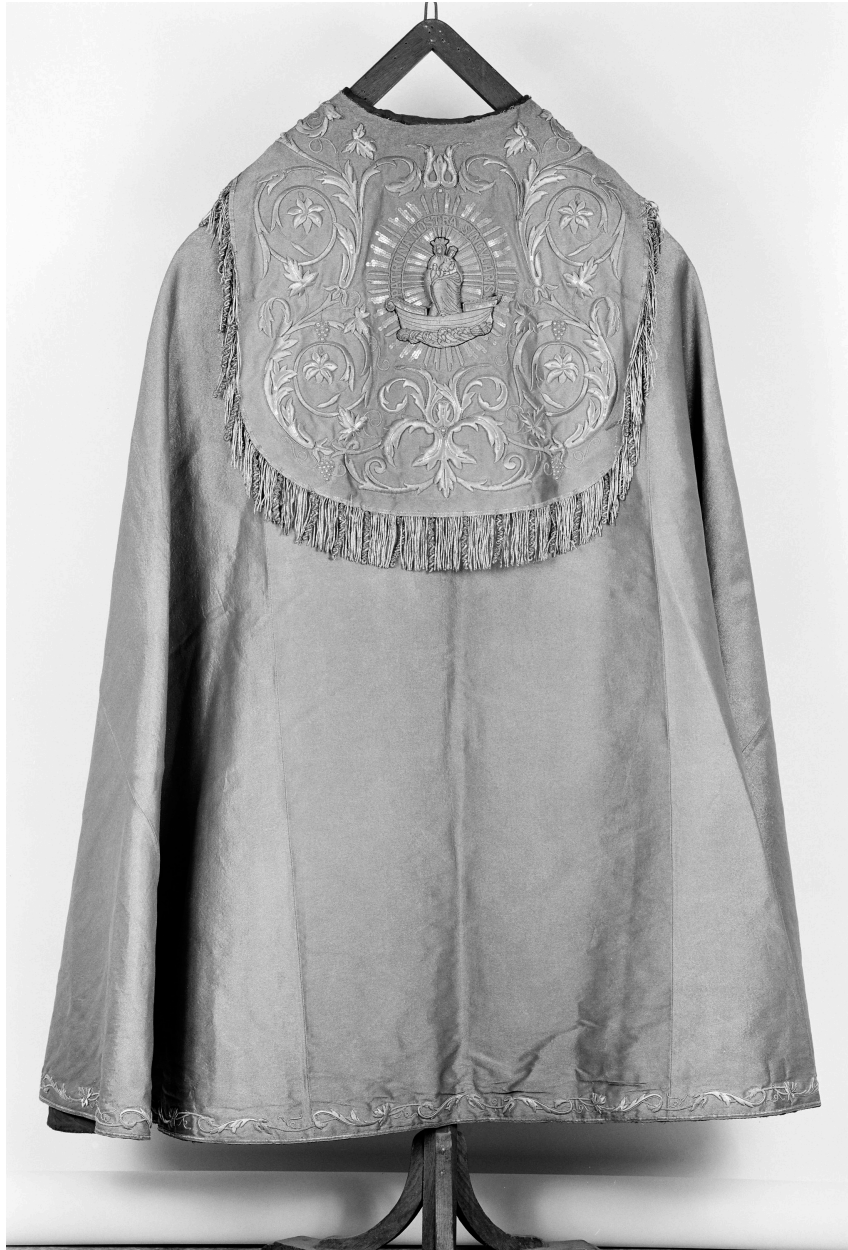
Chape n° 3 : vue de dos d'un élément.