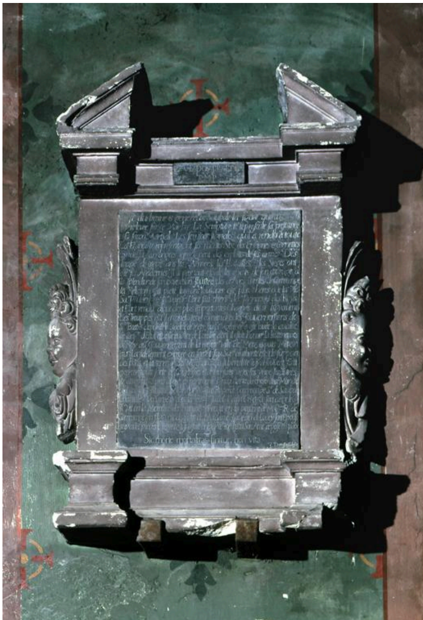
Vue de l'épitaphe.