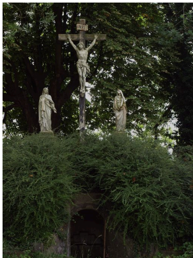
Le calvaire et l'entrée de l'oratoire.