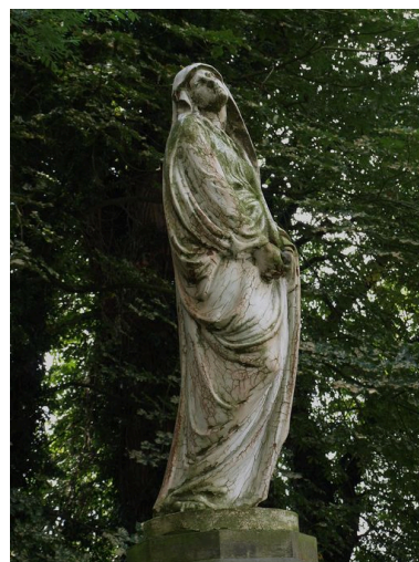
Statue représentant la Vierge.