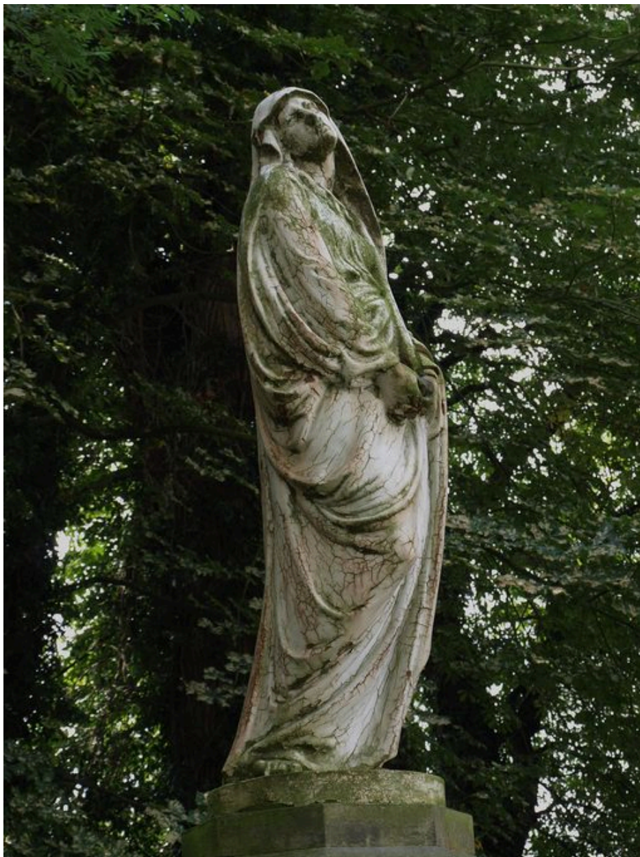
Statue représentant la Vierge.