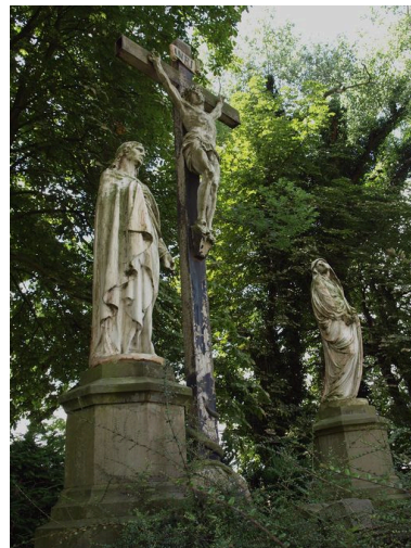
Vue du calvaire.