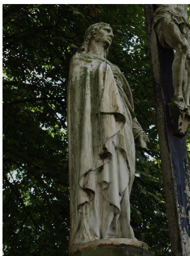
Statue représentant saint Jean.