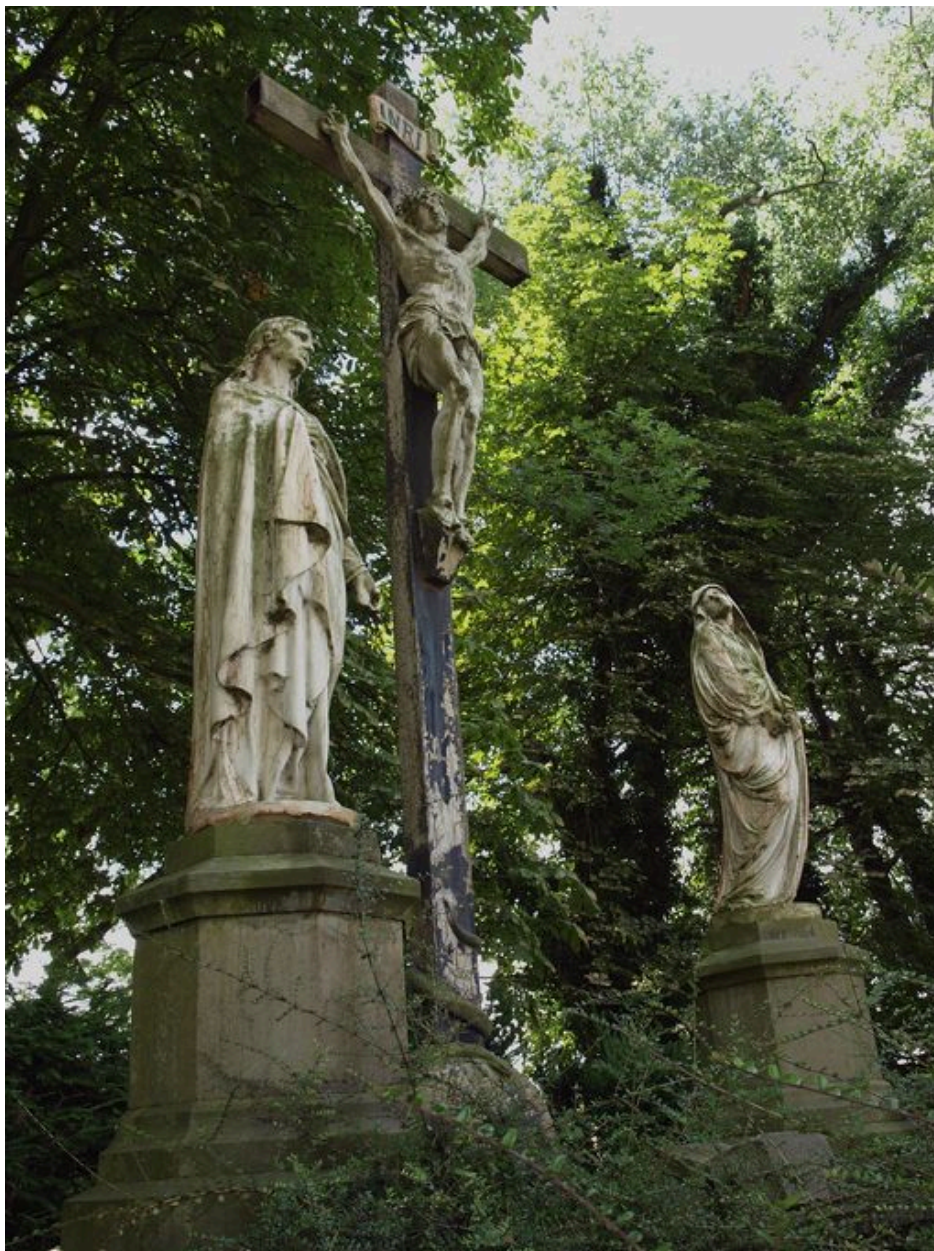
Vue du calvaire.