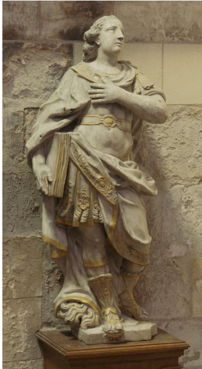
Saint Quentin : vue générale, de trois-quarts gauche.