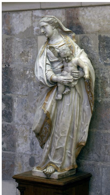
Vierge à l'Enfant : vue générale de trois-quarts droit. IVR22_20010202047XA