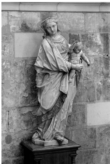
Vierge à l'Enfant : vue générale, de trois-quarts gauche. IVR22_20010201994X