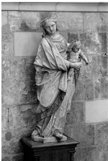
Vierge à l'Enfant : vue générale, de trois-quarts gauche.