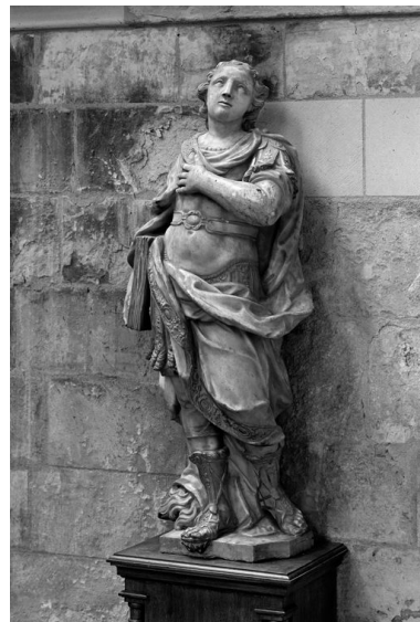
Saint Quentin : vue générale, de trois-quarts droit.