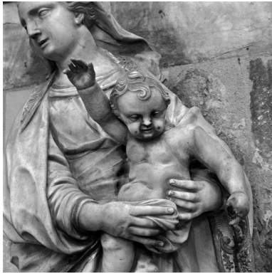
Vierge à l'Enfant : détail de l'Enfant.