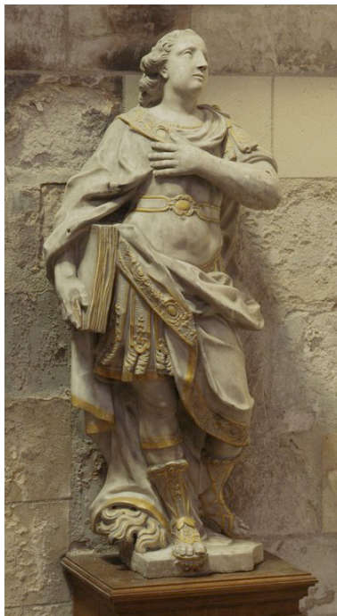
Saint Quentin : vue générale, de trois-quarts gauche. IVR22_20010202046XA