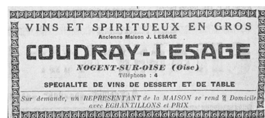
Publicité pour les entrepôts Coudray-Lesage, 1923 (AD Oise ; 2OP9382). IVR22_20076005567NUCAB