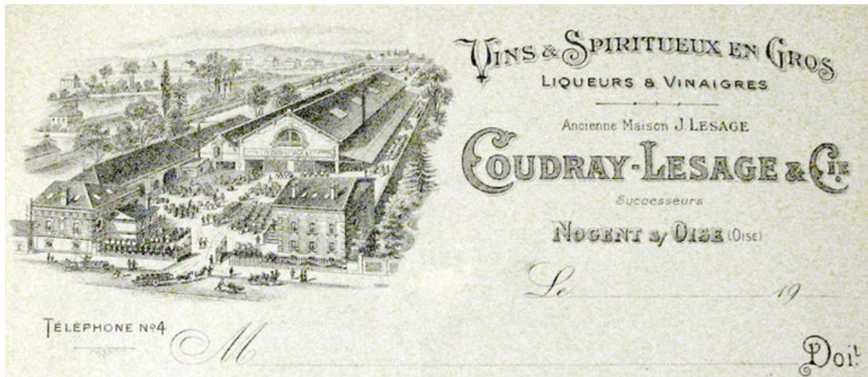
Papier à lettre à en-tête des entrepôts Coudray-Lesage, vers 1920 (AC Nogent).