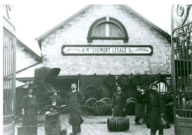
La halle aux vins au début du 20e siècle (AP).