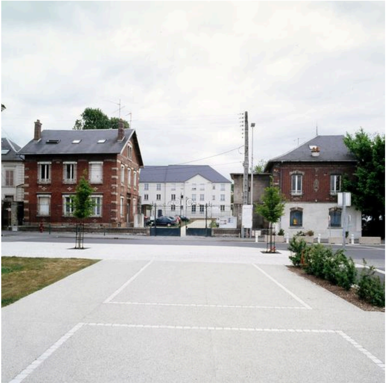
Vue générale des anciens entrepôts Coudray et Lesage.