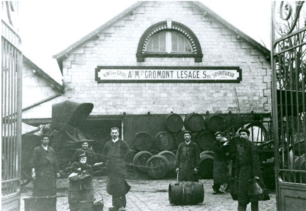
La halle aux vins au début du 20e siècle (AP).