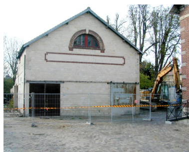
La halle aux vins en cours de démolition, avril 2003.