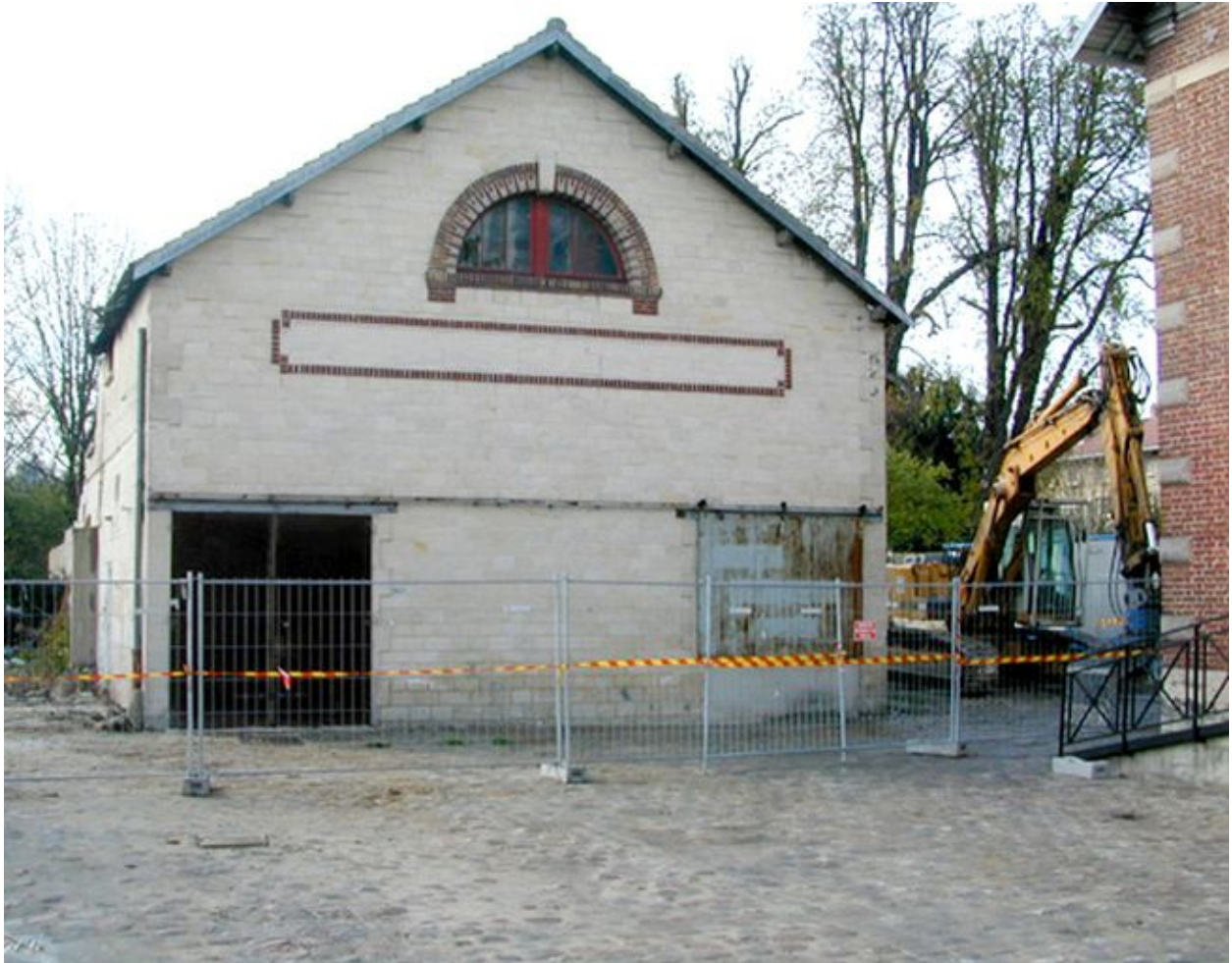
La halle aux vins en cours de démolition, avril 2003.