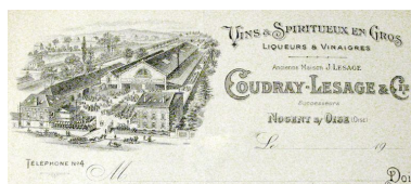
Papier à lettre à en-tête des entrepôts Coudray-Lesage, vers 1920 (AC Nogent).