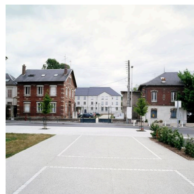
Vue générale des anciens entrepôts Coudray et Lesage.