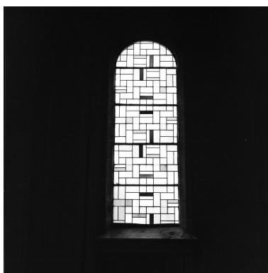
Vue générale d'une verrière. IVR31_20025900785X