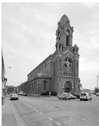
Vue générale du nord-ouest.