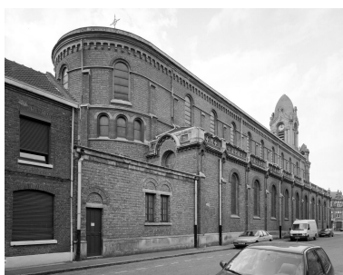
Vue générale du sud-est.