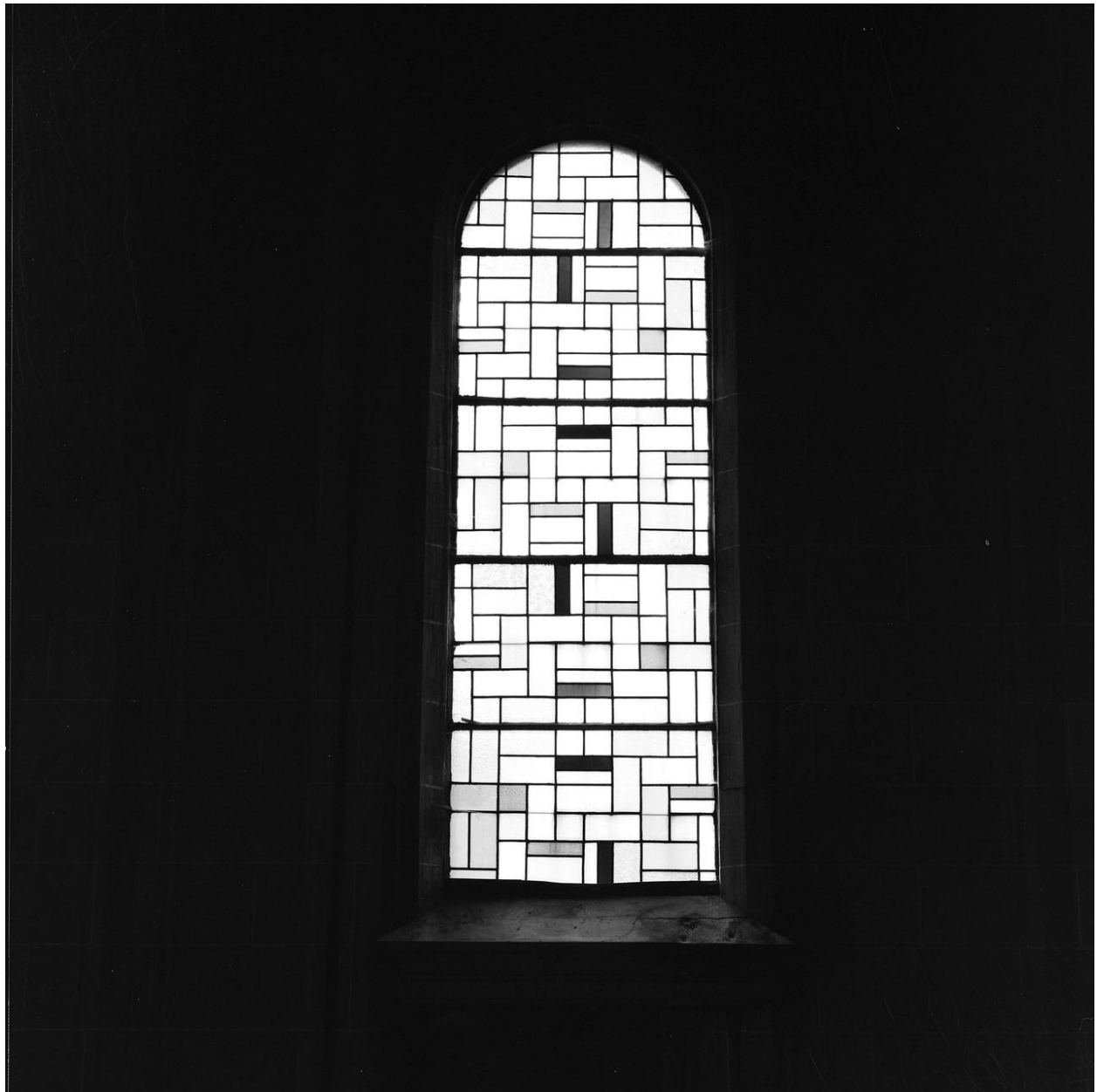
Vue générale d' une verrière.