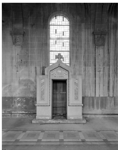
Vue générale d'un confessionnal. IVR31_20025900789V