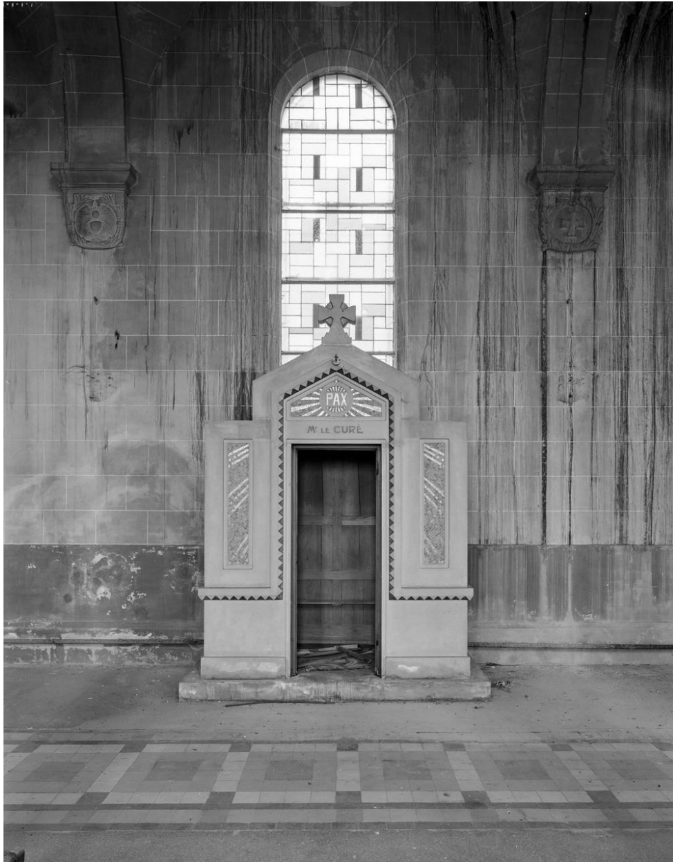
Vue générale d' un confessionnal.