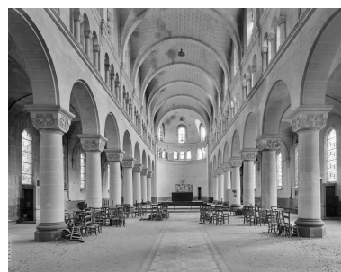
Vue générale de la nef, vers le chœur.