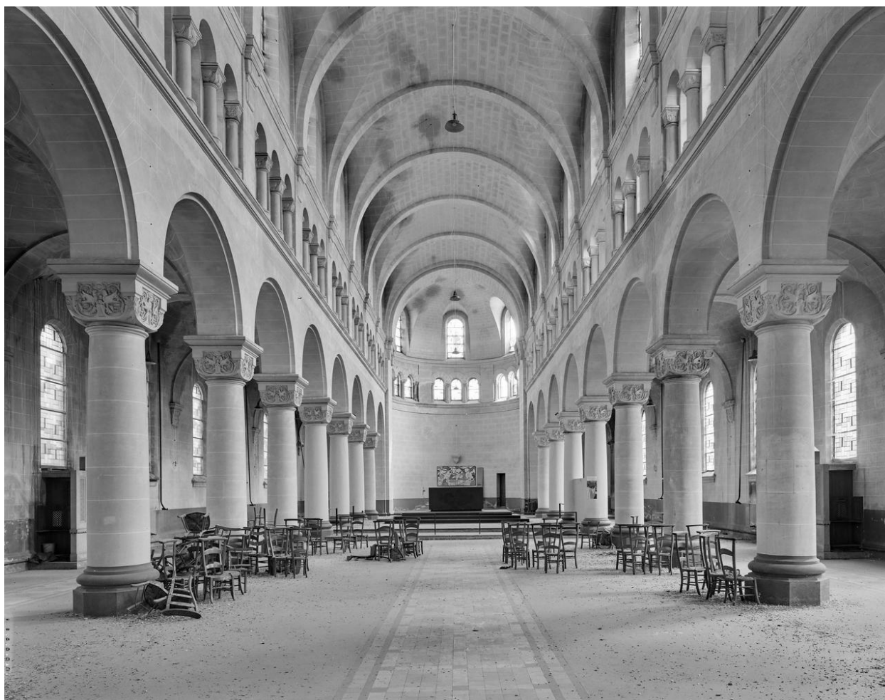
Vue générale de la nef, vers le chœur.