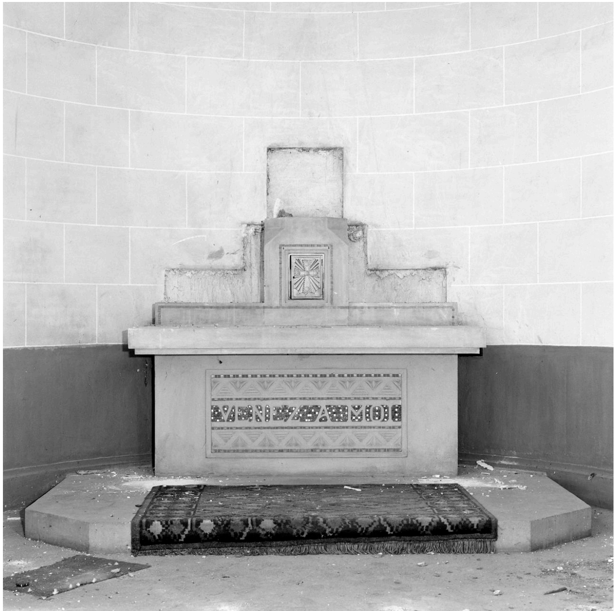
Vue générale d' un autel secondaire.