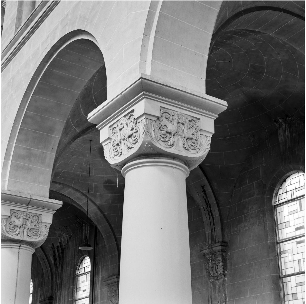
Vue de la nef, détail : colonne et chapiteau.