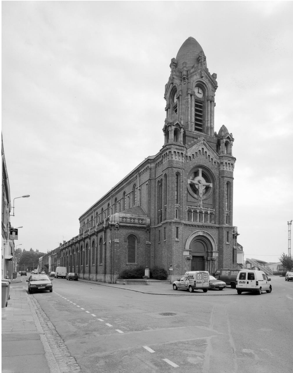
Vue générale du nord-ouest.