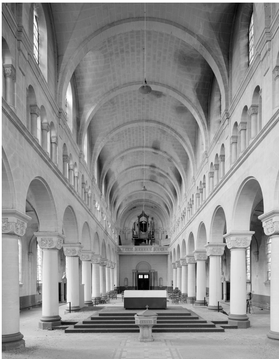
Vue générale de la nef, vers la tribune d'orgue.