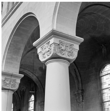
Vue de la nef, détail : colonne et chapiteau. IVR31_20025900788X