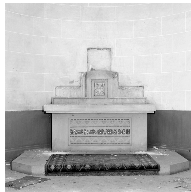
Vue générale d'un autel secondaire.