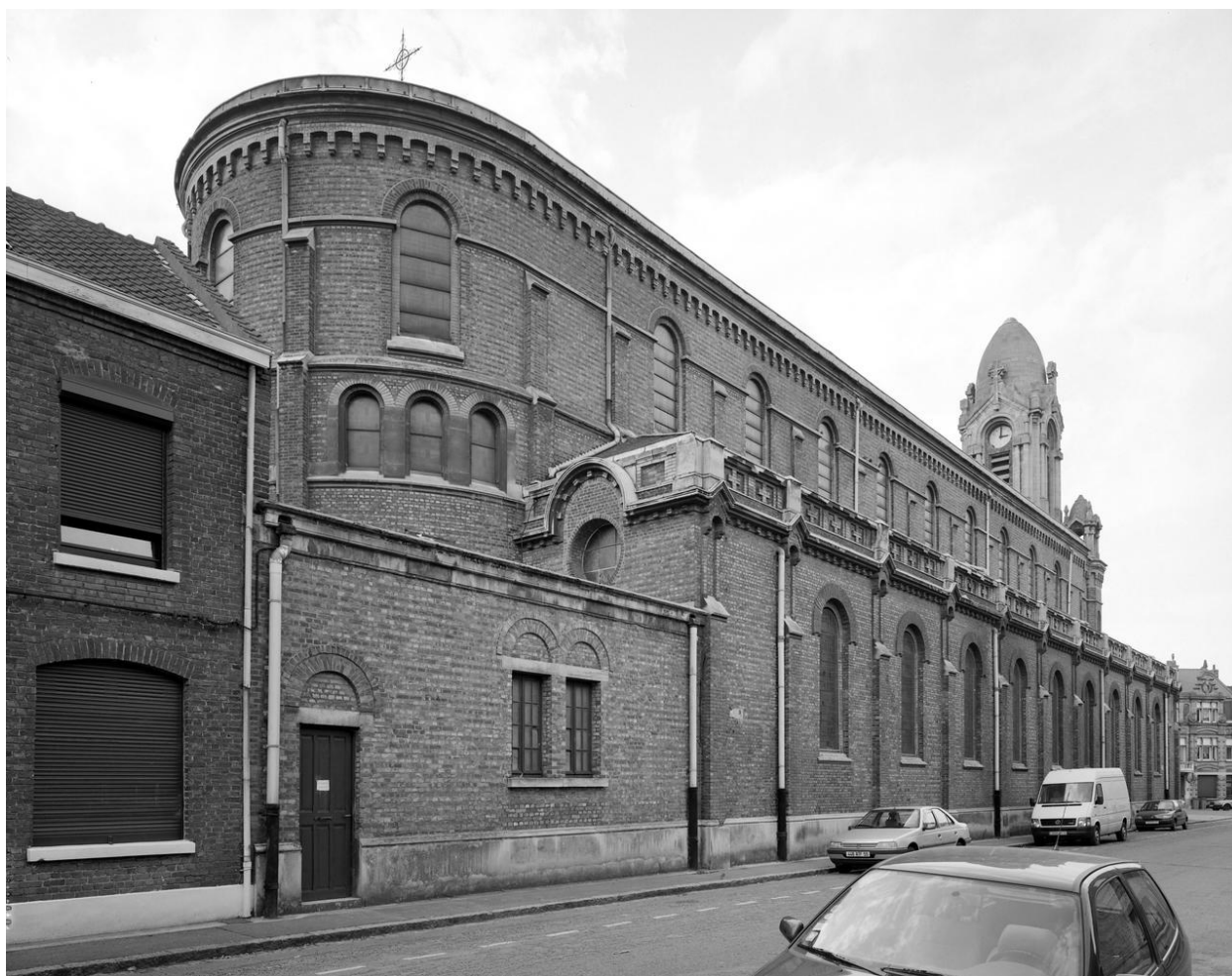
Vue générale du sud-est.