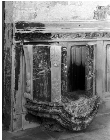
Vue générale, de trois-quarts. IVR22_19980201126X