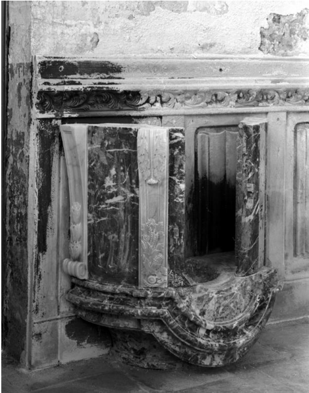
Vue générale, de trois-quarts.