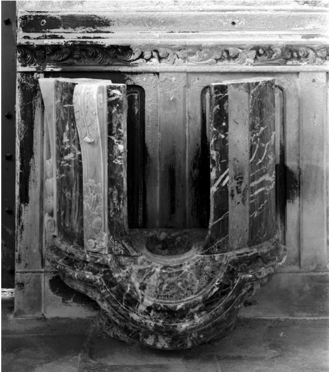
Vue générale, de face.