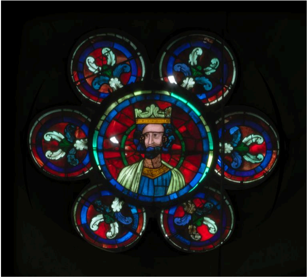
Verrière de l'oculus polylobé de la baie 110.