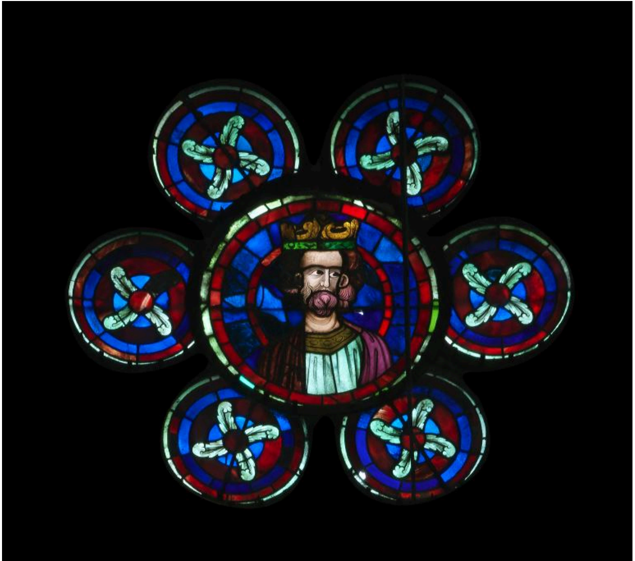
Verrière de l'oculus polylobé de la baie 109.