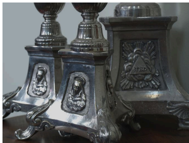
Vue de détail : ensemble des pieds IVR31_20106204011NUCA