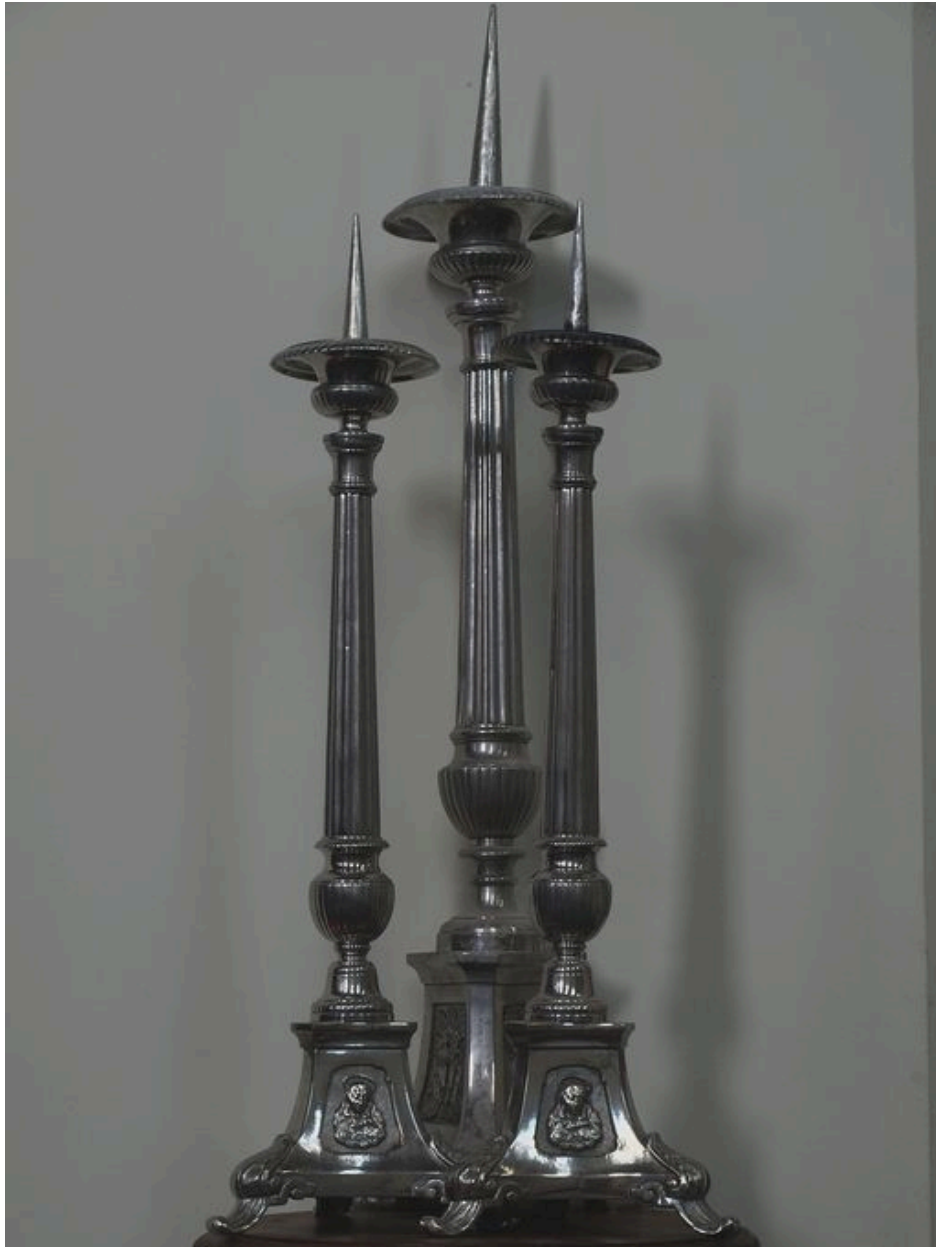
Vue générale de l'ensemble