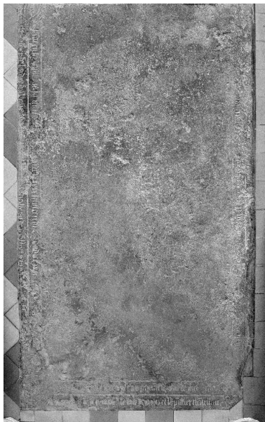
Vue générale de la dalle. IVR22_20010202627X