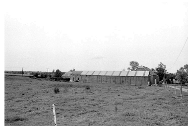
Vue générale depuis le sud-est des étables et de la grange. IVR22_19980201505Z