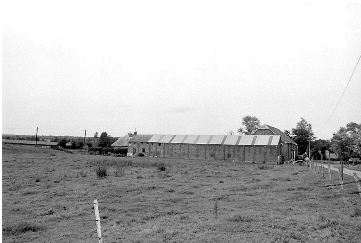
Vue générale depuis le sud-est des étables et de la grange.