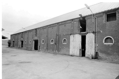
Étables à vaches et à chevaux.