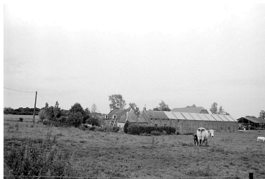
Vue générale depuis le sud-ouest. IVR22_19980201507Z