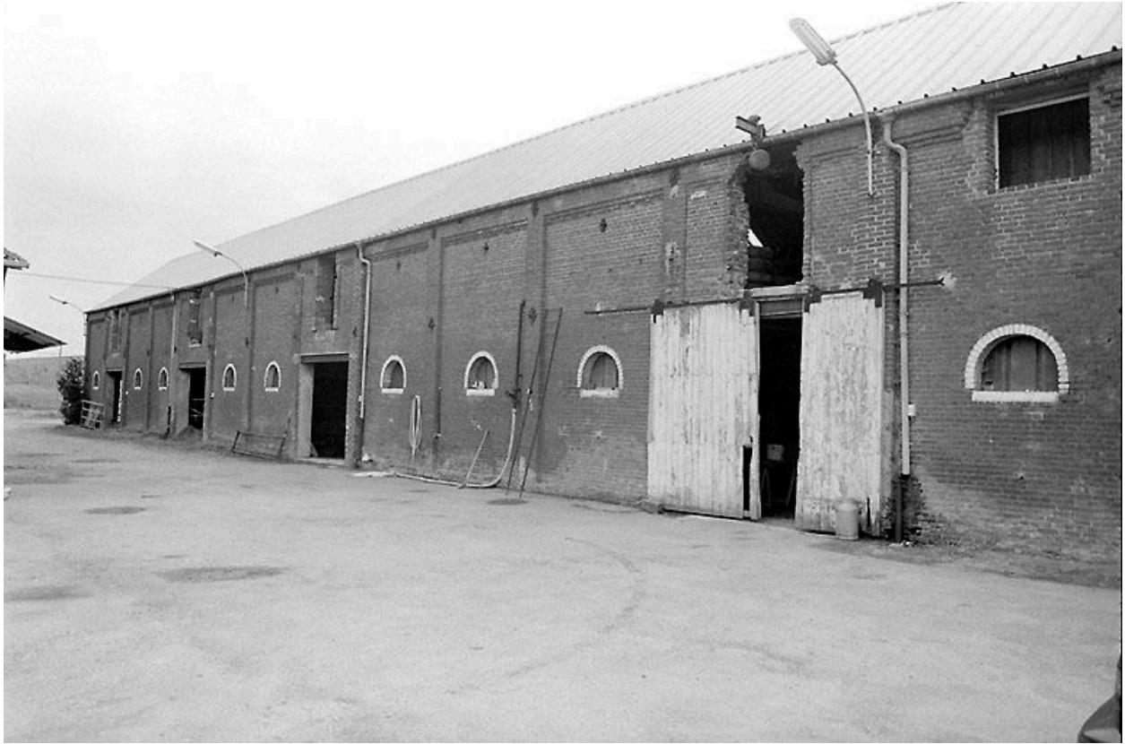
Etables à vaches et à chevaux.