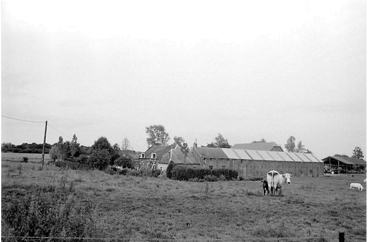
Vue générale depuis le sud-ouest.