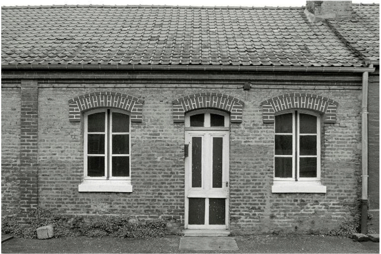
Façade d'un des logements de la cité, en 1990.