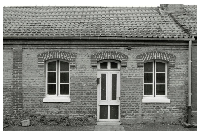
Façade d'un des logements de la cité, en 1990.