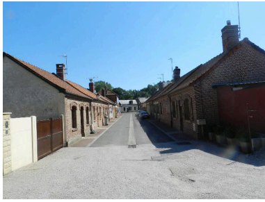
Vue générale, depuis le fond de l'impasse. IVR22_20128015618NUC1A