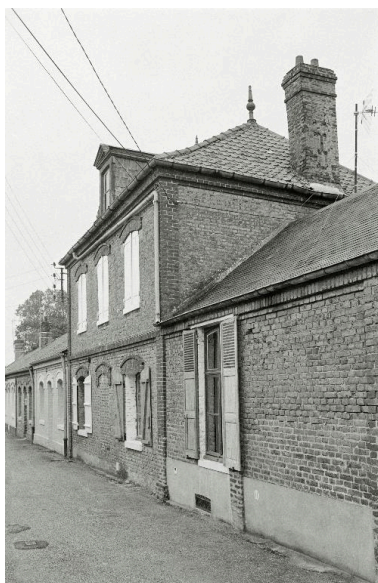
La maison de contremaître, à l'entrée de la cité, en 1990.