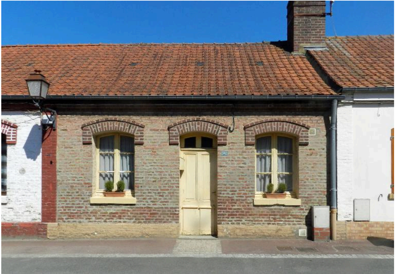
Vue de la façade d'un des logements de la cité.