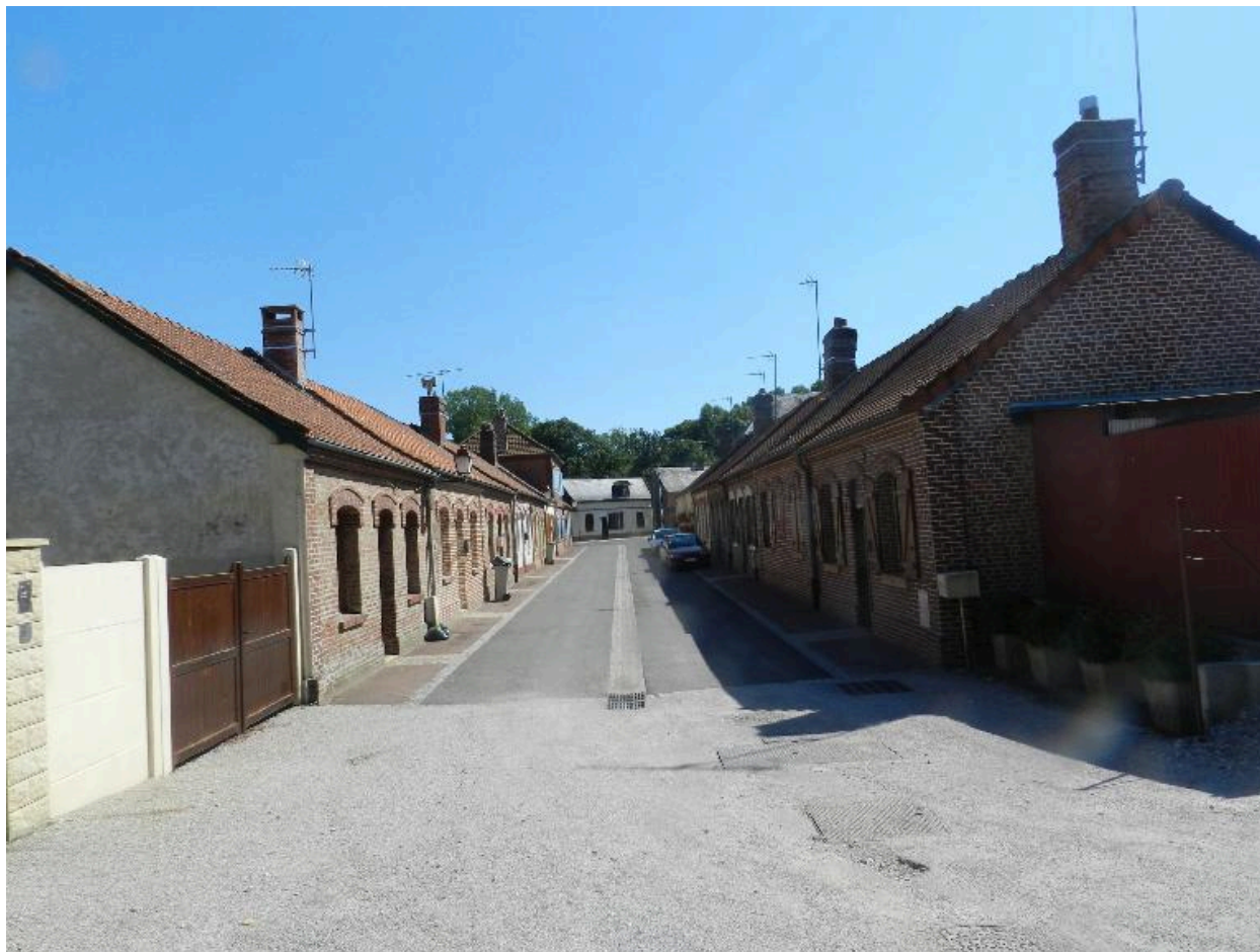
Vue générale, depuis le fond de l'impasse.