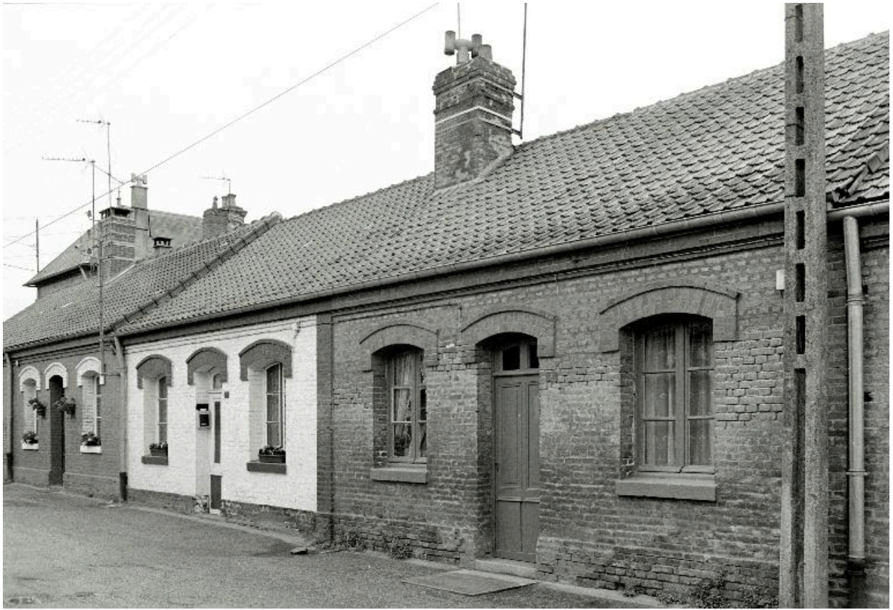
Logements de la rive ouest de la cité, en 1990.