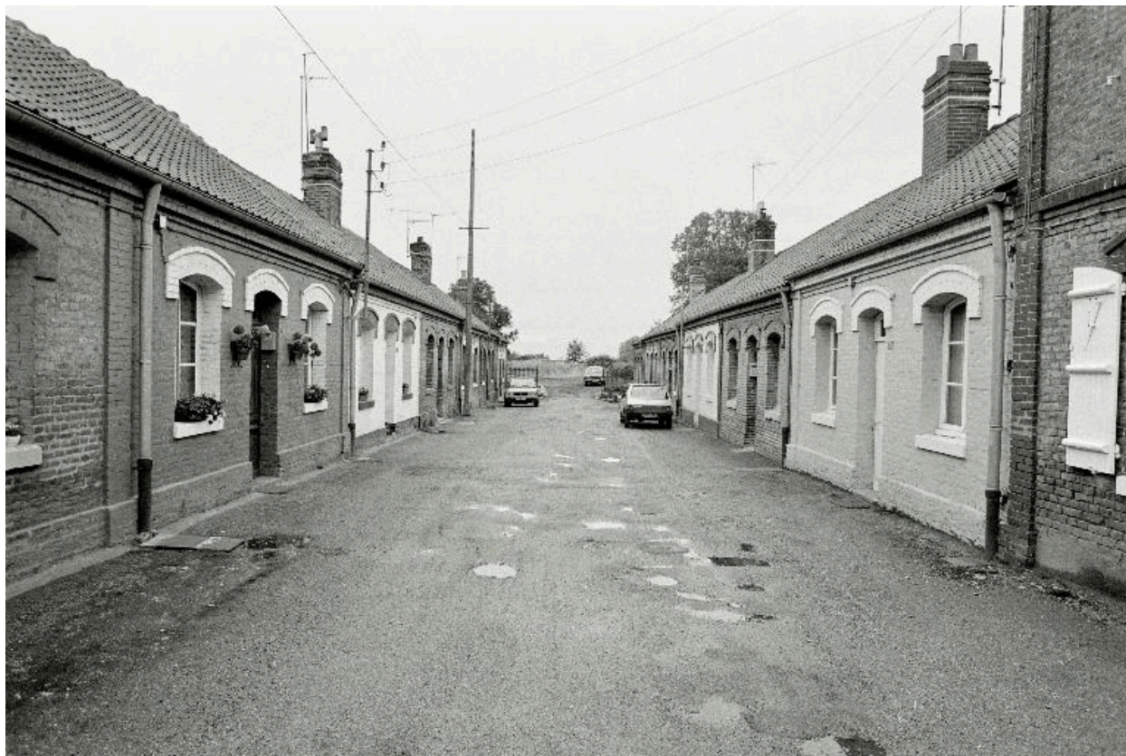
Vue de la cité, en 1990.