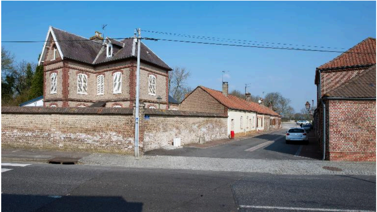
La cité depuis la rue Henri-Barbusse, à gauche l'ancienne maison du fabricant de cadenas Jeremy Villain.