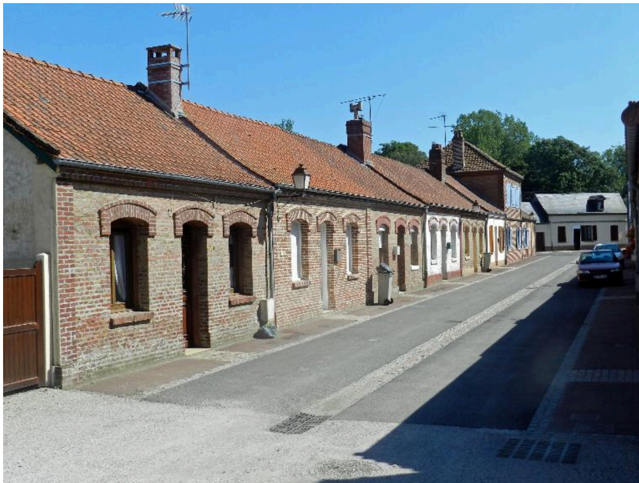
Vue de la rive est de la cité.