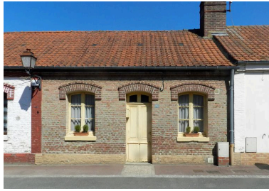
Vue de la façade d'un des logements de la cité. IVR22_20128005218NUC1A