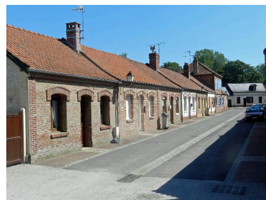
Vue de la rive est de la cité. IVR22_20128005217NUC1A