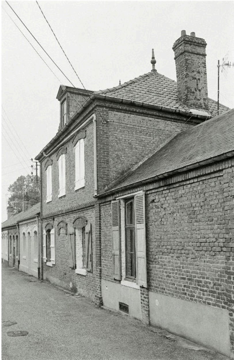
La maison de contremaître, à l'entrée de la cité, en 1990.