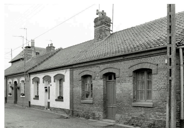
Logements de la rive ouest de la cité, en 1990. IVR22_19908000059Z