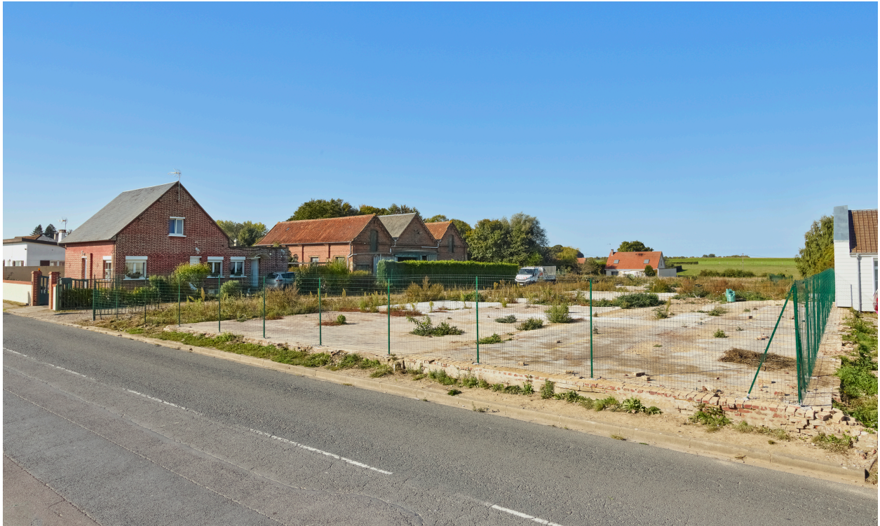
Site de l'ancienne usine, depuis le nord.