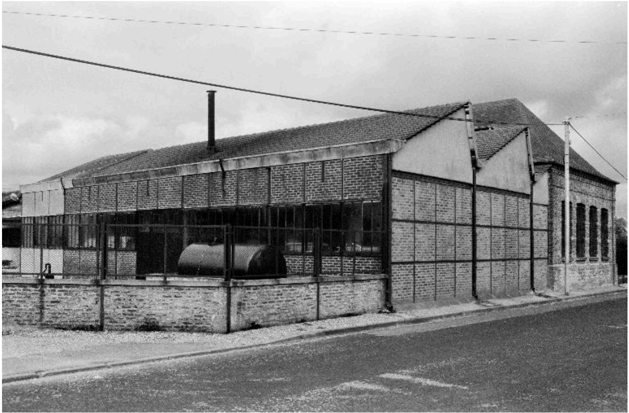
Atelier de fabrication, flanc sud-est.