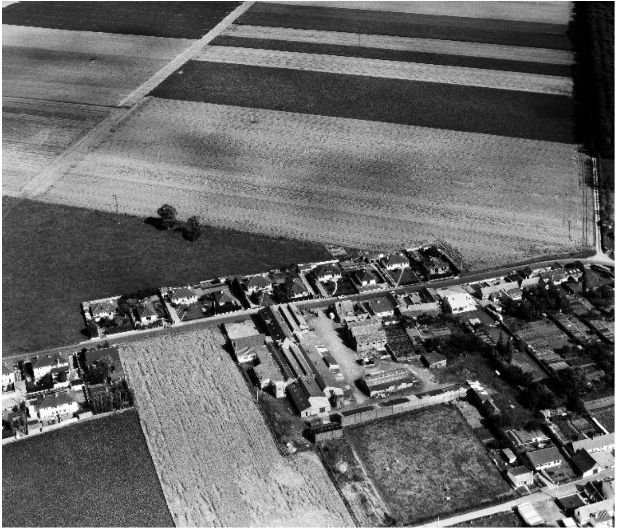
Vue aérienne, flanc ouest.