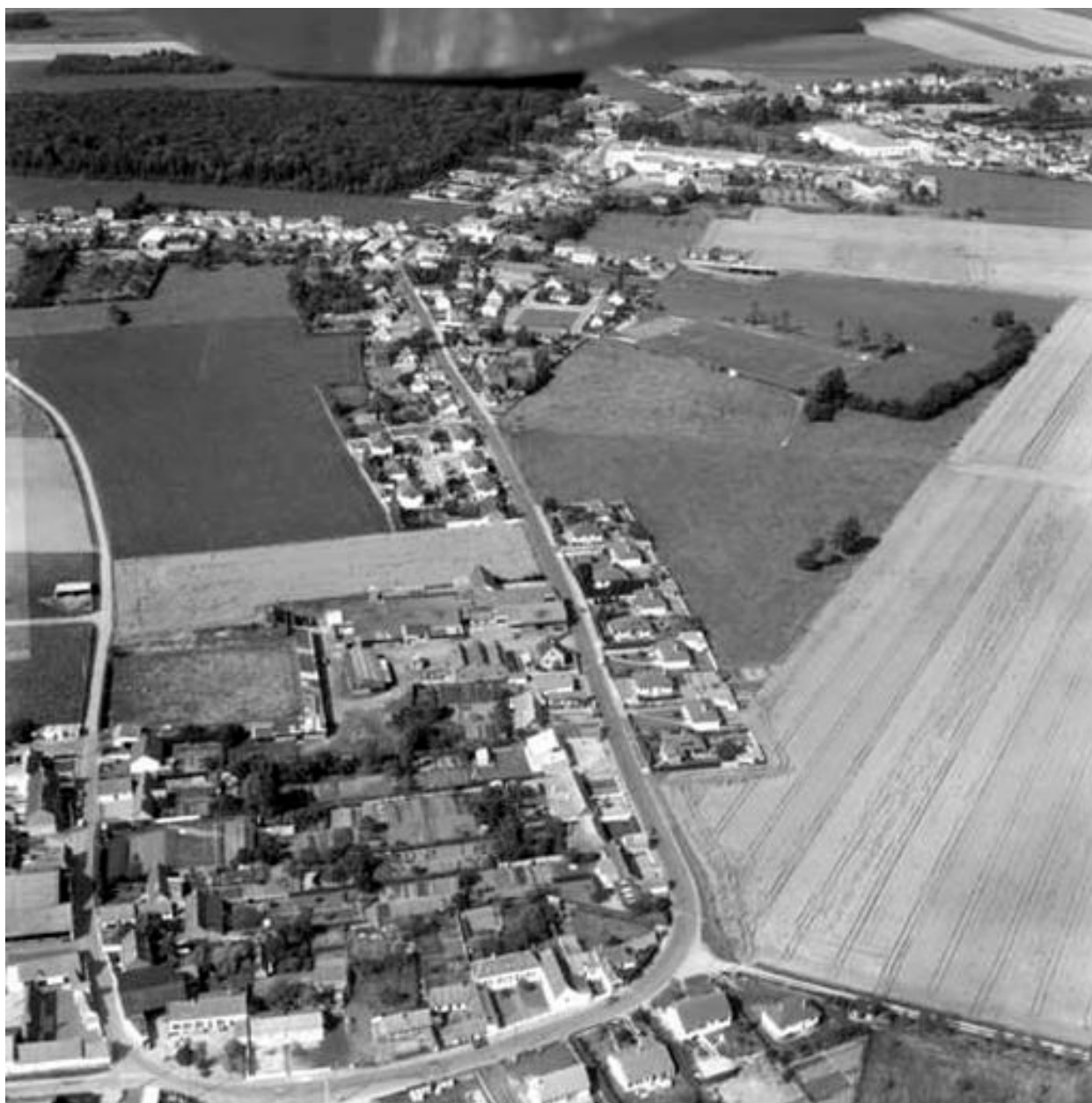
Vue aérienne, flanc sud.