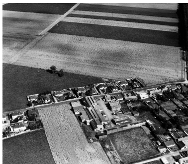
Vue aérienne, flanc ouest.

IVR22_19898000519ZB