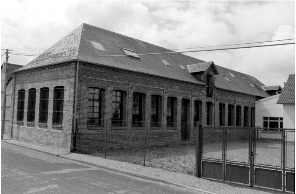
Atelier de fabrication, flanc nord.