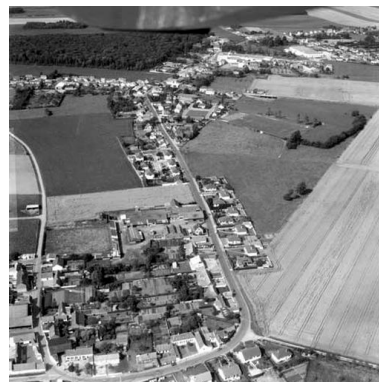
Vue aérienne, flanc sud.