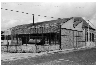
Atelier de fabrication, flanc sud-est. IVR22_19888001118Z