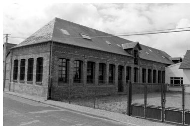
Atelier de fabrication, flanc nord. IVR22_19888001120Z