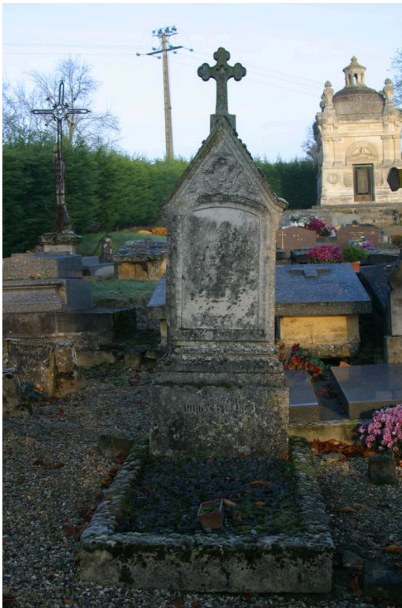
Vue d'une tombe ancienne du cimetière communal.