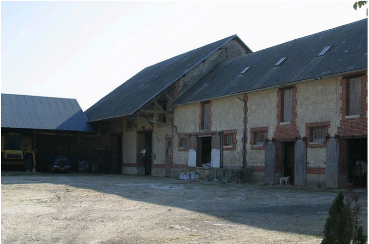
Vue de l'étable située sur le côté sud de la propriété.