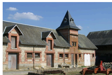
Vue du pigeonnier sur le côté nord de la propriété.