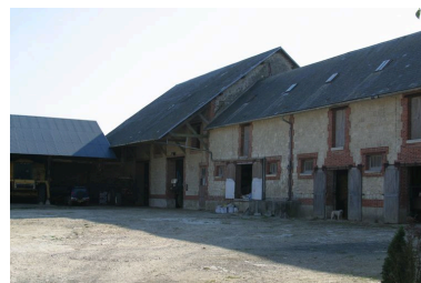
Vue de l'étable située sur le côté sud de la propriété.