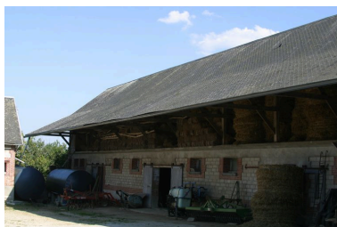
Vue de la grange en fond de cour.