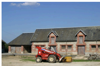
Vue de l'écurie située dans le prolongement du pigeonnier IVR22_20050200884NUCA