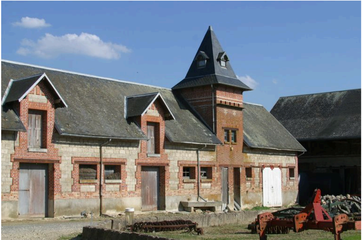
Vue du pigeonnier sur le côté nord de la propriété.