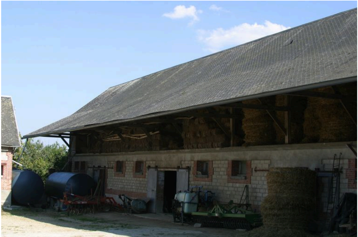
Vue de la grange en fond de cour.