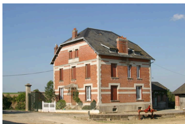
Vue du logis depuis l'intérieur de la cour. IVR22_20050200882NUCA