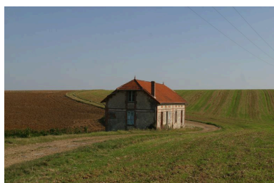
Vue de la maison ouvrière isolée. IVR22_20050200887NUCA