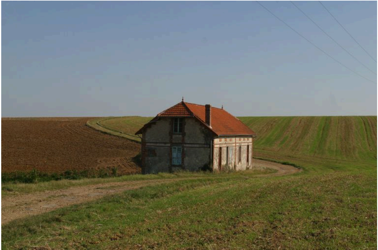
Vue de la maison ouvrière isolée.