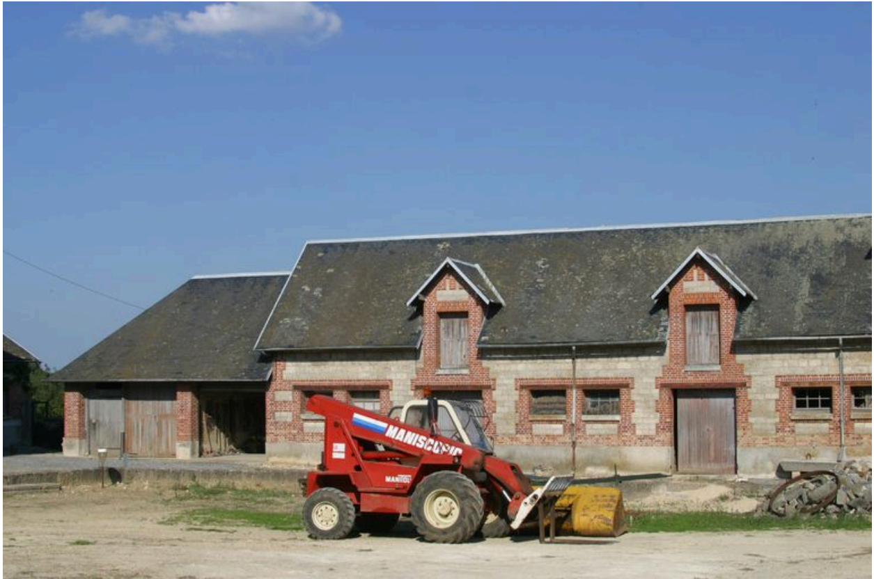
Vue de l'écurie située dans le prolongement du pigeonnier