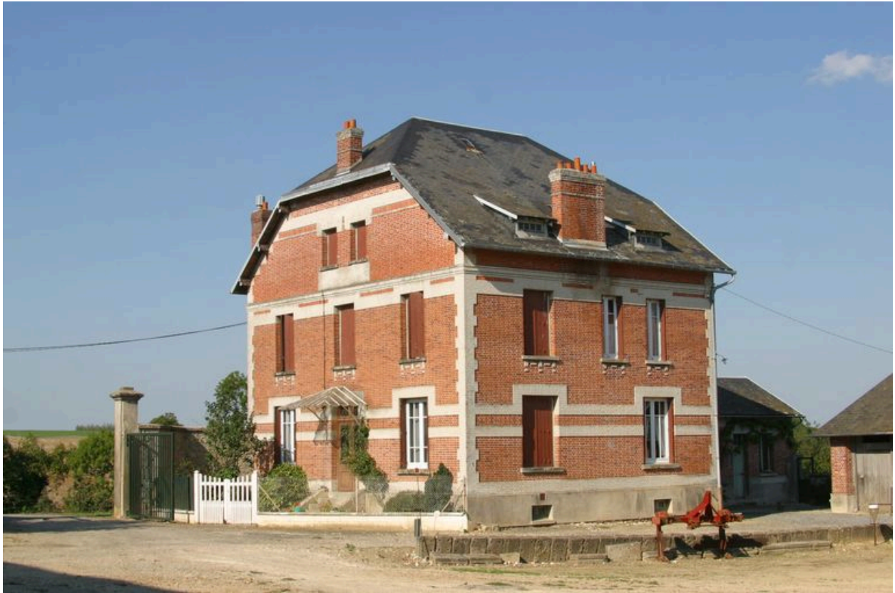
Vue du logis depuis l'intérieur de la cour.