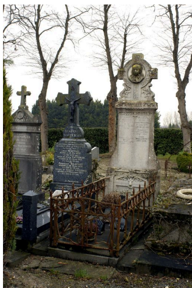
Vue générale. IVR22_20058000973NUCA