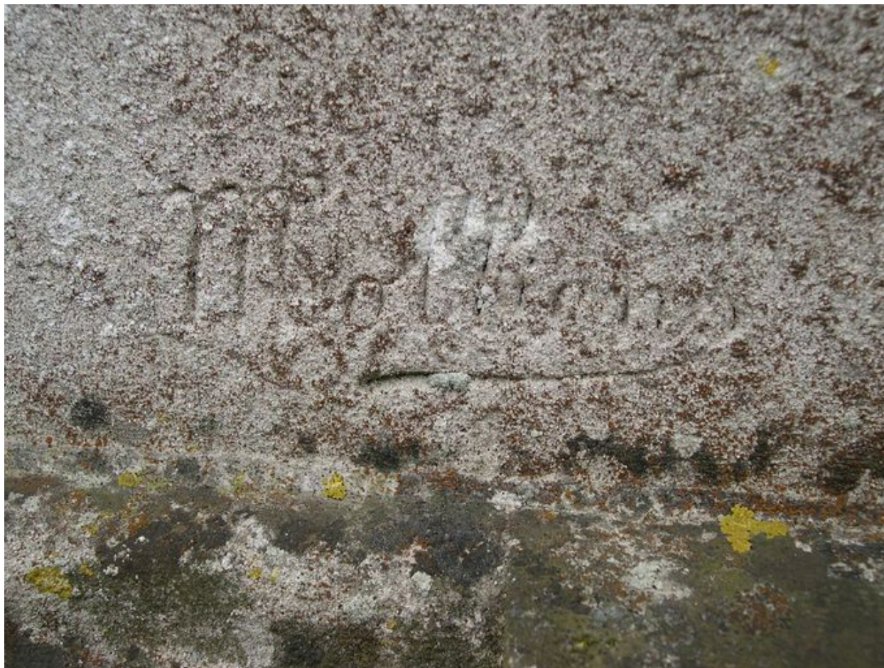
Vue de détail sur la signature du sculpteur Charles Molliens.