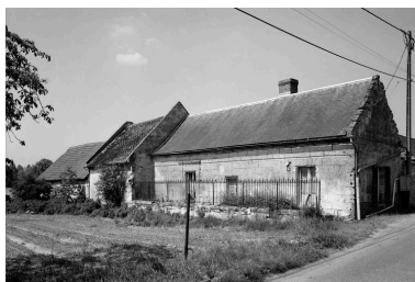
Logis. Elévation postérieure. IVR22_19856000887X