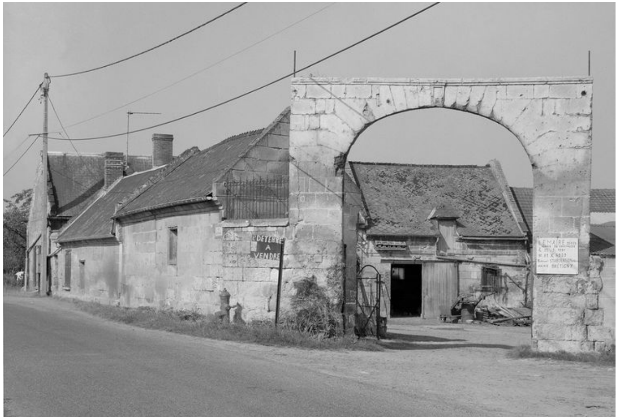
Vue générale depuis la rue.