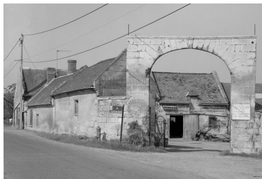
Vue générale depuis la rue. IVR22_19856000899X

IVR22_20096000055NUCA