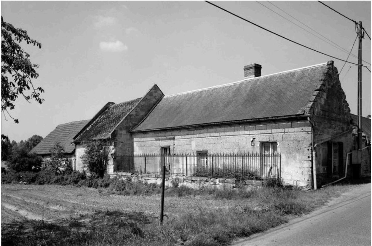
Logis. Elévation postérieure.