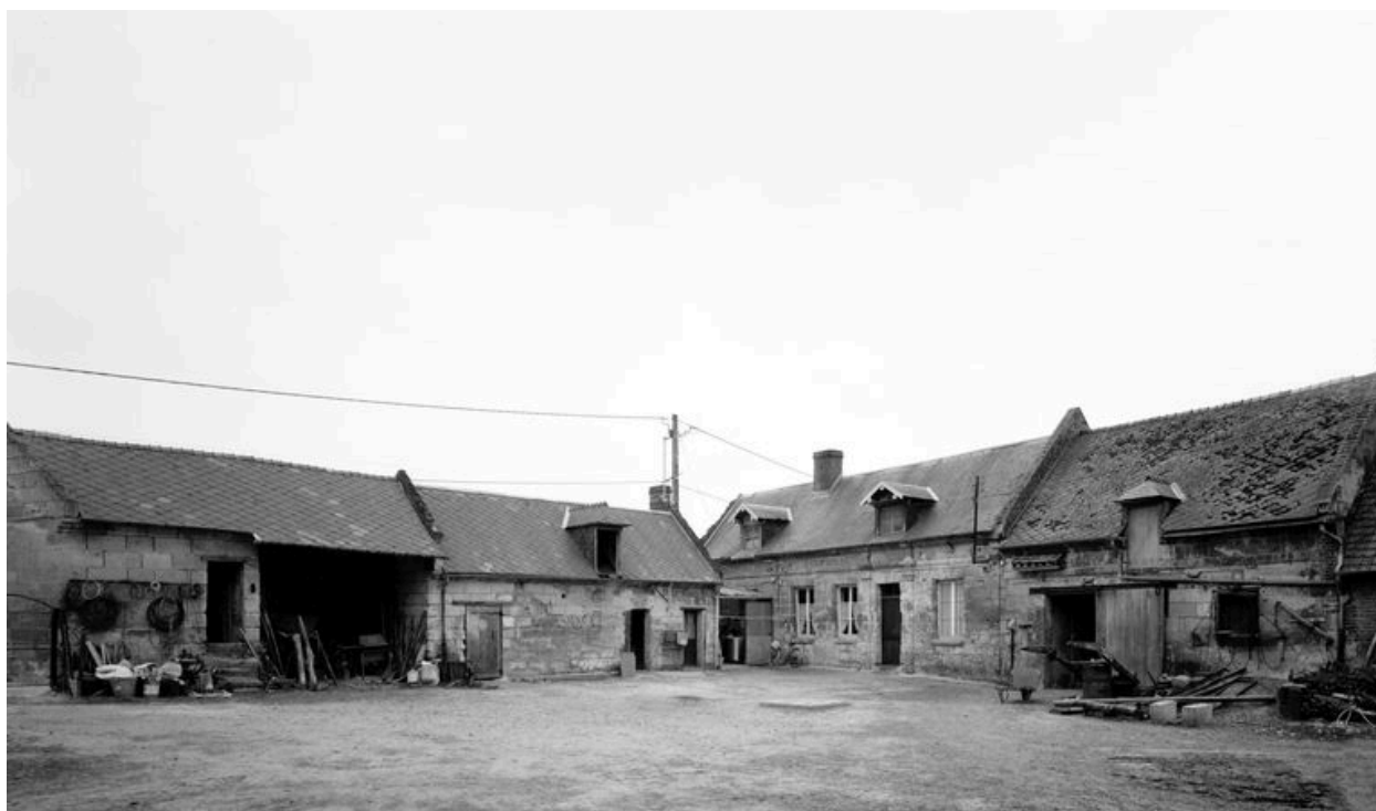
Vue des bâtiments sur cour.