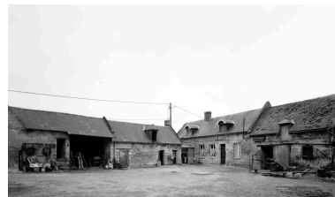
Vue des bâtiments sur cour.