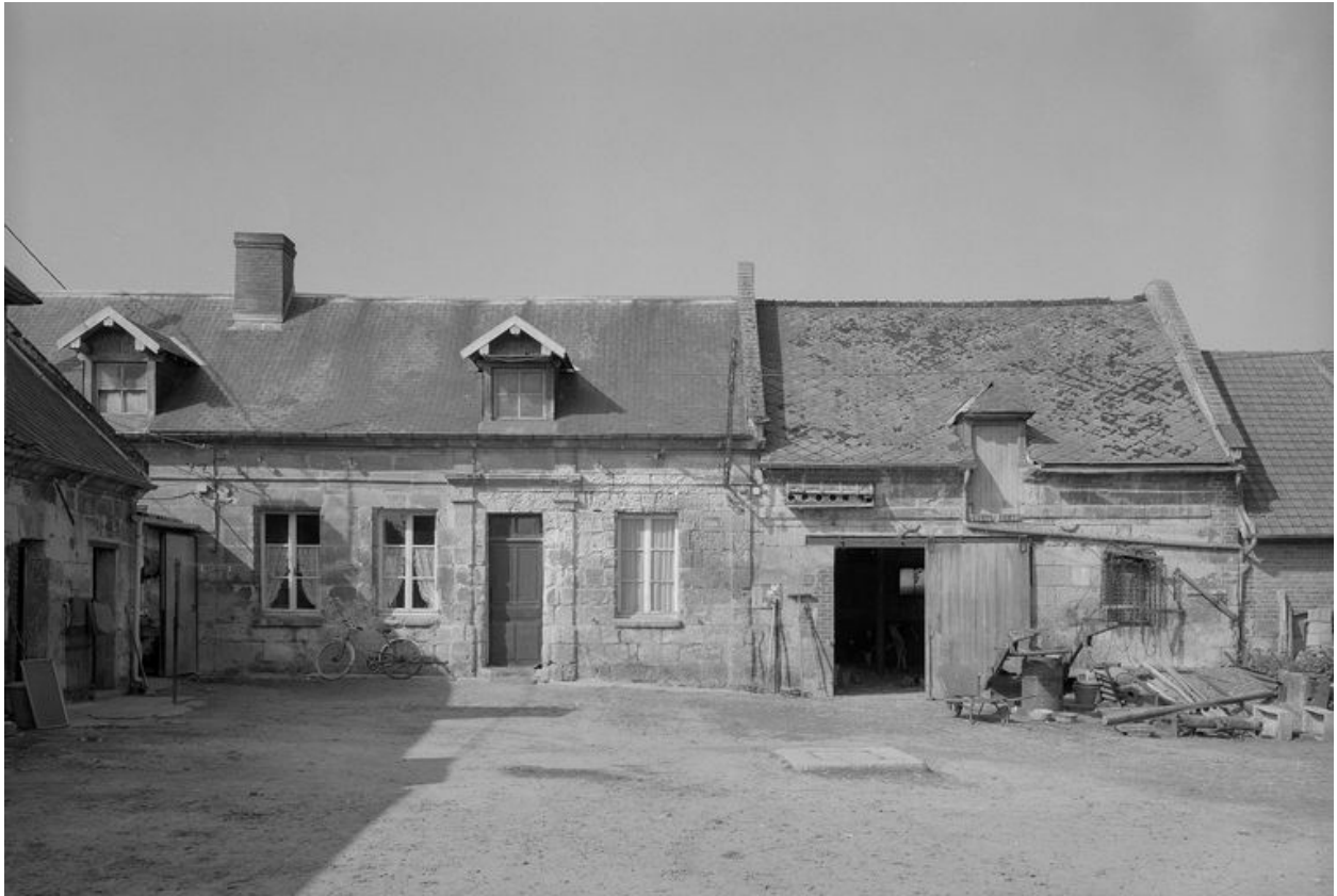
Logis. Elévation antérieure.