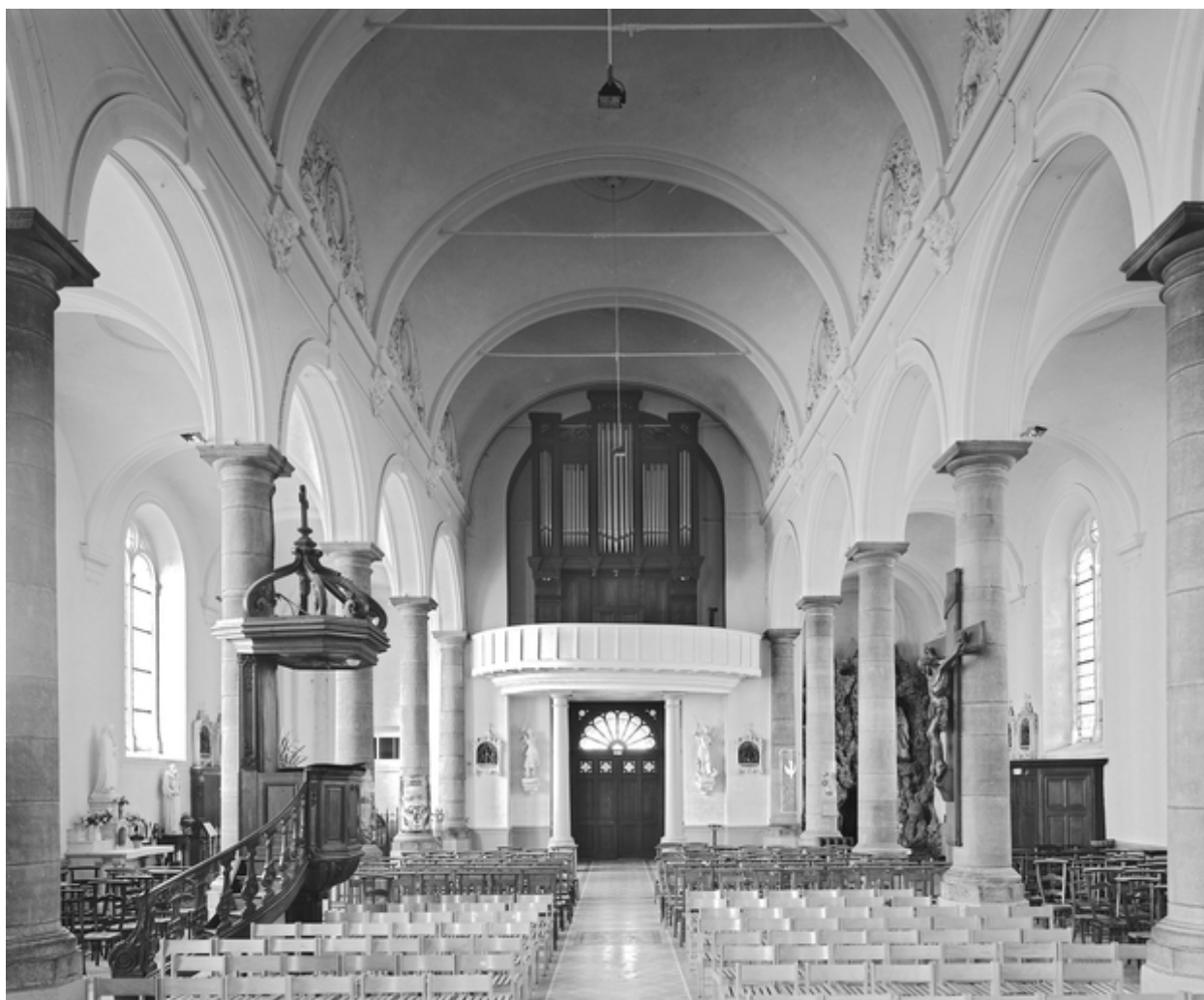
Vue générale intérieure vers l'entrée.