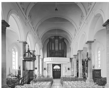
Vue générale intérieure vers l'entrée. IVR31_20045900156V