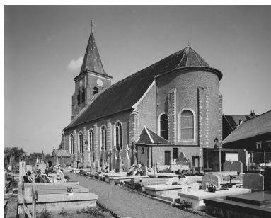
Vue générale extérieure, depuis le cimetière.