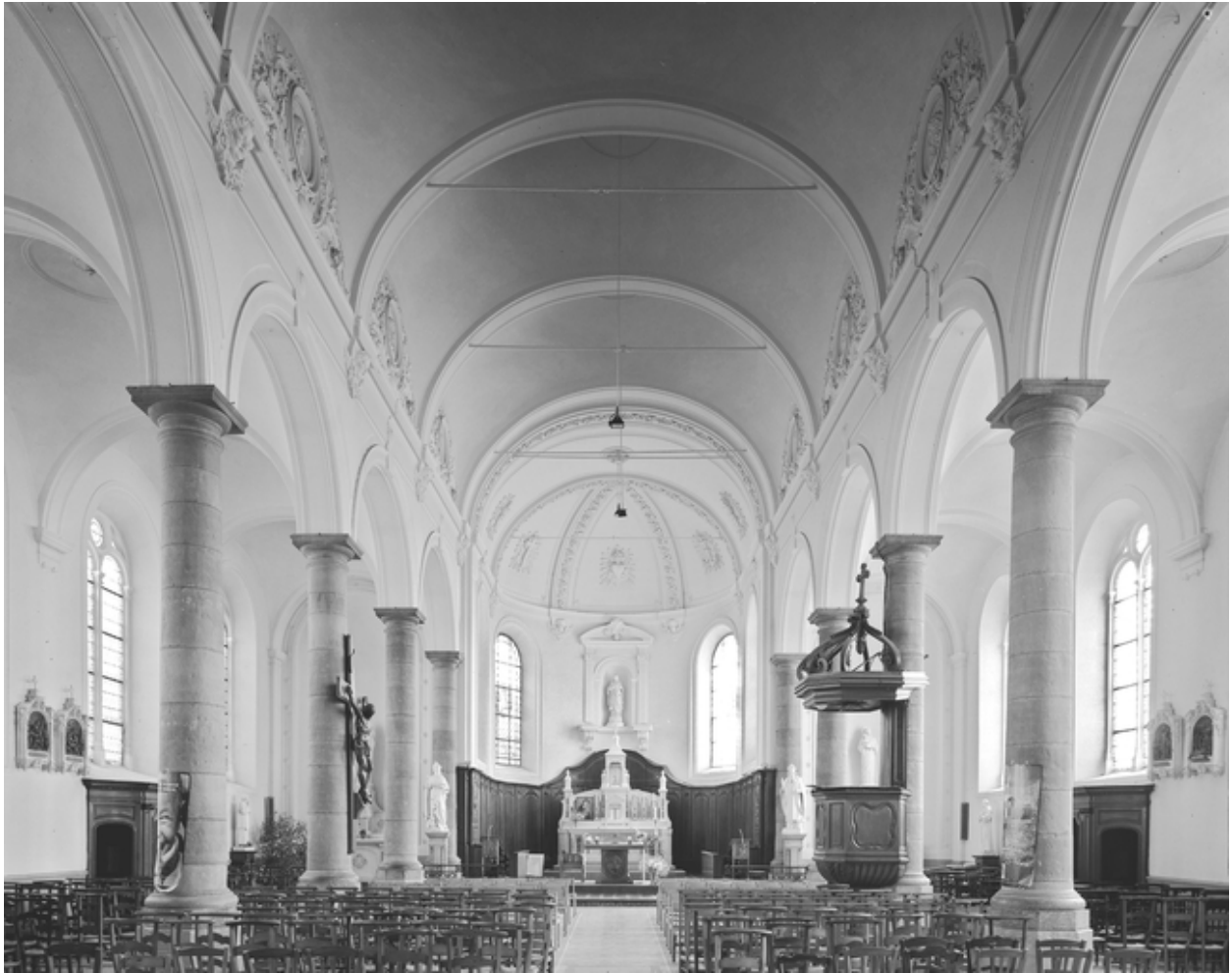
Vue générale intérieure vers le chœur.