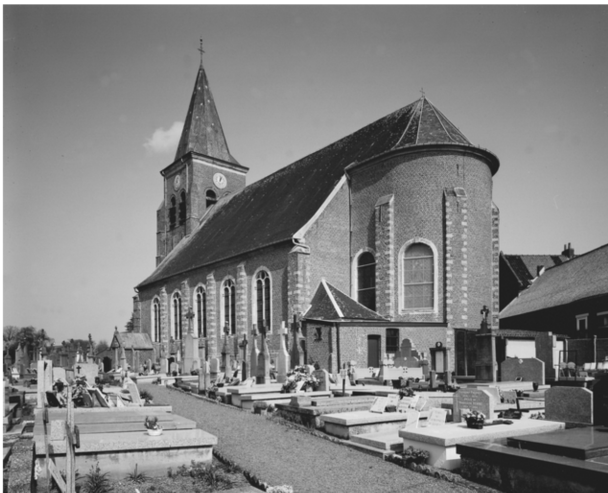
Vue générale extérieure, depuis le cimetière.