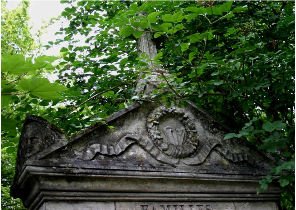
Fronton sculpté de la stèle, orné aux angles de têtes féminines figurant la douleur.