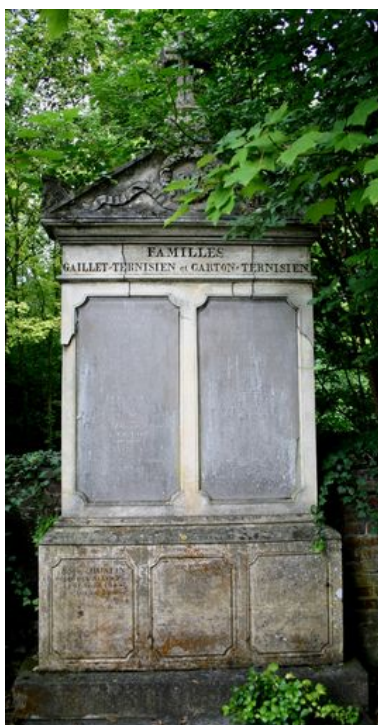
Stèle à entablement et fronton. IVR22_20068001348NUCA