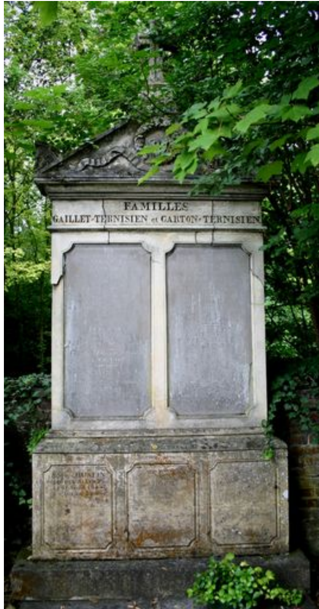
Stèle à entablement et fronton.