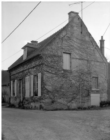
Logis. Vue générale. IVR22_19846001399V