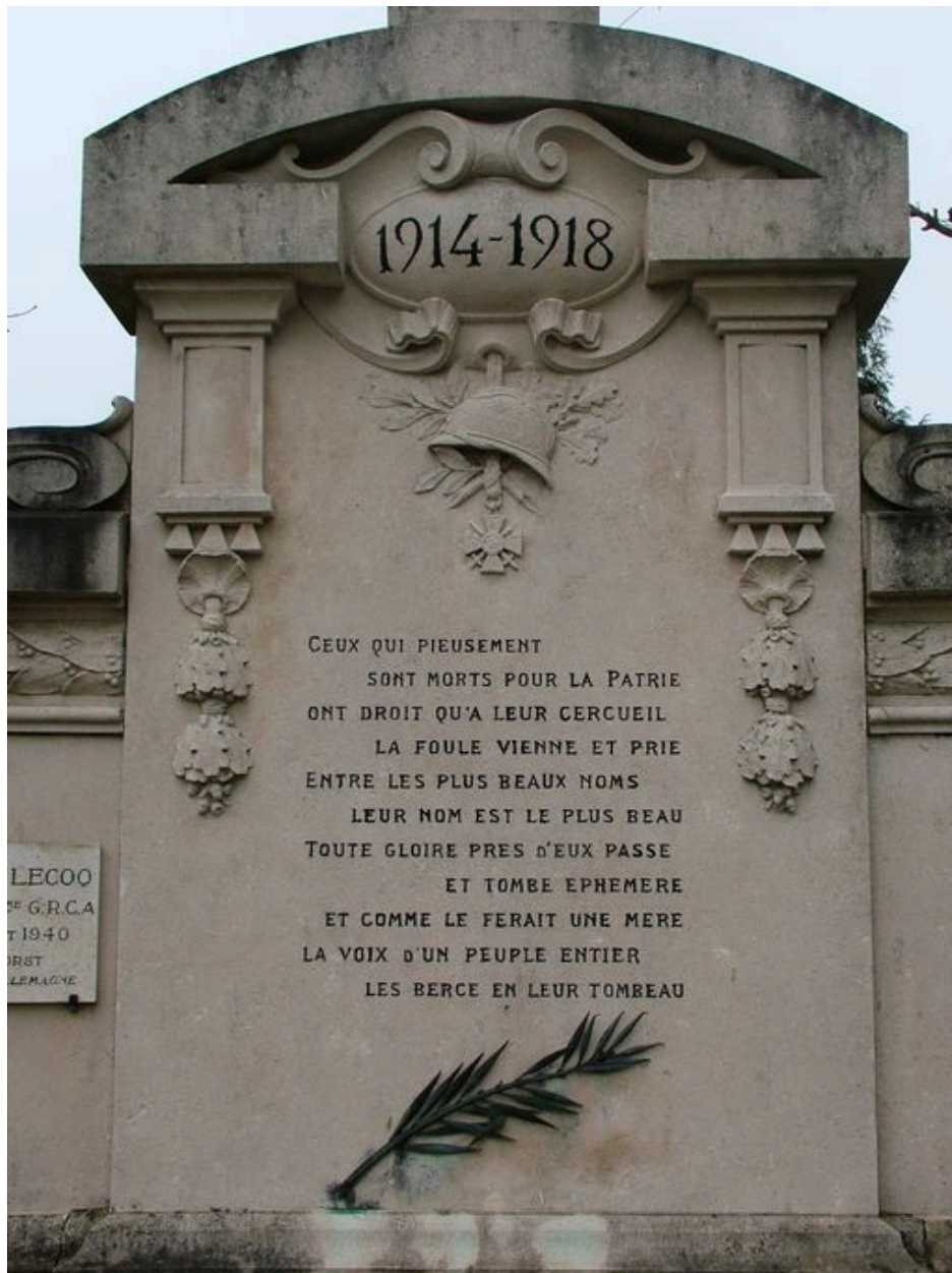
Détail de la partie centrale.