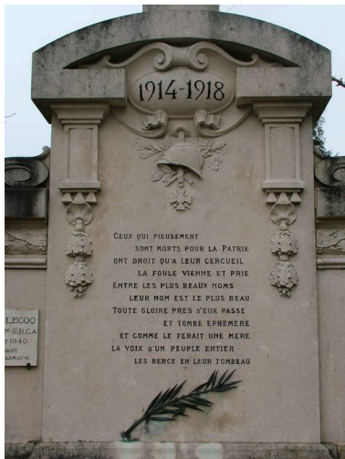
Détail de la partie centrale.