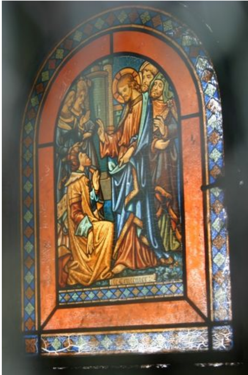
Détail du vitrail droit, représentant le Christ bénissant un riche personnage.