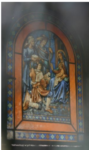
Détail du vitrail droit, représentant l'Adoration des bergers. IVR22_20098001065NUCA

IVR22_20098001064NUCA