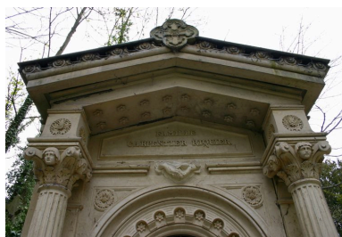
Détail des décors sculptés du fronton du tombeau en forme de chapelle.

Phot. Caroline Vincent IVR22_20098001064NUCA