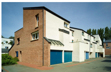
L'allée des Charmettes vue depuis l'entrée de l'îlot. Elle dessert une première bande de logements (n°42-56).