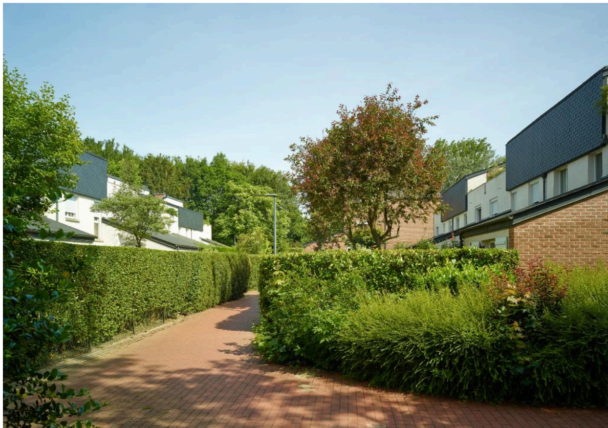
Chemin piétonnier, à l'arrière des jardins, parcourant l'ilot du nord au sud.