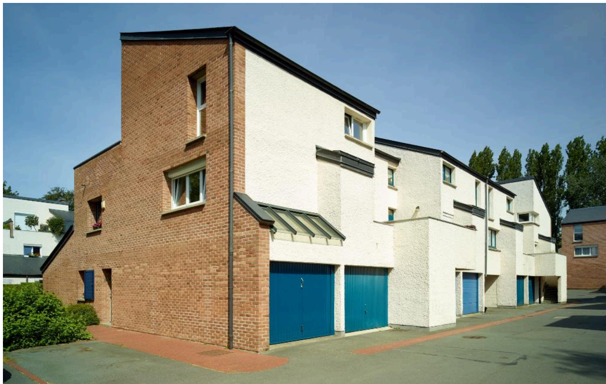
L'allée des Charmettes vue depuis l'entrée de l'ilot. Elle dessert une première bande de logements (n°42-56).