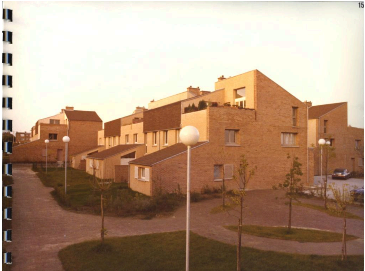
Vue depuis la placette marquant l'entrée de la Châtellenie. Photographie, 1978. On note le parement initial, intégralement en brique (AC Villeneuve d'Ascq ; 16W3).