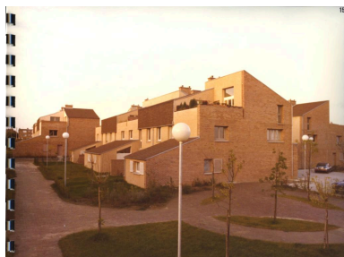
Vue depuis la placette marquant l'entrée de la Châtellenie. Photographie, 1978. On note le parement initial, intégralement en brique