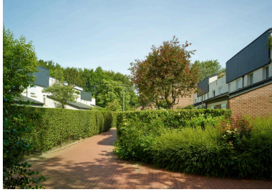
Chemin piétonnier, à l'arrière des jardins, parcourant l'ilot du nord au sud.