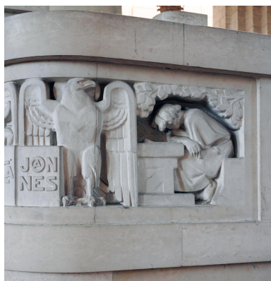
Vue de détail : l'aigle de saint Jean. IVR32_20226200064NUCA