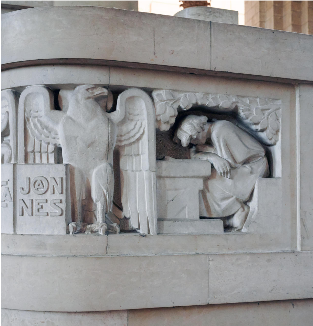
Vue de détail : l'aigle de saint Jean.