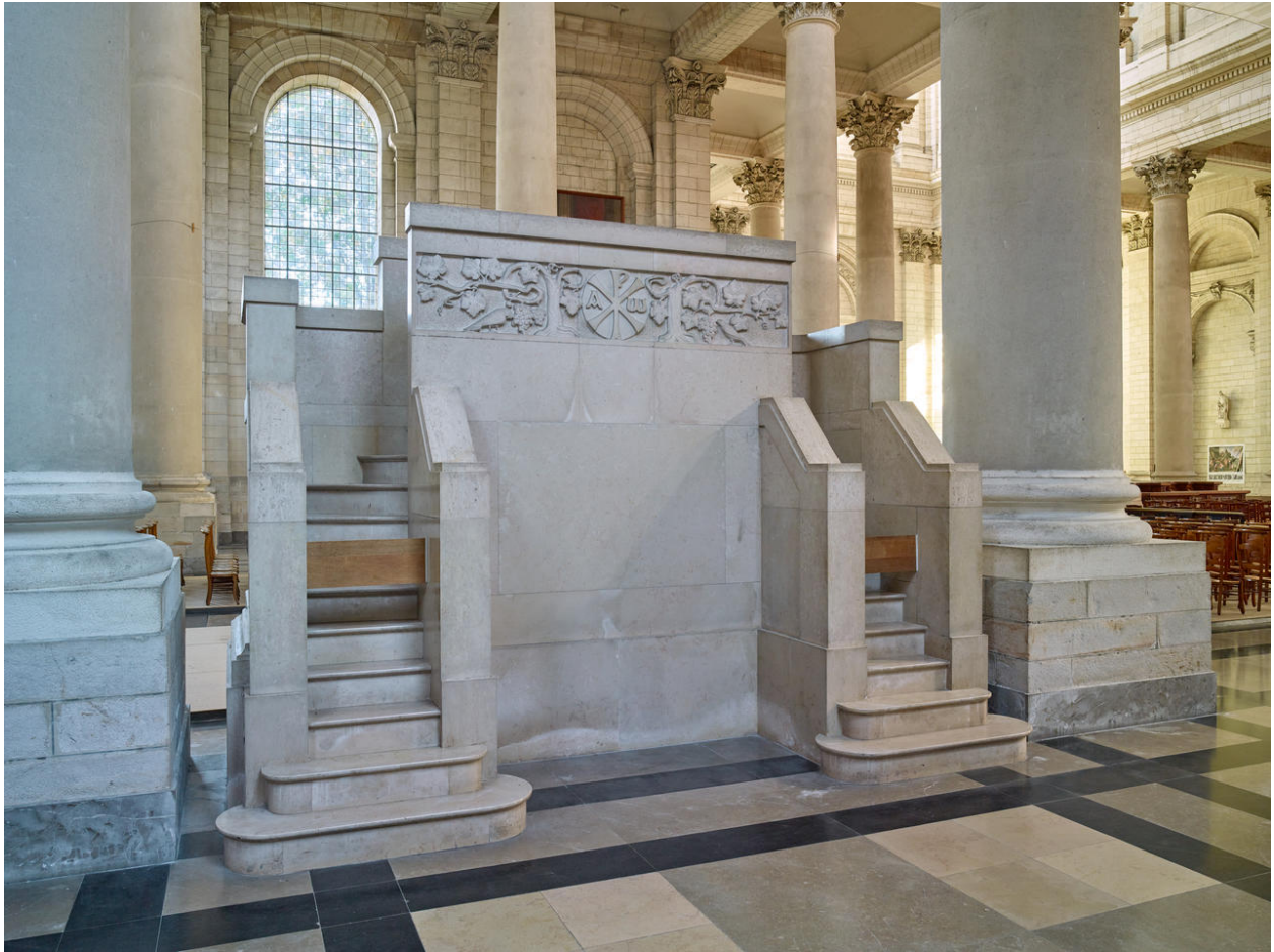
Vue du revers.