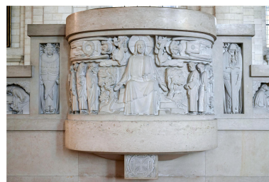
Détail de la sculpture de la cuve : le Christ et ses disciples.