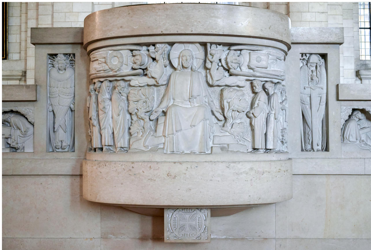
Détail de la sculpture de la cuve : le Christ et ses disciples.