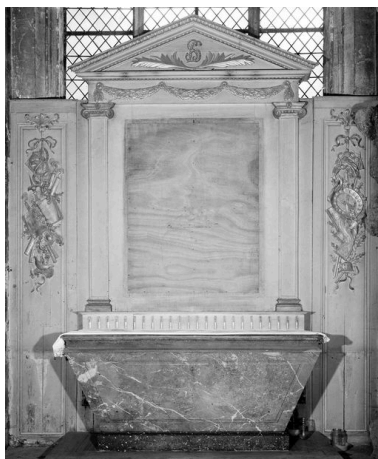
Retable de la 5e chapelle nord.