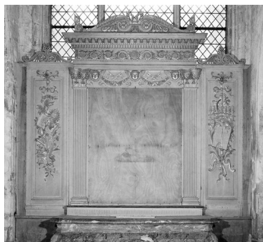
Retable de la 4e chapelle nord. IVR22_19846000820V