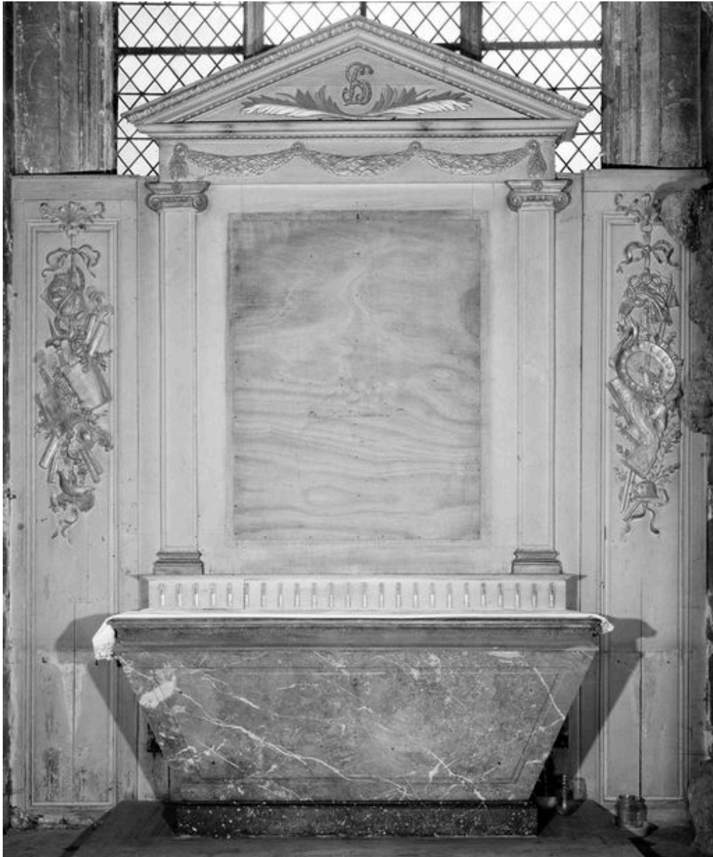
Retable de la 5e chapelle nord.