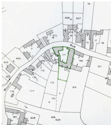
Plan de situation. Extrait du plan cadastral de 1983, section B1 171.