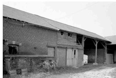
Grange et hangar.