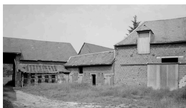
Grange et étable.