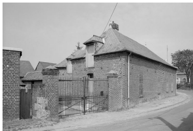
Logis. Elévation sur rue. IVR22_19856000859X