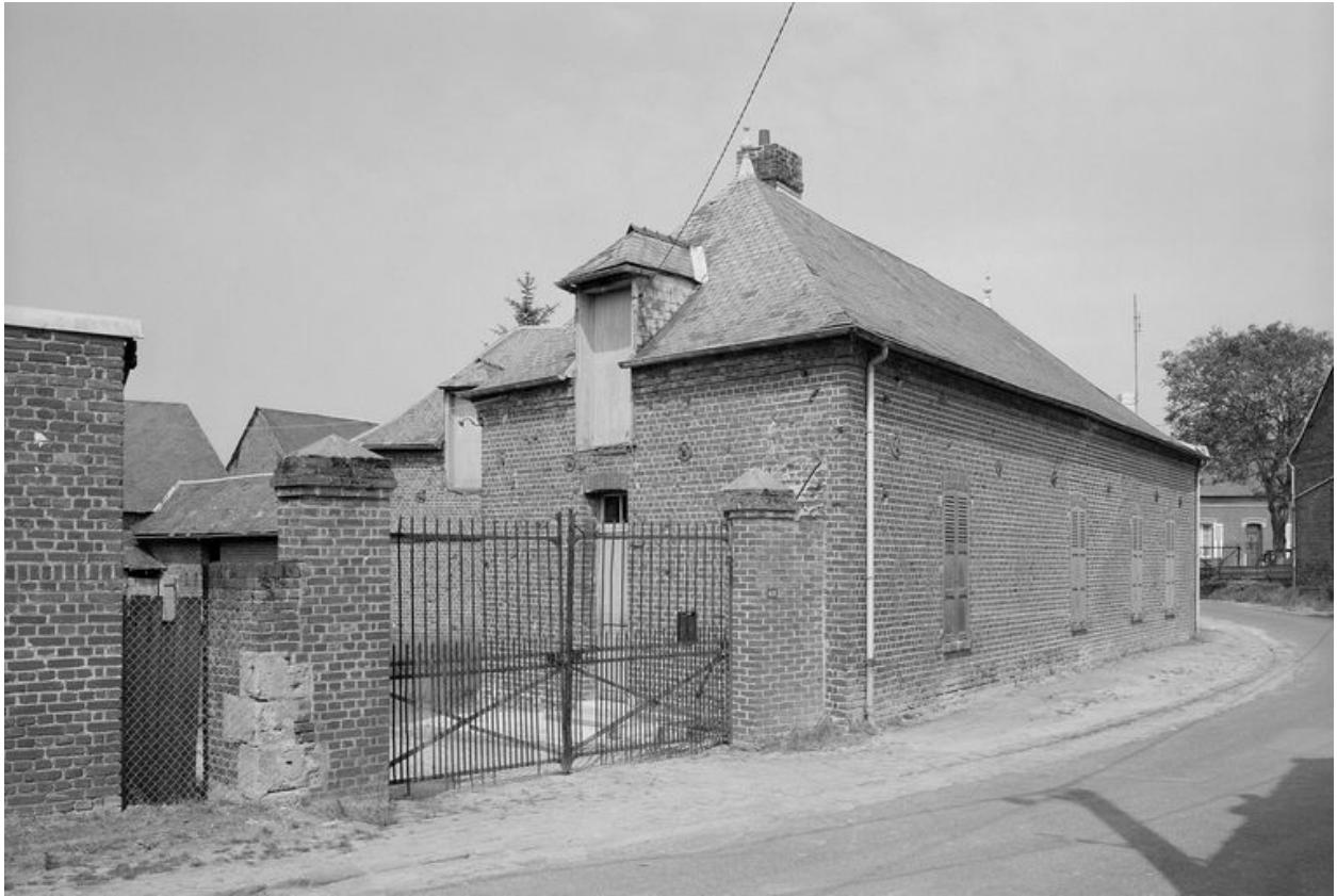
Logis. Elévation sur rue.