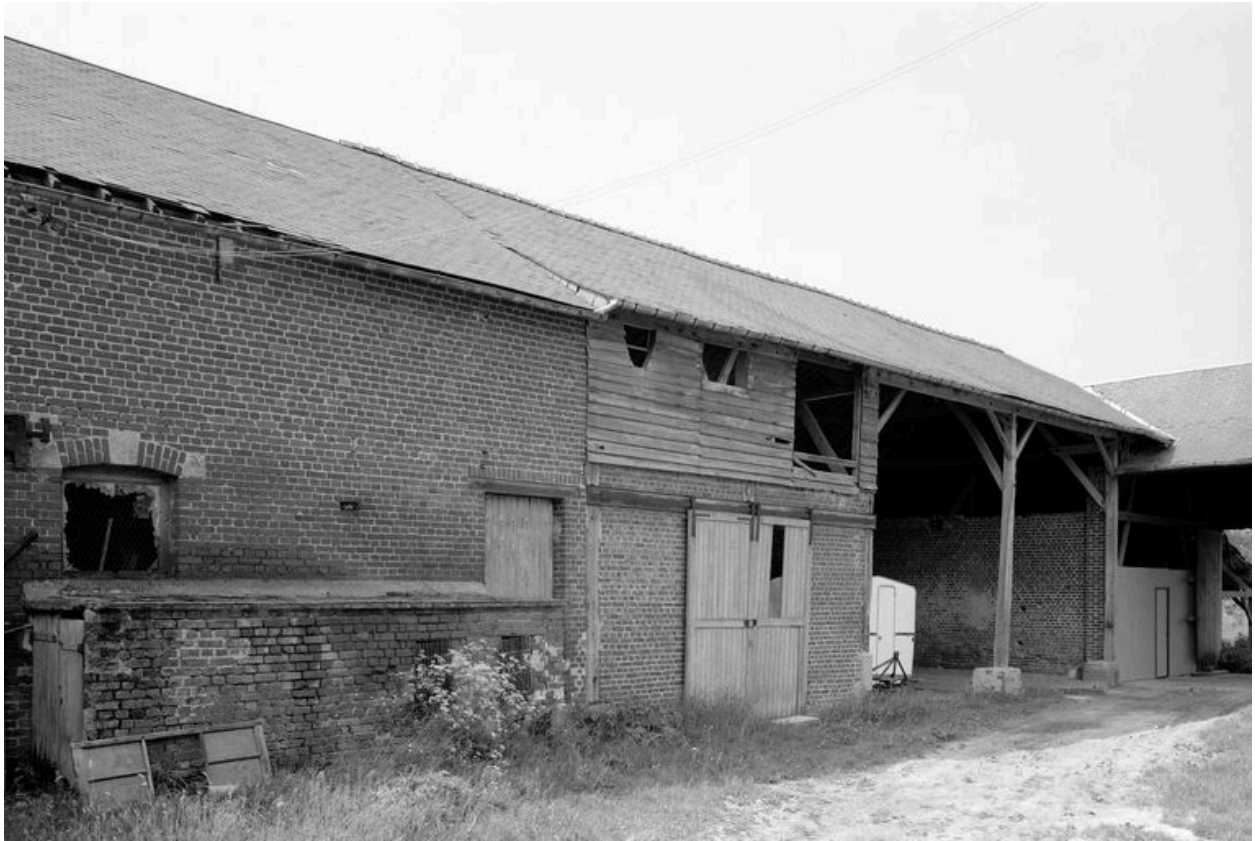
Grange et hangar.