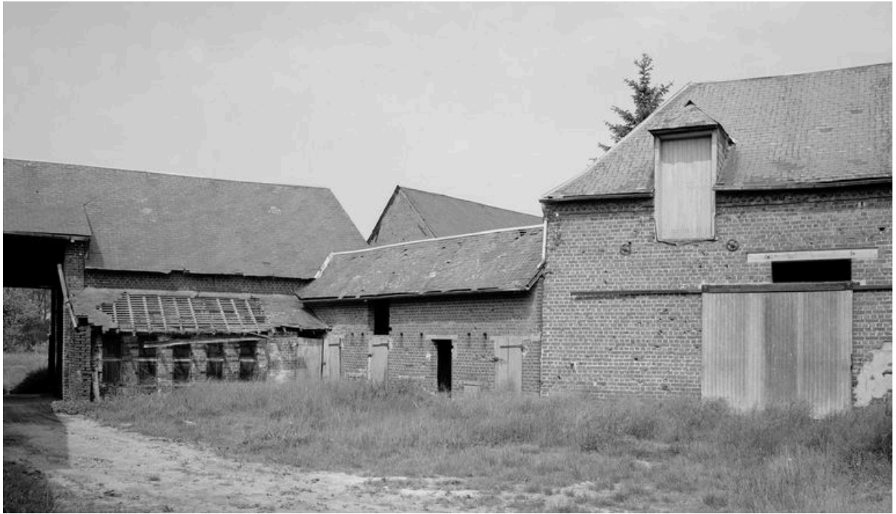
Grange et étable.