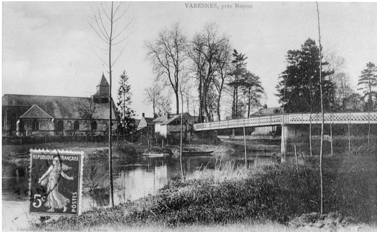
Vue avant 1914.