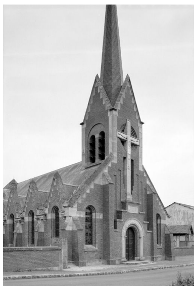
Façade occidentale.