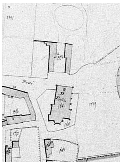
Extrait du cadastre napoléonien (DGI). IVR22_20096000543NUCA