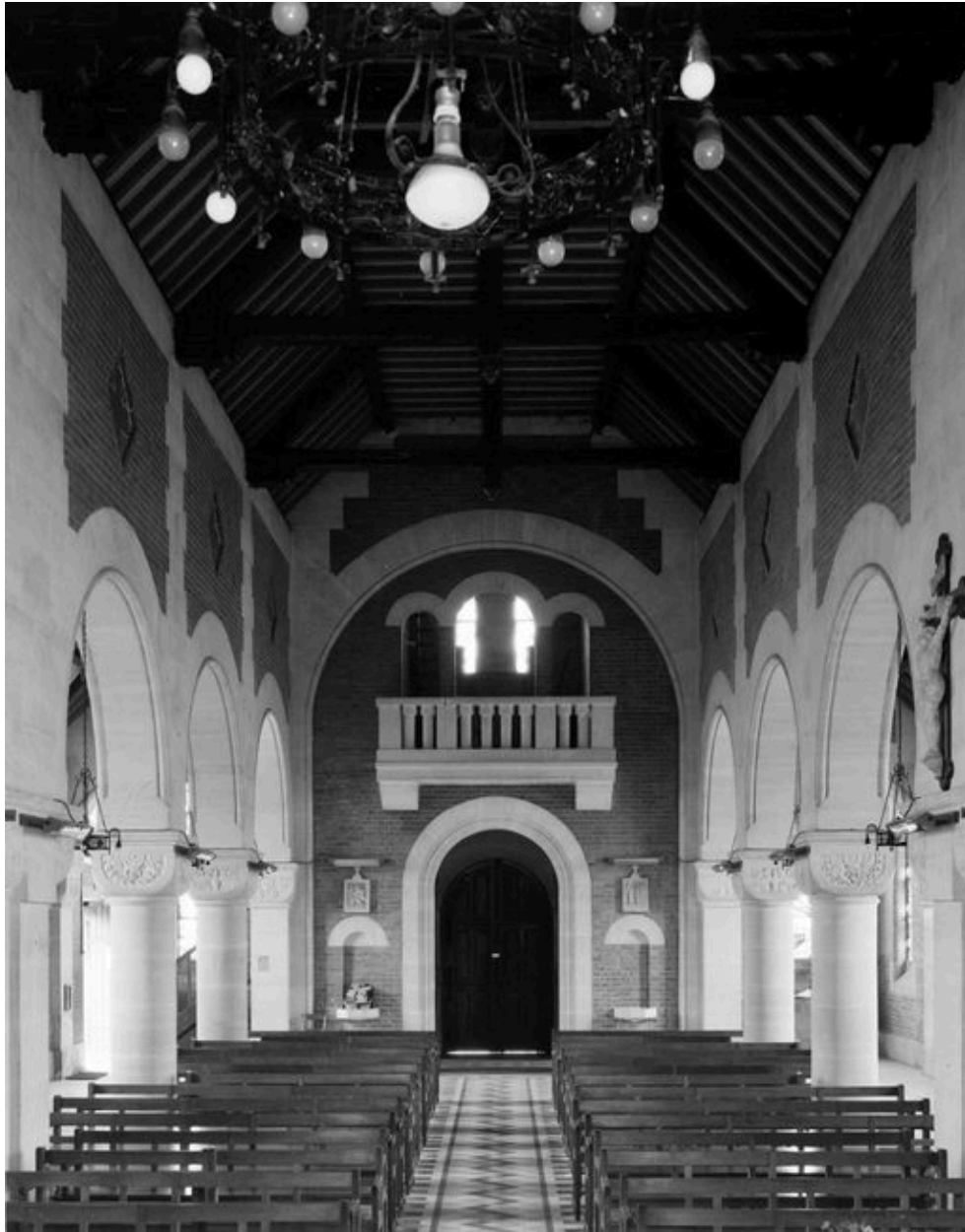
Vue intérieure vers l'entrée.