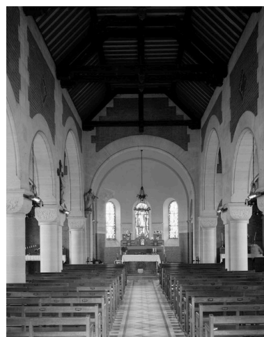
Vue intérieure vers le chœur. IVR22_19846001260V