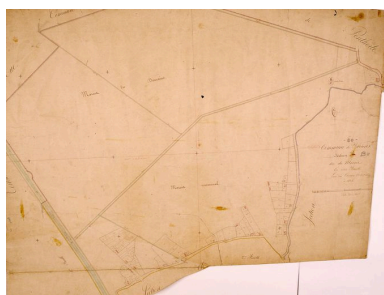
Vue de la section dite du Marais extrait du cadastre napoléonien de 1828.

IVR22_20078006061XAB