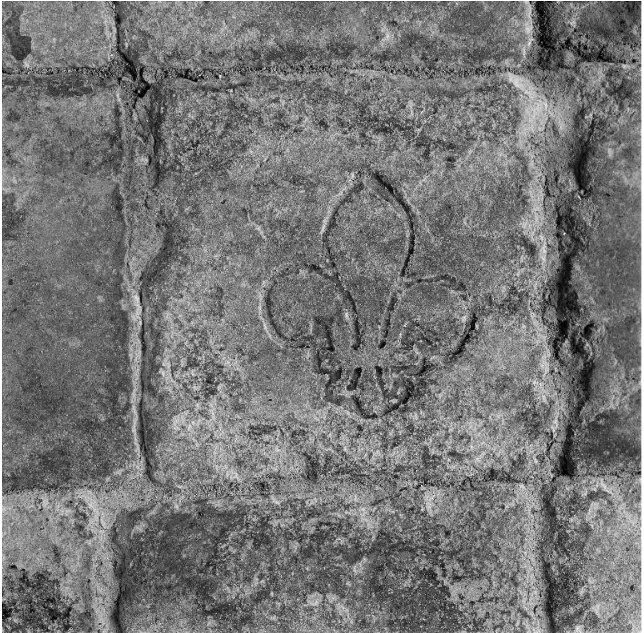
Vue d'un carreau orné d'une fleur de lys.