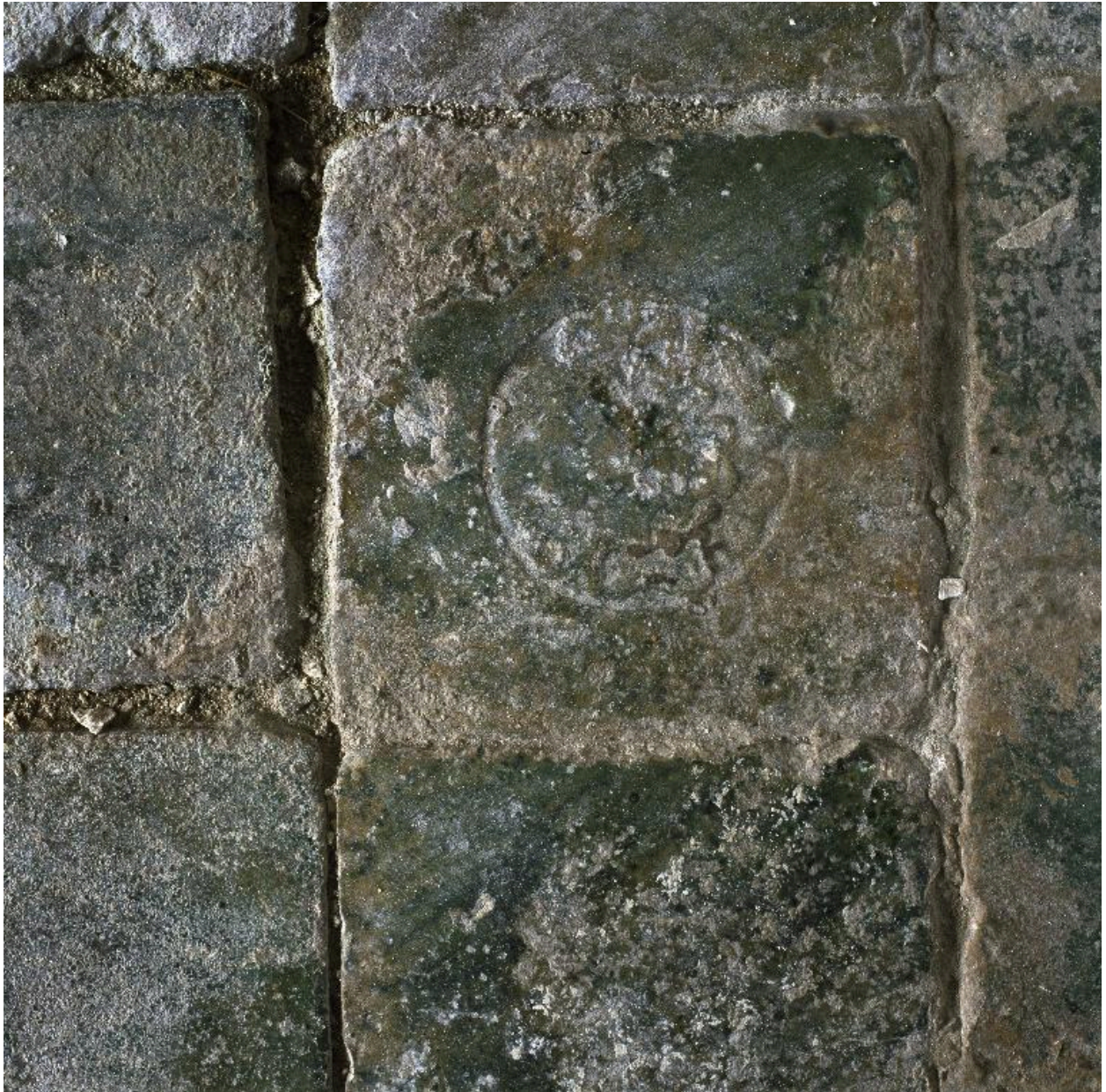
Vue d'un carreau orné d'une corolle de fleur.