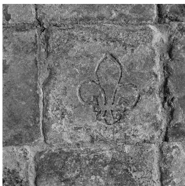
Vue d'un carreau orné d'une fleur de lys.