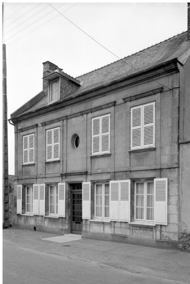
Elévation antérieure. IVR22_19846001055X