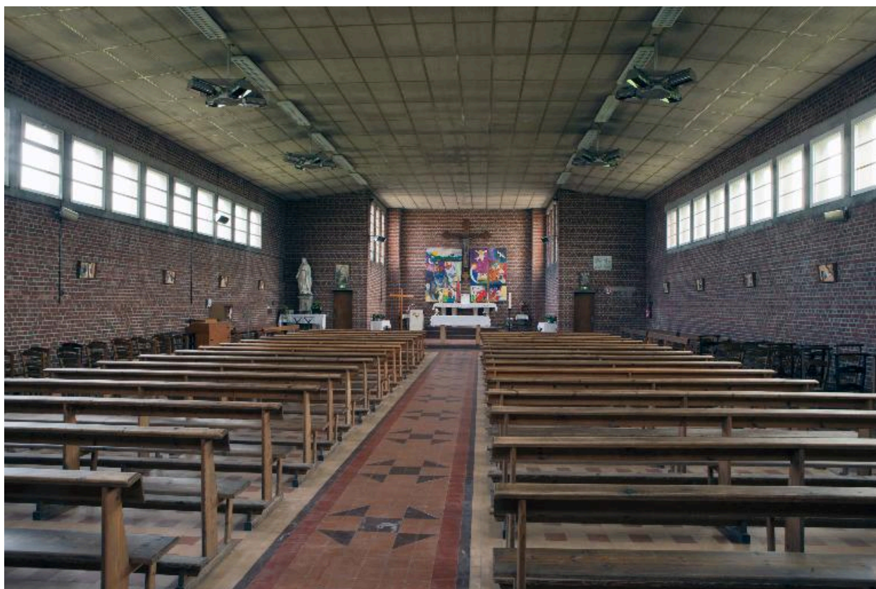
Vue intérieure vers le sanctuaire.