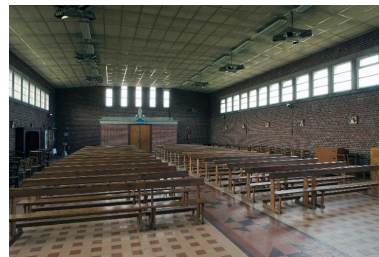
Vue intérieure vers l'entrée.