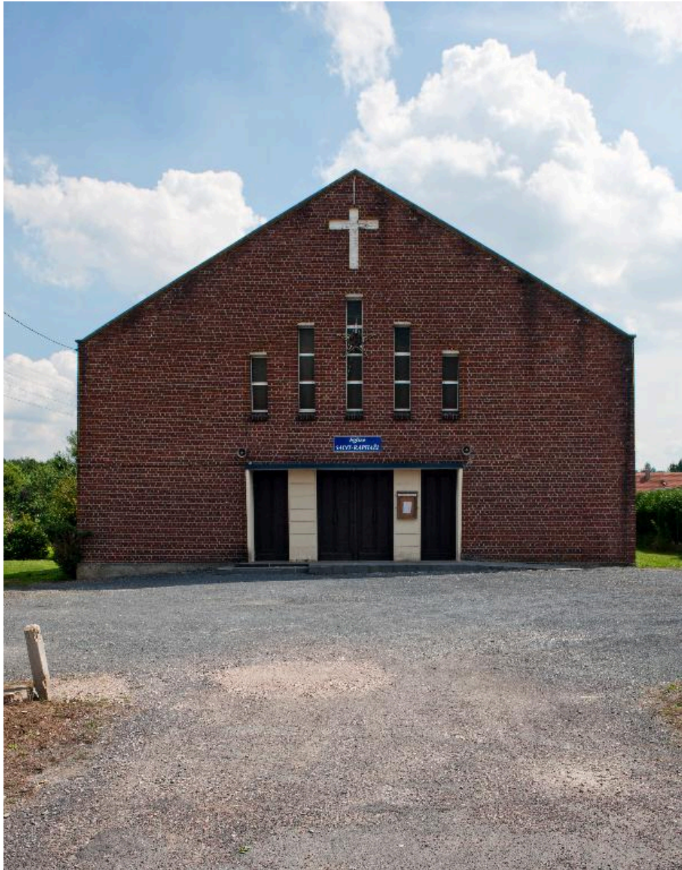
Vue de l'élévation antérieure.