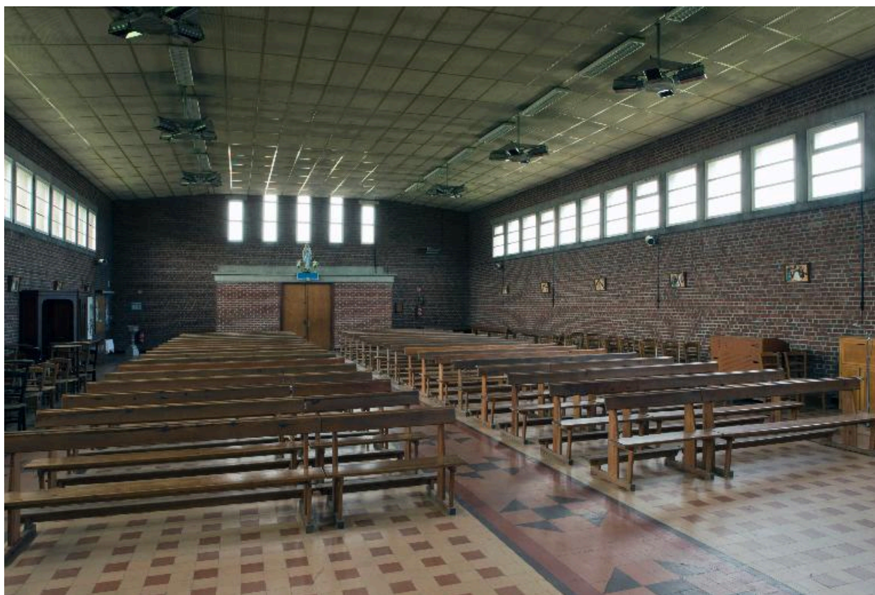
Vue intérieure vers l'entrée.