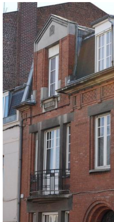
Vue sur la lucarne aux motifs et aux formes Art déco.