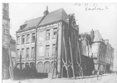
Vue des ruines de la maison du 7 rue Baudimont.