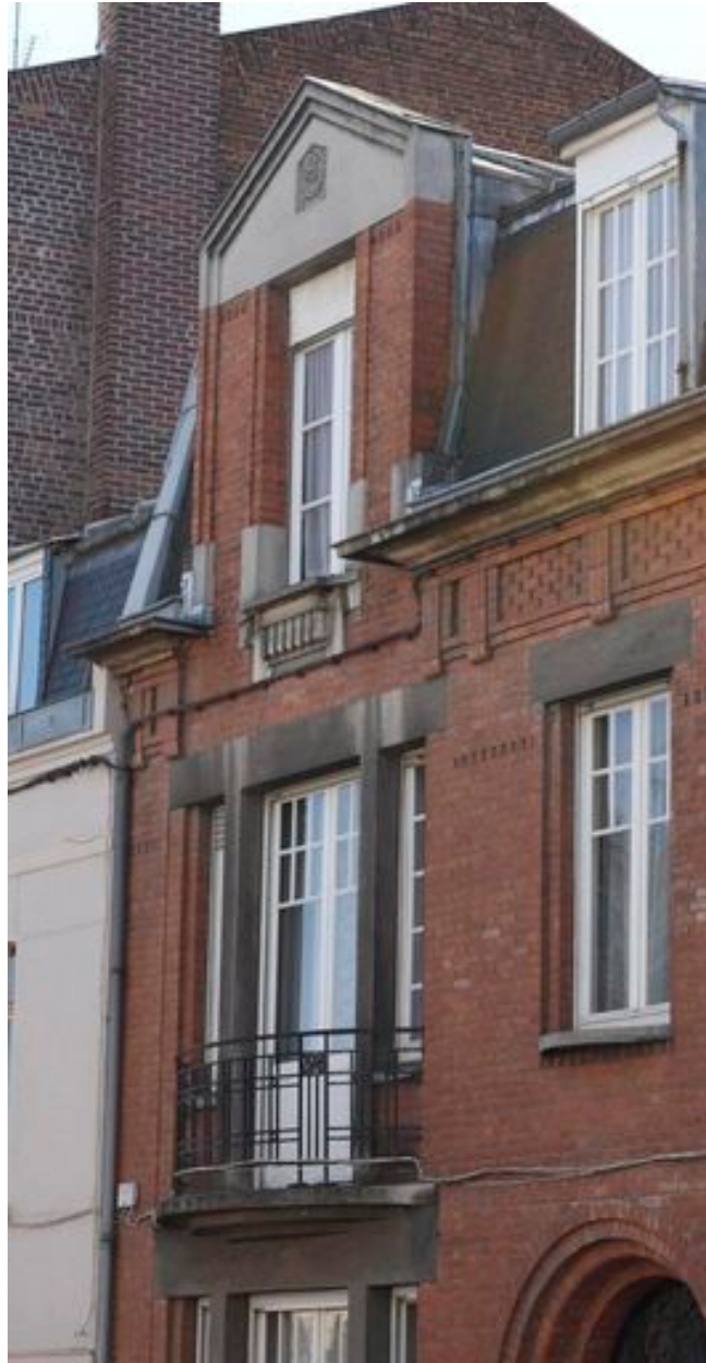
Vue sur la lucarne aux motifs et aux formes Art déco.