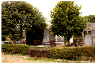
Vue de situation. IVR22_20038000900NUCA