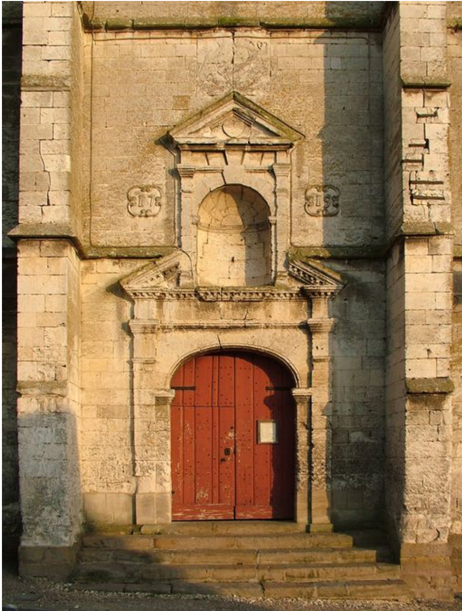
Le portail de l'église de Bourdon (Somme) portant la date de 1719.