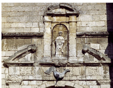
Frise, fronton brisé et édicule à niche.