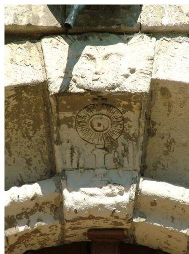
Clef de la porte ornée d'un soleil à tête humaine et d'un ostensor.

IVR22_20108001772NUCA